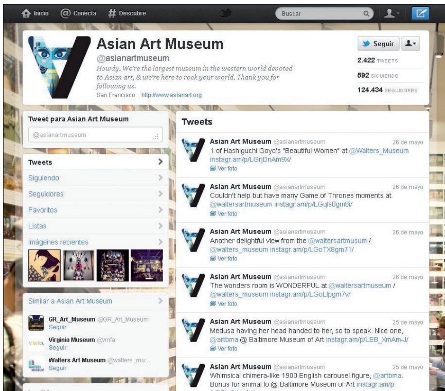
Perfil en Twitter del Asian Art Museum de San Francisco

Las aplicaciones sociales, entre las que se incluyen blogs, wikis, webs participativas, sitios de redes sociales o plataformas para compartir contenido, permiten una comunicación inmediata y sobre todo personal, próxima a los intereses reales de la gente. La institución museística es la encargada de conocer con exactitud a qué segmentos de público se dirige: la novedad radica en que ahora ha de ir a buscarlos, localizar las conversaciones que sobre ella misma se puedan estar produciendo y tener una presencia activa en aquellas plataformas donde su público –ya sea objetivo, no cautivo o potencial–, participa, intercambia opiniones o genera contenidos de interés para el museo.