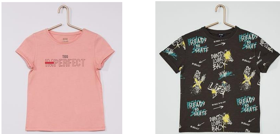
Fig. 1.: Camiseta de niña y camiseta de niño.

Esto se hace notar en el día a día de las personas de varias maneras, comenzando por la distinción de la ropa, en las tiendas no se logrará ver en ningún momento otra clasificación distinta a la de las secciones de “ropa de mujer” y “ropa de hombre”, incluso en la sección de “ropa de niño” podemos ver que la ropa está clasificada por el mismo patrón. Siguiendo el ejemplo de la vestimenta, los colores tienen una gran importancia a la hora de separar lo que es de niña o lo que es de niño, la ropa de las niñas normalmente está plagada de vestidos y camisetas de color rosa, morado o blanco, mientras que en la de los niños se opta por ropa de color azul, rojo o amarillo. Siguiendo la temática textil, también podemos ver que la ropa de los niños está llena de mensajes y dibujos motivadores, con superhéroes o frases que llaman la atención, mientras que la ropa de las niñas se basa en camisetas sin mensaje o, si tienen, están direccionados hacia la moda y la belleza.