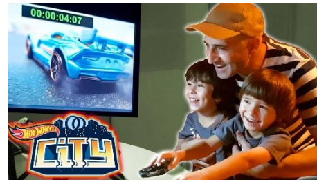
Fig. 3.: Niños con adulto jugando con coches. Fotograma anuncio Hotwheels City.

En los dibujos animados o series para público infantil/juvenil también se puede observar que hay distintos roles tanto para los adultos como para los niños, mostrándose sobre todo en la hora de actuar o de vestir. En muchas series las niñas no tienen una vestimenta lo que se dice estereotipada, se muestran usando pantalones, gorras, sudaderas, etc., lo cual se puede pensar que es un avance, pero realmente si nos fijamos en la trama es posible que las niñas vistan de esa manera porque “se juntan mucho con los chicos”. Pero hay otro tipo de trama que sí es un avance, que es aquella en la que las niñas comienzan a vestir de forma “menos femenina” porque no quieren vestir “como hacen todas las niñas”, siendo esto un buen referente para aquellos que lo ven, pues se dan cuenta de que todas las niñas