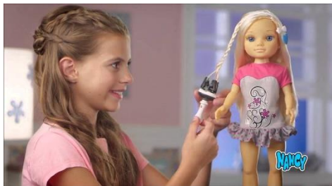
Fig. 2.: Niña con muñeca. Fotograma anuncio NANCY.