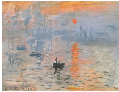
Impression, soleil levant - Claude Monet, 1872

Parmi les œuvres les plus célèbres de l'impressionnisme, nous pouvons repérer :