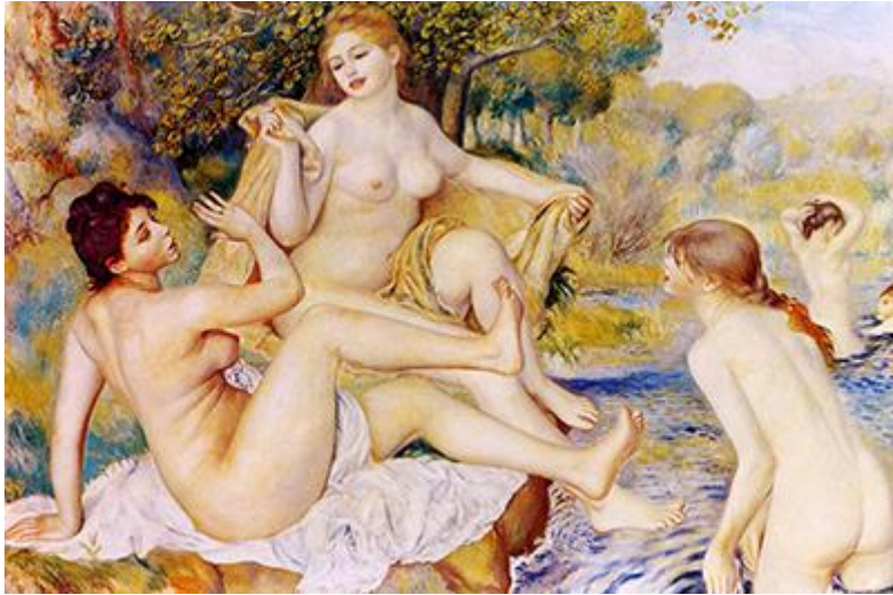
Les Grandes Baigneuses , Pierre-Auguste Renoir 1884-1887

Comme on peut le constater, dans cette sélection d'œuvres de Renoir, le naturel de la scène, la couleur et surtout les femmes abondent. Le déjeuner des canotiers et Les Grandes Baigneuses présentent tous deux sa femme, Aline Charigot, qui était sa muse et son idéal de beauté. Nous verrons ensuite comment son fils, Jean Renoir, a saisi certaines œuvres importantes de son père dans son film Une partie de campagne .