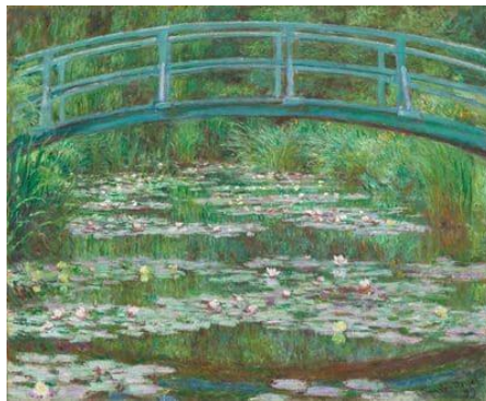
Le Bassin aux nymphéas, harmonie verte – Claude Monet, 1899