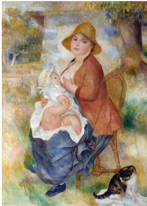
La maternité , Pierre-Auguste Renoir 1885

En 1885, leur premier fils, Pierre, est né et, un an plus tard, l'artiste compose un tableau avec Aline et son fils, La maternité .