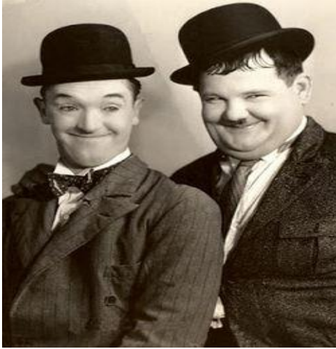
Laurel et Hardy