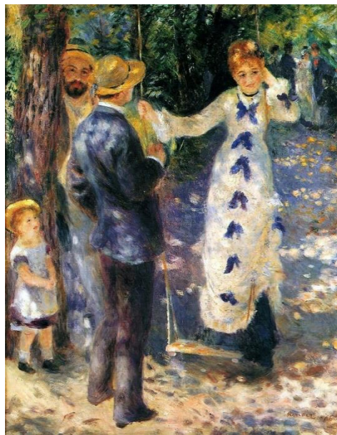
La Balançoire , Pierre-Auguste Renoir 1876