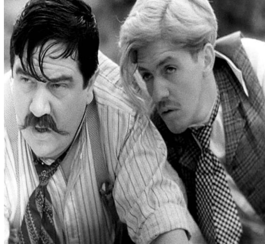
Monsieur Dufour et Anatole dans le film

Nous ne trouvons pas seulement des similitudes au niveau comique mais aussi au niveau de leur apparence, ils sont comme « le gros et le maigre ». Le personnage qui montre le plus de passion pour la nature est Henriette. La jeune fille a une conversation avec sa mère dans laquelle elle lui dit que l'environnement lui procure une sensation étrange mais très agréable, elle se sent vivante. C'est le sentiment que les impressionnistes ont montré au moment de réaliser leurs œuvres puisqu'ils ont capturé des moments de bonheur et de lumière comme celui que vit la famille en ce moment.