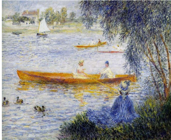
Canotiers à Argenteuil , Pierre-Auguste Renoir 1873.

Pour parler de Jean Renoir, l'enseignant montrera à ses élèves les films les plus importants qu'il a réalisés au cours de sa vie, en se concentrant notamment sur Une partie de campagne , qui sera analysé plus en profondeur lors de la deuxième séance.