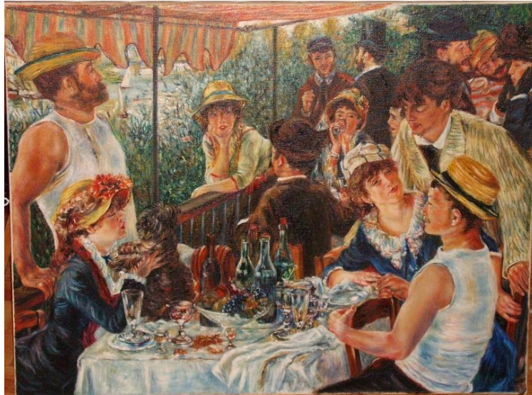
Le déjeuner des canotiers , Pierre-Auguste Renoir 1881