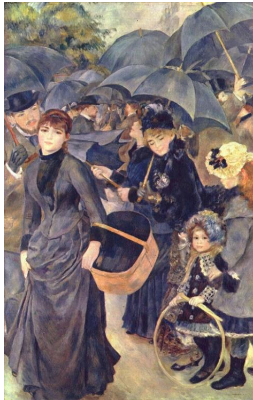
Les Parapluies , Pierre-Auguste Renoir 1883