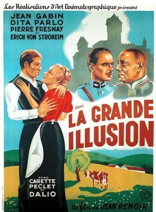
La Grande Illusion , Jean Renoir 1937

Pour parler de Jean Renoir, l'enseignant montrera à ses élèves les films les plus importants qu'il a réalisés au cours de sa vie, en se concentrant notamment sur Une partie de campagne , qui sera analysé plus en profondeur lors de la deuxième séance.