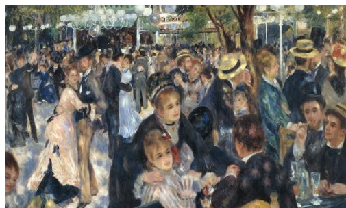
Bal au Moulin de la Galette – Pierre-Auguste Renoir, 1876