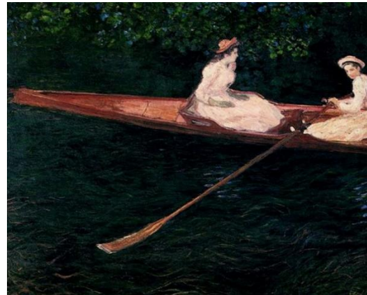
Les Canotiers à Chatou , Pierre-Auguste Renoir 1879 et En canot sur l'Epte , Claude Monet 1890