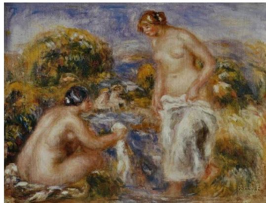
Femmes au bain , Pierre-Auguste Renoir 1915-1916