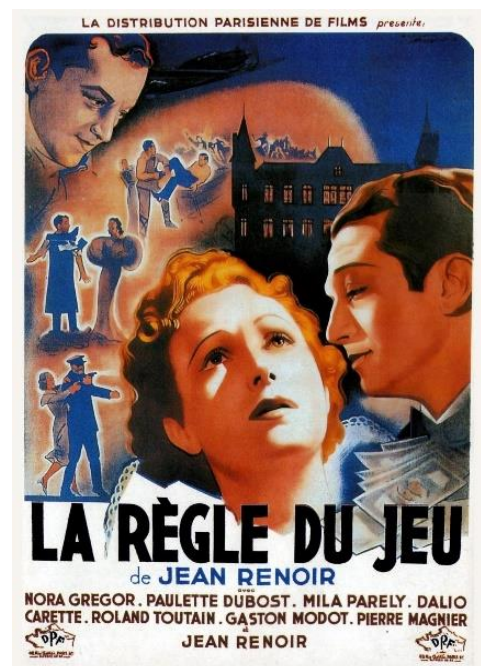
La Règle du jeu , Jean Renoir 1939