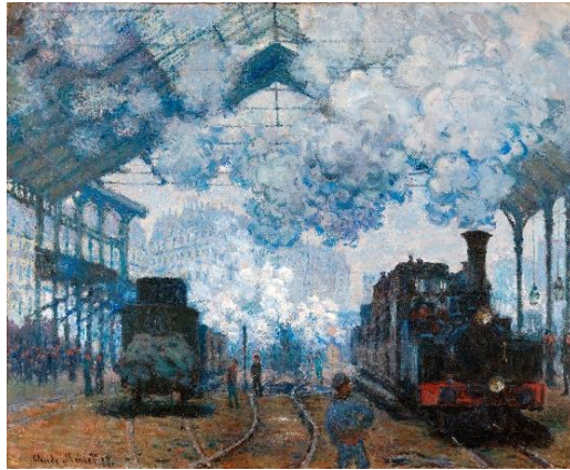
La Gare de Saint-Lazare, arrivée d'un train, Monet 1877

En ce qui concerne l'art impressionniste de Renoir, il n'a pas peint les conséquences du progrès de la société (comme Monet a pu le faire avec « ses trains et ses gares »). Malgré cela, ses œuvres sont populaires et montrent des scènes de la vie quotidienne comme d'amusantes réunions en plein air, des portraits, des moments d'intimité... tout cela avec un bonheur transcendant « Crois-moi, tout se peint. Bien sûr il vaut mieux peindre une jolie fille ou un paysage agréable. Mais tout se peint » (Renoir, 2020 : 142-143).