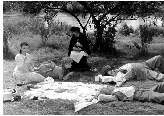
Le Déjeuner sur l'Herbe , Édouard Manet 1863

Tant dans le tableau de Manet que dans le film, la jeune femme est celle qui attire le plus l'attention en raison de sa nudité (dans l'œuvre de Manet) et de sa robe blanche (dans le cas du film). Ce ne sont pas seulement les canotiers qui ont annoncé que le mauvais temps arrive, mais aussi la famille et la femme qui leur sert leur repas. Madame Dufour essaie de flirter avec son mari mais celui-ci l'ignore car Anatole et lui sont ivres et un peu endormis. Comme les hommes ne leur prêtent aucune attention et se réveillent pour aller chercher de l'eau, les canotiers profitent de ce moment pour chercher les femmes et les combler de leur galanterie. Finalement, ils les persuadent d'aller se promener le long de la rivière et Monsieur Dufour et Anatole ne s'y opposent pas car ils vont pêcher et sont totalement innocents, laissant leurs femmes aux mains de ces grotesques canotiers. Madame Dufour est parfaitement heureuse de ce qu'ils vont faire puisque, comme nous l'avons déjà dit, son mari ne l'écoute pas.