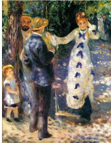
La Balançoire , Pierre-Auguste Renoir 1876