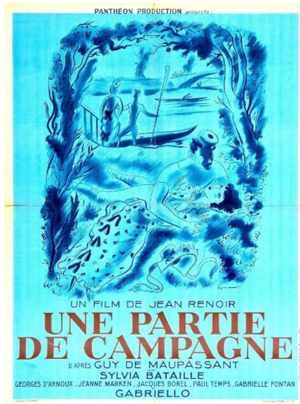
Une partie de campagne, Jean Renoir 1936

Pour terminer la première séance, l'enseignant montrera à ses élèves une courte vidéo sur l'influence de Pierre-Auguste Renoir sur les films de son fils :