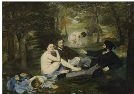
Le Déjeuner sur l'Herbe -Édouard Manet, 1863