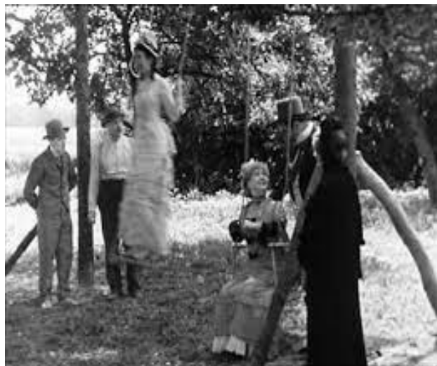
La balançoire des deux Renoir 1876 et 1936.