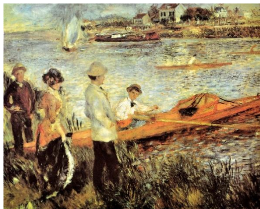
Les Canotiers à Chatou , Pierre-Auguste Renoir 1879