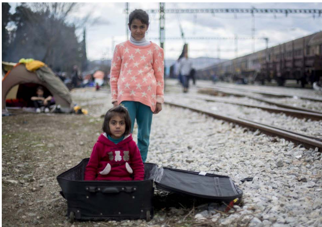
Figura 11: Una de los caminos de viaje que lleva a cabo los refugiados de distantes partes del mundo es a través de los trenes y sus respectivas vías. Igancio Gil