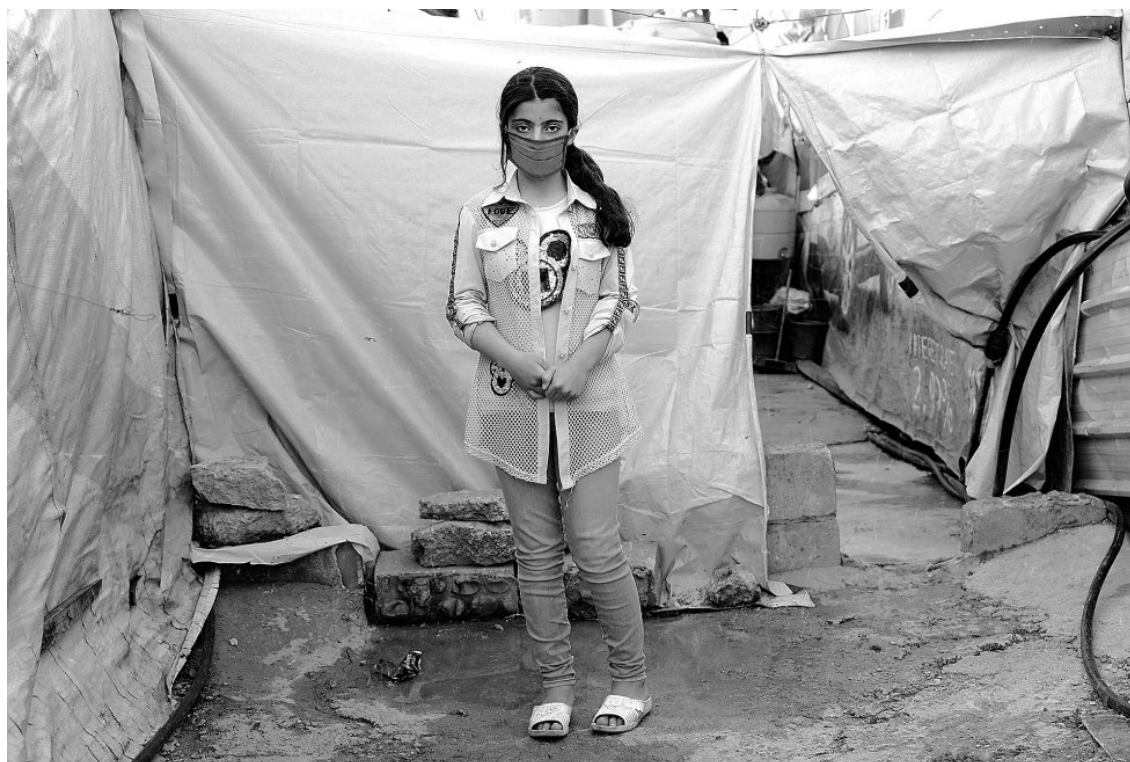
Figura 17: Niña en un campo de refugiados en época de coronavirus en el valle de la Bekaa, Líbano. Kayla Robertson