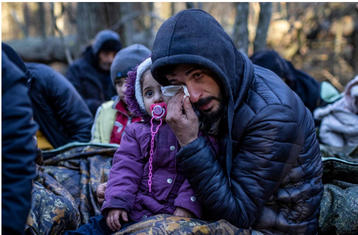
Figura 18: Refugiados afganos en las fronteras europeas, Biolorrusia-Polonia. Wojtek Radwanski