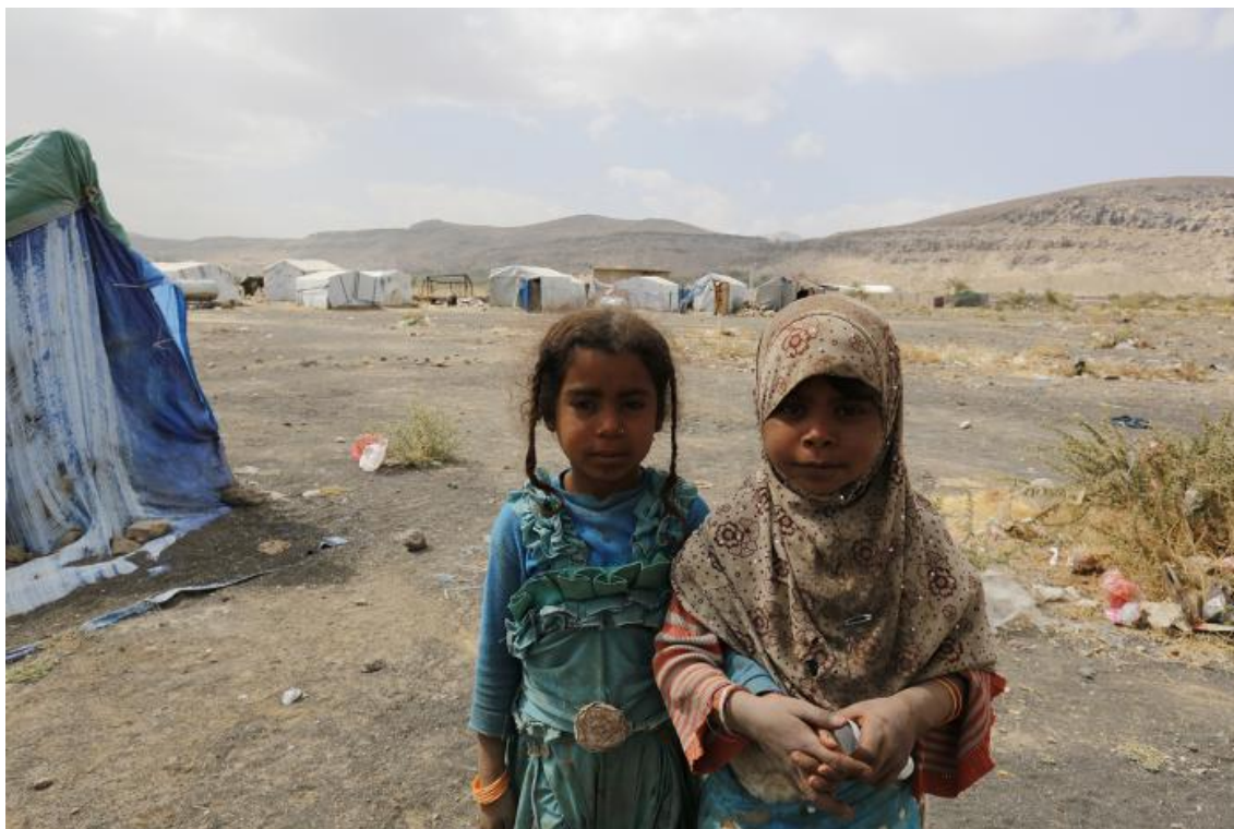
Figura 1: El reflejo de la pobreza y condiciones de vida en África. Organización de ACNUR, 2017