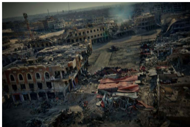
Figura 4: La destrucción en un plano general de una de las ciudades de Oriente Medio tras la guerra. Ricardo García Vilanova

Fuente: Fade to Black 2011-2019- Rise and Fall of the Caliphate of ISIS- Syria, Iraq and Libya- Syria (2011-2013)