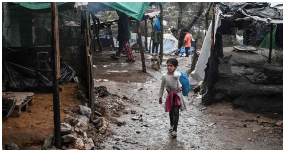
Figura 2: Condiciones de vida en el campamento de refugiados de Moria en la isla de Lesbos, Grecia. Santi Palacios