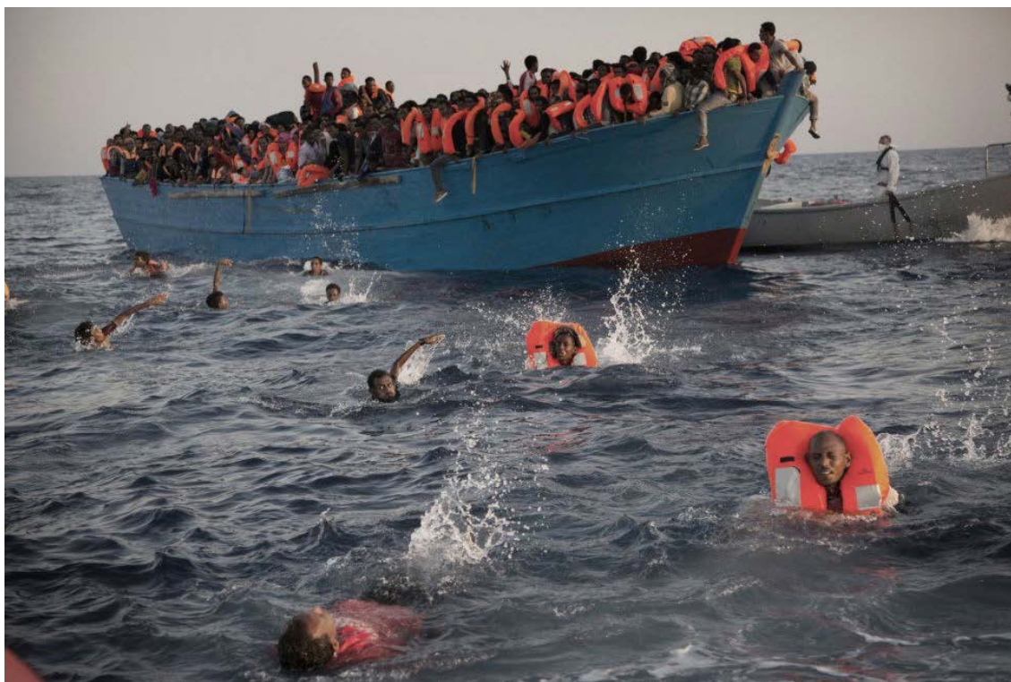
Figura 15: Personas saltan al agua en el mar Mediterráneo. Emilio Morenatti

personas más vulnerables en aguas internacionales que huyen de un conflicto, colaboran con equipos sanitarios y de investigación para afrontar dichas emergencias.