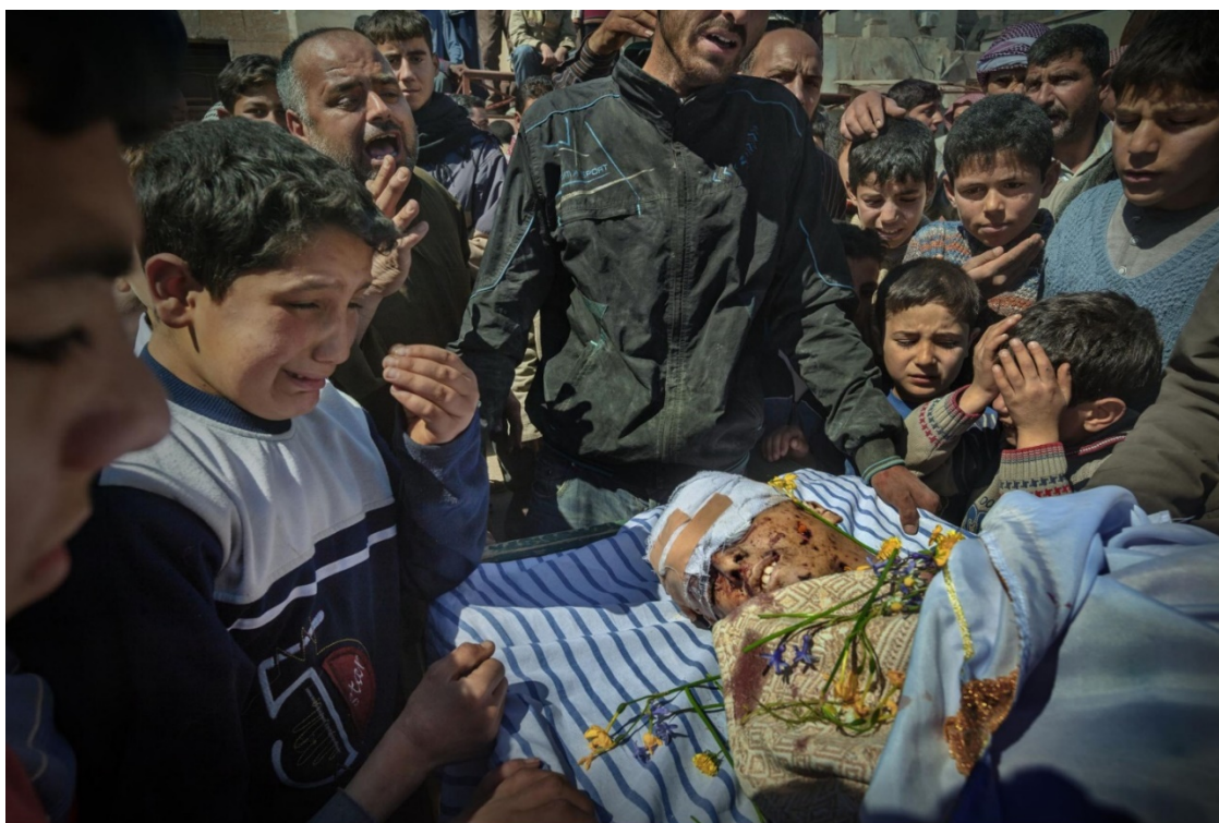
Figura 8: Niños viendo con sus propios ojos a una persona muerta. Ricardo García Vilanova