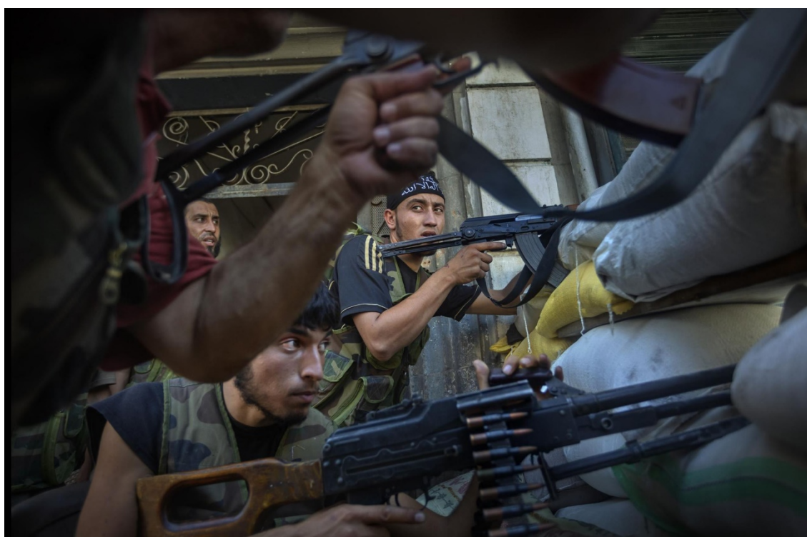
Figura 6: Hombres frente a un ataque con armamento en plena guerra. Ricardo García Vilanova

Fuente: Fade to Black 2011-2019- Rise and Fall of the Caliphate of ISIS- Syria, Iraq and Libya (2014-2019)