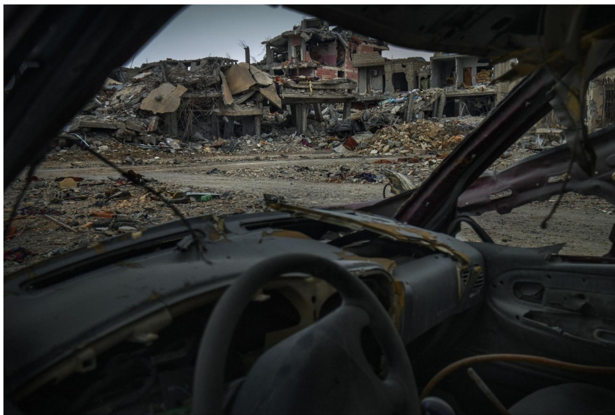
Figura 5: Plano general más detallado en el interior de en una de las ciudades pertenecientes a Oriente Medio tras las continuas bombas.