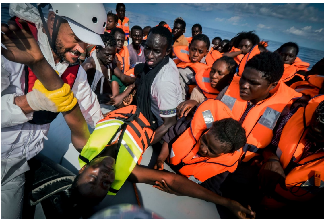
Figura 10: Personas en el mar Mediterráneo huyendo de Libia. Ricardo García Vilanova.

Entre los lugares más destacados de estas rutas se encuentra: el desierto de Sahara, la bahía Bengala y el mar Mediterráneo. Una nueva ruta que ha surgido este último año convirtiéndose en un riesgo para las personas que la llevan a cabo, es la ruta canaria. También están las rutas del sur al norte donde un 90% de personas africanas que se desplazan debido a la violencia que hay en su país, y las rutas de sur a sur cómo las de los países de República Democrática del Congo, Sudán del Sur o República Centroafricana.