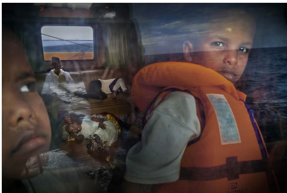
Figura 13: Salvamiento en el mar, Libia. Ricardo García Vilanova

Fuente: The Lybian Crossroad, 2011-2020-Deadly Passage to Europe. Sea and Land