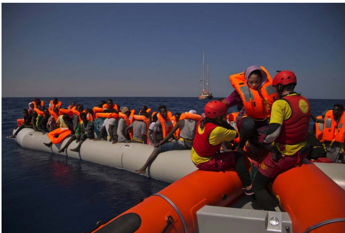
Figura 16: La ONG Proactiva Open Arms rescantando un bote de migrantes nigerianos, cerca de la costa de Libia.

En casa te puedes creer todo lo que te dicen, pero cuando estás aquí ves la realidad y no te la crees, es como cuando te enteras de que los reyes son los padres, pues cuando te enteras de que Europa no existe, no tiene poder, de que no está haciendo nada, de que eso es una decisión de los 28, eso te desanima (Camps, 2016).