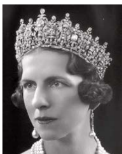
Helena, 3ª hija de Constantino I, Reina de Rumanía