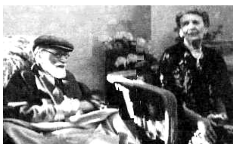
Marie Bonaparte con su maestro Sigmund Freud, a quien ayudó a escapar de los nazis