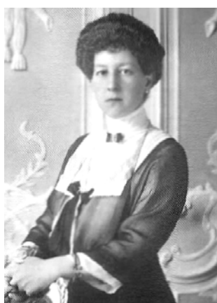
María, 5ª hija de Jorge I