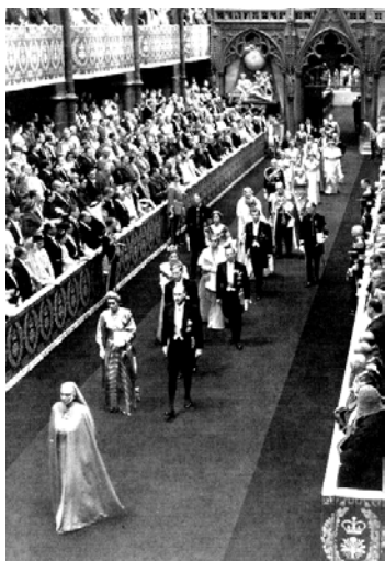
La princesa Alicia, de hábito, en la coronación de Isabel II de Inglaterra (1947), casada con su hijo Felipe.