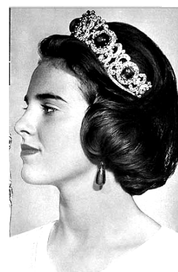
Ana Mª de Dinamarca, esposa de Constantino II