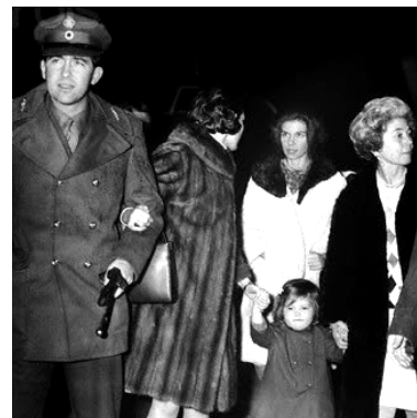
Constantino I y Ana M a , con su hija, Alexia, la Reina madre, Federica, y la princesa Irene parten al exilio.