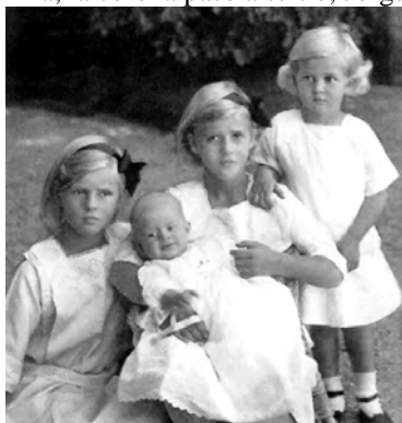
Las 4 hijas mayores del Príncipe Andrés y Alicia: Margarita, Teodora, Sofía, y Cecilia.