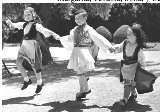
Príncipes Sofía, Constantino e Irene, hijos de Pablo I