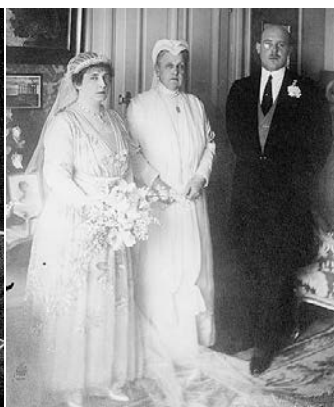
Cristóbal, el día de su boda con Nancy Leeds (convertida en princesa Anastasia). En el centro, su madre, la Reina Olga