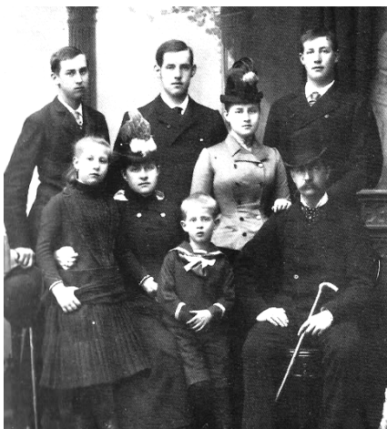
Jorge I y Olga con sus 6 hijos mayores