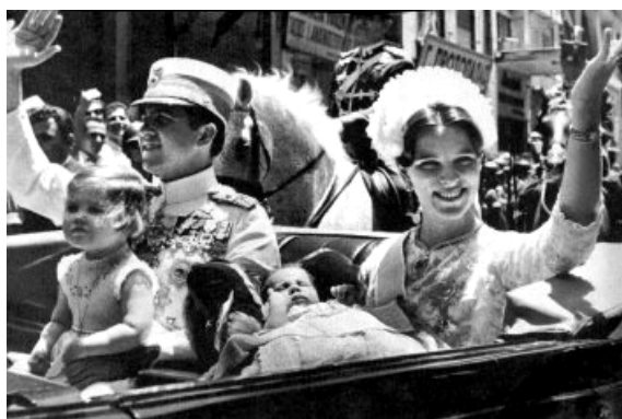
Constantino II y Ana Mª con sus dos hijo mayores: la princesa Alexia, y el príncipe heredero, Pablo, en el bautizo de éste último.