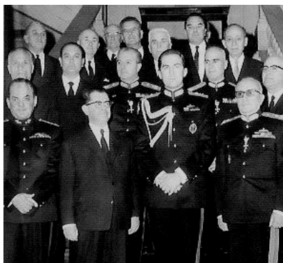
Constantino II con la Junta Militar golpista (1967)