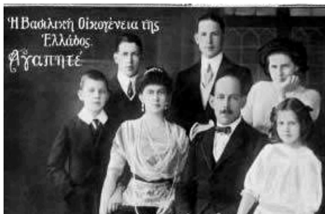
Constantino I y Sofía con sus 5 hijos mayores