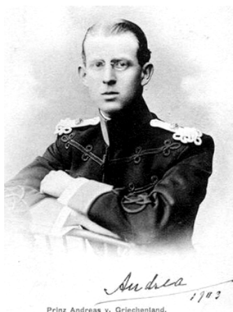
Andrés, 7º hijo de Jorge I