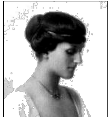
Aspasia, esposa morganática de Alejandro I. Se casaron en secreto. Nunca fue reconocida Reina.