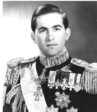
Constantino II, hijo de Pablo I, último Rey de Grecia