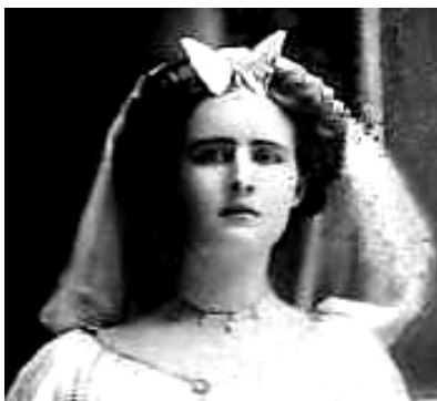
Elizabeth de Rumania, esposa de Jorge II