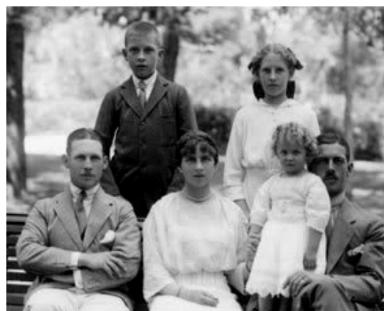
Los 6 hijos de Constantino I: de pie, Pablo e Irene. Sentados: Jorge, Helena, Katerina y Alejandro