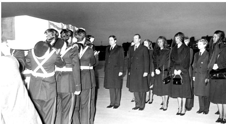
Entierro de la ex Reina Federica en Tatoi (1981). De izda a dcha: ex Rey Constantino, Rey Juan Carlos de España, Reina Sofía de España, ex Reina Ana M a , príncipe Felipe de España e Irene.