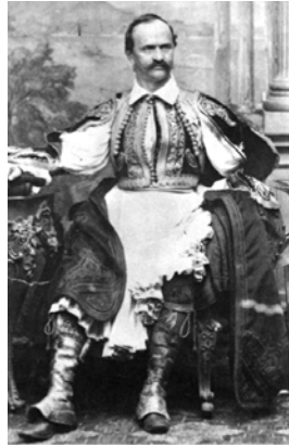
Otón I, con traje tradicional griego (1865)