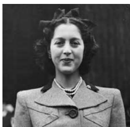
Alejandra, hija póstuma de Alejandro I. De haber nacido varón habría sido el nuevo Rey. Al nacer niña, la corona pasó a su tío, Jorge.