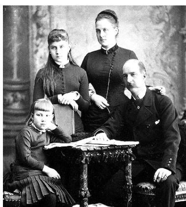
Jorge I y Olga con sus hijas Alejandra y María