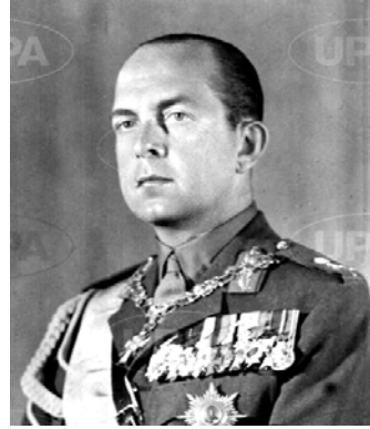
Pablo I , tercer hijo de Constantino I