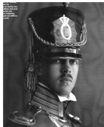
Alejandro I, segundo hijo de Constantino I