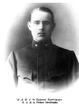
Cristóbal, 8º hijo de Jorge I