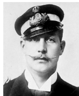
Príncipe Jorge, 2º hijo de Jorge I