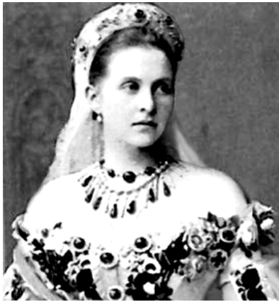
Olga de Rusia, esposa de Jorge I