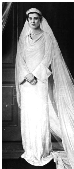
Marina, hija de Nicolás, el día de su Boda con el Duque de Kent.