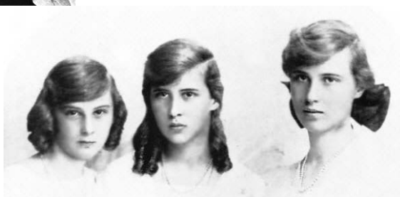
Las 3 hijas de Nicolás y Helena de Rusia: Marina, Elizabeth y Olga.