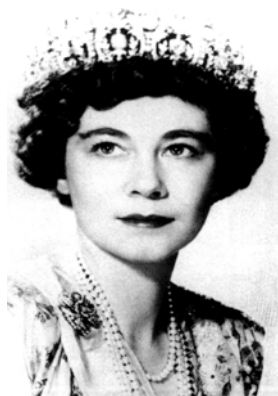
Federica de Hannover, esposa de Pablo I