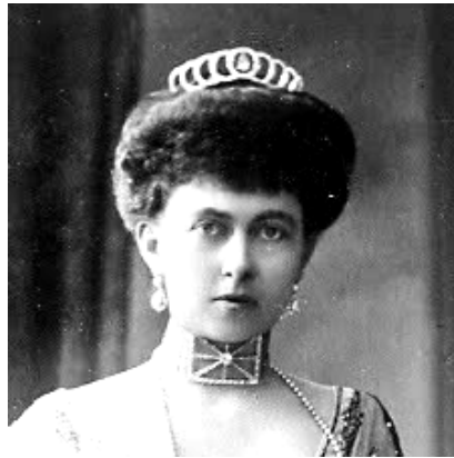
Sofía de Prusia, esposa de Constantino I