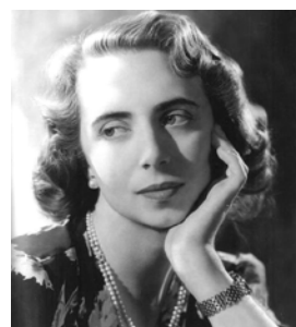
Katerina, 6ª hija de Constantino I