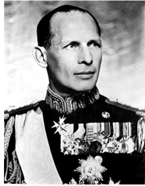
Jorge II, primogénito de Constantino I.