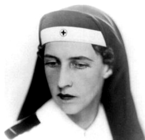
Irene, 5ª hija de Constantino I