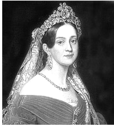
Amalia , esposa de Otón I