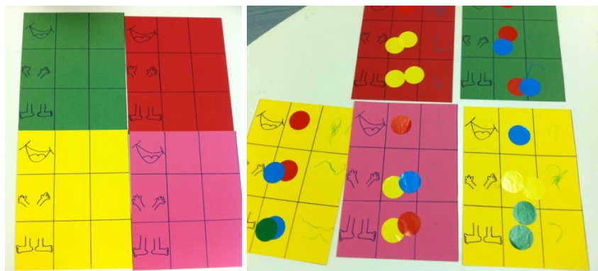
Figura 4. Partes del cuerpo