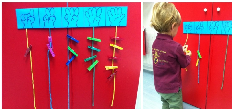
Figura 2. Actividad de conteo