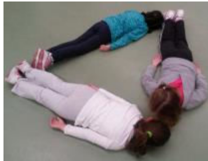
Figura 2. Construcción de triángulos con el cuerpo

Cuando se hace la propuesta de agruparse de cuatro en cuatro para formar cuadrados, se agrupan de nuevo como quieren, pero esta vez la maestra actúa: