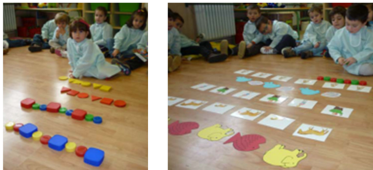
Figura 9. Seriaciones con distintos tipos de materiales

Se hacen seriaciones con material no estructurado (tapones de diversos tamaños, formas y colores) y con material estructurado (bloques lógicos, tarjetas de conceptos gráficos, formas figurativas o abstractas...) (Figura 9).