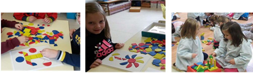
Figura 4. Actividades para manipular libres y pautadas

Conseguida ya cierta familiaridad con las figuras geométricas, nos enfrentamos a localizarlas en las estructuras arquitectónicas que encontramos en la Calle Mayor de la ciudad. Se van a ir intercalando los descubrimientos en la excursión con las actividades posteriores en el aula.