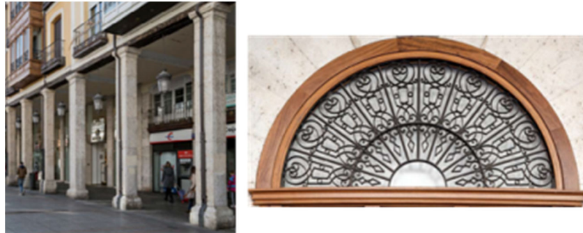
Figura 12. Columnas en la calle y parte superior de una puerta