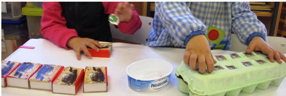
Figura 4. Niños en distintas situaciones

matemáticas no jugaba todas las situaciones seguidas. A lo mejor jugaba las situaciones 1, 2 y 3 y después decidía cambiar de rincón o, al fallar en la primera situación, prefería intentarlo de nuevo otro día. Nos encontrábamos por tanto con niños que acudían al rincón, pero que estaban en situaciones diferentes (Figura 4). Había que mirar en qué punto se había quedado cada alumno y modificar las variables didácticas correspondientes para que siguiese avanzando.