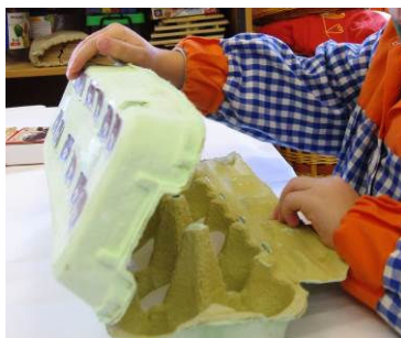
Figura 13. Abriendo la huevera para establecer un control visual

Por último, es destacable que en esta situación varios alumnos abren la huevera en algún momento del proceso de alimentación de los camaleones para intentar tener un control visual de los grillos introducidos (Figura 13).