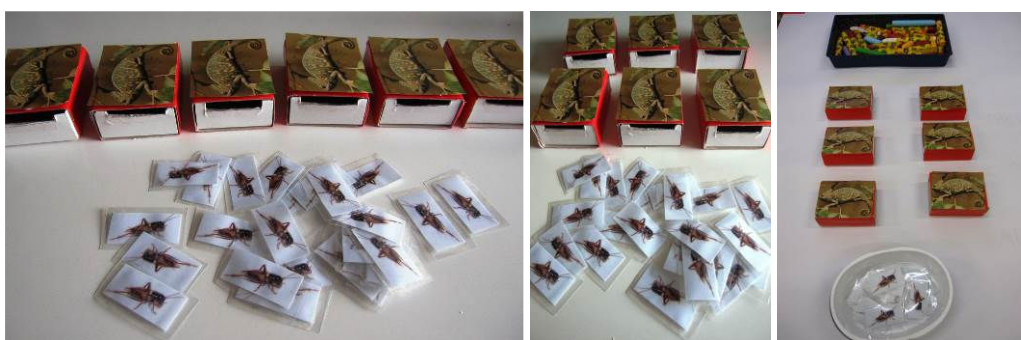
Figura 2. Situaciones 1, 2 y 3

Situación 3: En un tercer momento, mantenemos el mismo material y disposición, pero ahora las cajas están pegadas a un papel continuo situado sobre la mesa, en el que se puede pintar. Se deja sobre el papel también una caja de útiles de escritura (Figura 2). Como no se pueden mover las cajas, no es posible usar estrategias que podían haber puesto en marcha antes, como separar las cajas con comida de las vacías o agitarlas para ver si suena la comida dentro de ellas. Pueden utilizar el azar para alimentar a los camaleones o utilizar las estrategias óptimas: seguir un orden de alimentación por filas o columnas, de acuerdo con la disposición de las cajas, o marcar las que ya tienen alimento.