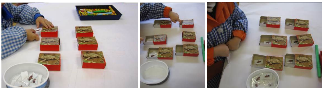
Figura 11. Introduciendo grillos. Inés validando su primer intento (perdió) y el último (ganó)

Inés sigue el orden de una de las dos filas de la disposición de dado empezando una y otra vez hasta que se terminan todos los grillos disponibles (Figura 11). Después mete toda la comida en la misma caja durante varios intentos. De nuevo gana cuando estoy más pendiente de ella, siguiendo el orden de las filas de la disposición de dado.