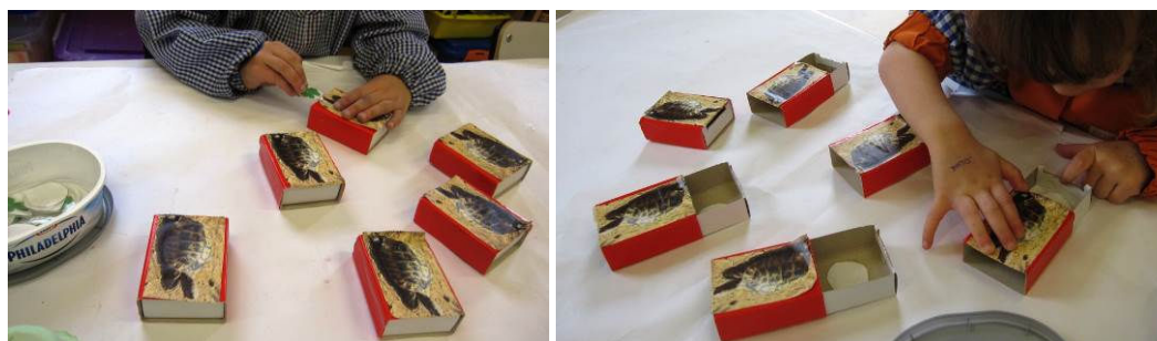
Figura 15. Introduciendo tréboles en las cajas y validando el resultado

Abril también mueve las cajas, apartando aquellas en las que ya ha introducido un grillo, y formando así dos subcolecciones: alimentados y sin alimentar, lo que le permite controlar la colección y ganar. Alberto, que había ganado en la situación 2 agitando las cajas, vuelve a utilizar esta estrategia con éxito. El resto de los alumnos realizan desde su primer intento un "barrido" del espacio, de arriba hasta abajo o de un lado a otro introduciendo los grillos en las cajas que se van encontrando y llevando el control del proceso sin necesidad de mover las cajas (Figura 15). Sólo Mario mete la comida al azar en los tres intentos anteriores a la utilización de esta estrategia.