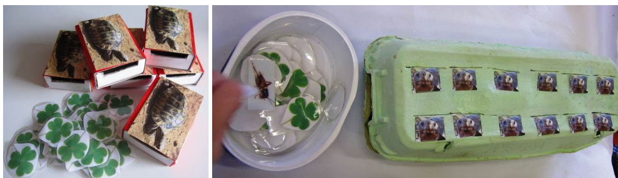
Figura 5. Tortugas y tréboles

Mi rincón de matemáticas tiene una capacidad de seis niños, pero durante las sesiones en las que realizamos esta actividad (y debido a la necesidad de documentarla con fotos y datos) sólo podían jugar dos niños a la vez. El resto podía esperar a que les tocara su turno. Se realizó por tanto otra copia del material que, para que fuese más motivador el juego, consistía en las mismas cajas pero forradas con fotos de tortugas (otro reptil) y su alimento, tréboles (Figura 5).