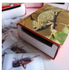
Figura 1. Cajas-camaleón y grillos

En el mes de Enero iniciamos un pequeño proyecto en torno a los camaleones. La situación a través de la cual trabajaríamos la enumeración se plantearía como un juego para los alumnos en el cual, para ganar, tendrían que alimentar correctamente a los camaleones, dando de comer un grillo y sólo uno a cada camaleón y no dejando a ningún camaleón sin comer. Comenzamos presentando seis cajas de cerillas forradas con la foto de un camaleón y con una ranura en una de las caras. Ofrecemos alrededor de 20 grillos impresos en papel y plastificados que pueden introducirse por dicha ranura (Figura 1). Dejando muchos más grillos que cajas, favorecemos que el alumno vaya seleccionando en orden las cajas, según tengan o no grillo, y no tenga en cuenta los grillos que quedan por introducir. Si los grillos fuesen justo 6 o alguno más, sería más fácil saber cuándo pueden haber comido todos los camaleones.