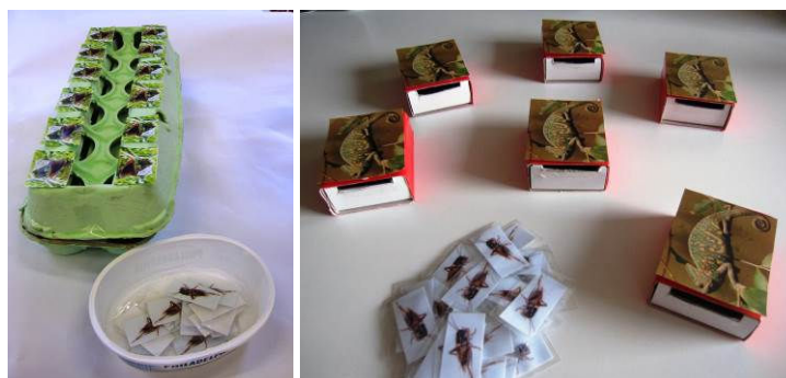
Figura 3. Situaciones 4 y 5

Situación 5: A continuación volvemos a las 6 cajas-camaleón. Ahora las disponemos sobre la mesa de forma aleatoria (Figura 3). Al poderse mover, esperamos que agiten las cajas para saber si han sido o no alimentados los camaleones. Serían estrategias más eficaces clasificar las cajas en dos montones (con comida-sin comida) a medida que van introduciendo los grillos o hacer mentalmente esta clasificación, estableciendo un orden de la misma sin necesidad de mover las cajas.