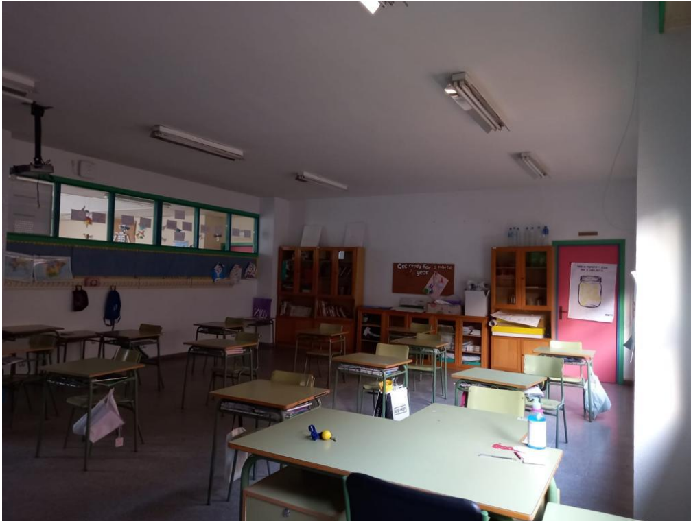
Anexo I. Aula donde se implementará la sesión