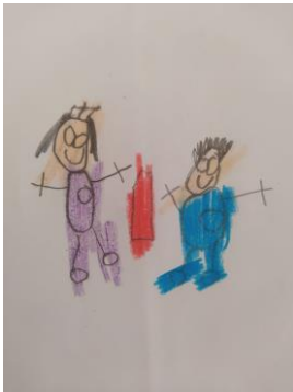
Figura 2: producción artística alumno 2.