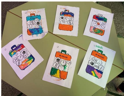
Imagen 5. Nuestro maletín de primeros auxilios

En esta sesión pudimos ver como los niños no ven problema a las discapacidades que pueden sufrir las personas, es más, se solidarizan y se muestran empáticos, ofreciéndoles su ayuda al que lo necesita, como se pudo ver en la práctica tras acabar el cuento, les pedimos a los niños que se pusieran en la piel del soldadito de plomo y tras ello vieron la diferencia entre una persona que puede andar sobre dos pies y una que solo puede andar con un pie. También se pusieron en la piel de una persona invidente contando con la ayuda de una persona que sí que puede ver. Tras el ejercicio pudimos ser conscientes de la importancia que supone para los niños el poder llevar a cabo actividades vivenciales en las que pueden comprender más a fondo el contenido en sí y que perduraran a lo largo de su vida.