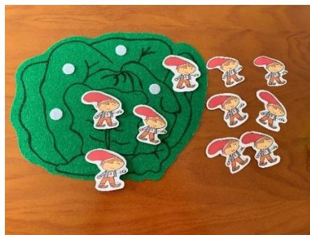
Imagen 6. La col de Garbancito

Esta sesión les sorprendió mucho el protagonista del cuento “Garbancito” por ser tan pequeño, pero al ir conociendo su historia y la canción de Garbancito se iban sintiendo muy cómodos y cercanos con él. Cuando les propusimos trabajar los números con Garbancito (véase imagen 6) les parecía imposible, pero cuando vieron el material todos querían salir a realizar la actividad, he de decir que les gusto mucho la actividad hasta el punto de no querer poner fin a esta.