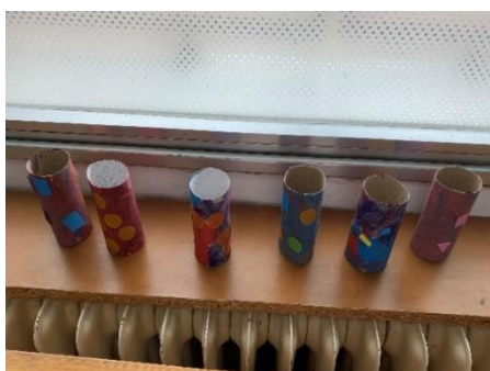
Imagen 10. Nos volvemos piratas

Pero lo que más nos sorprendió fue como los niños valoraron el poder crear su propio catalejo (véase imagen 10) con un simple rollo de cartón, puesto que en la actualidad los niños están sumergidos en los juegos de las nuevas tecnologías y en juguetes ya creados. Es muy gratificante ver como los niños prefieren juguetes simples con los que pueden ocupar un rol a juguetes que tienen una única función y que no permiten desarrollar su creatividad e imaginación.