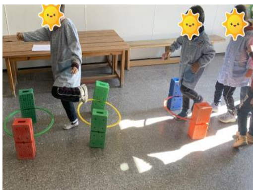
Imagen 9. La isla de Nunca Jamás

Esta sesión también tuvo diferentes factores que nos gustaría destacar, en primer lugar, como la literatura cautiva a los niños y les hace partícipes de una aventura en primera persona. La importancia que tiene el juego a estas edades tanto en el ámbito escolar como en el ámbito personal ya que forma parte del niño, como se pudo evidenciar en la actividad “La isla de Nunca Jamás” (véase imagen 9) en la que los niños pasaban a ser los niños perdidos (un aspecto que les gustó mucho), y tenían que superar los diferentes obstáculos que el capitán Garfío con la ayuda de su tripulación habían dispersado por el mar. Se mostraron muy contentos según iban realizando la actividad, también tuvieron la oportunidad de ponerse en la piel de cocodrilo Tic Tac.