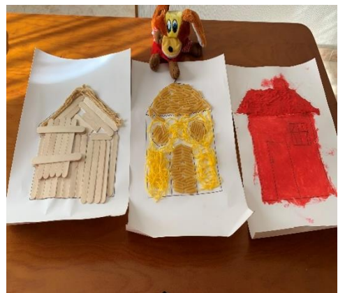
Imagen 4. Las casitas de los tres cerditos

En esta sesión nos sorprendió mucho como los alumnos se mostraron muy interesados en hacer las casitas de los tres cerditos (véase imagen 4), ya que todos querían participar en la creación de estas. También se realizó un consenso para elegir la casita que querían realizar cada uno de ellos y teniendo en cuenta sus preferencias se formaron tres grupos. Todos los grupos colaboraron y participaron en la creación de sus casitas-