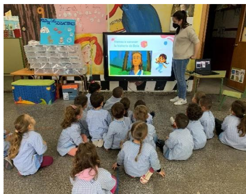
Imagen 1. Kala

De este modo, la primera sesión tuvo varios factores positivos: primeramente, les sorprendió mucho la entrada de un personaje avatar “Kala” (véase imagen 1) en el aula, ya que podían mantener un dialogo con ella y a su vez esta les iba dejando diferentes cuentos y actividades en diferentes momentos. Así pues, se divertieron, participaron todos en las actividades, hubo un buen clima de aula y se cumplieron los objetivos