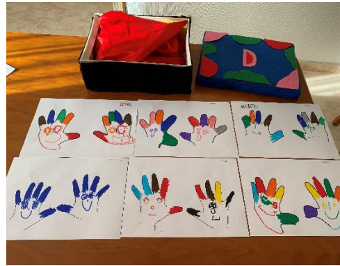
Imagen 3. Los abuelos

A partir del cuento de “Caperucita Roja” los niños pudieron ver lo importantes que son sus abuelos en su vida, a partir del cuento pudieron dialogar sobre sus abuelos el valor que tenían en su día a día, ya que son una parte muy importante para ellos. Cuando les sugerimos la idea de utilizar sus manos (véase imagen 3) para dibujar a sus abuelos se mostraron sorprendidos y muy interesados en dibujarles, como se pudo comprobar al final de la actividad, ya que los niños se habían esforzado mucho y habían puesto mucho empeño en dibujar muy bien a sus abuelos.