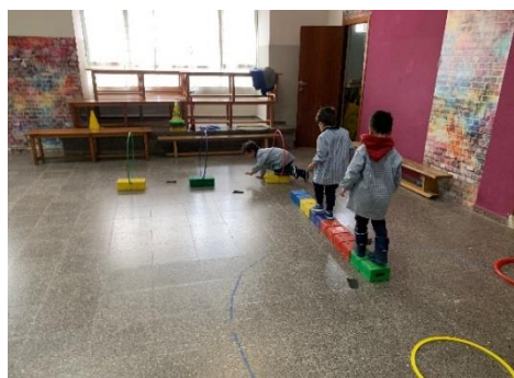
Imagen 2. En la piel de Hansel y Gretel

En la tercera sesión se pudo ver la importancia que tiene la familia en los alumnos, ya que se mostraban muy orgullosos por la familia que tenían, el gran significado que tiene para ellos ser una parte fundamental de su familia donde reciben amor, cariño, consuelo... Tras efectuar la lectura del cuento de “Hansel y Gretel” tuvieron la