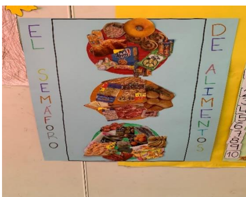
Imagen 7. Semáforo de los alimentos

Para adentrarles en el tema de la importancia de la alimentación llevamos a cabo diferentes bailes muy dinámicos para ellos y que tenían la posibilidad de dramatizar que les permitieron ir interiorizando diferentes alimentos. Las actividades del “semáforo de los alimentos” (véase imagen 7) y “cada alimento a su puesto” (véase imagen 8) fueron muy bien recibidas por los alumnos, en todo momento la participación de los alumnos fue muy buena, se pudo apreciar como los materiales que se emplearon para las diferentes actividades resultaban atractivos a los niños y captaban toda su atención. Cuando llevamos a cabo la asamblea final surgieron muchas preguntas relacionadas con la alimentación, sobre todo nos llamó mucho la atención una pregunta que hizo una alumna, pues esta dijo: ¿si en los mercados hay comida porque hay niños que no pueden comer? , el resto de la asamblea nos centramos en esta pregunta y en las diferentes ideas que iban surgiendo con relación a esta.