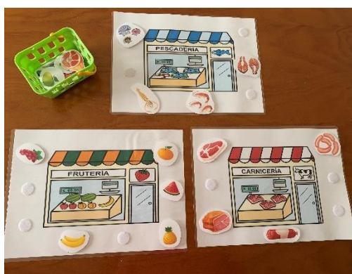
Imagen 8. Cada alimento a su puesto