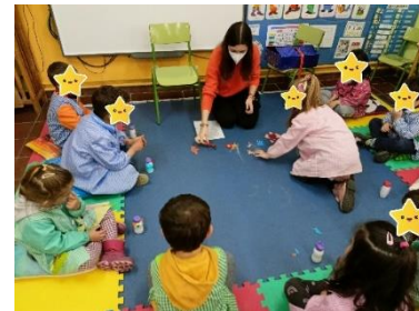
Ilustración 3. El bosque encantado

En cambio, en la siguiente sesión en la segunda actividad, es decir, en la de “El bosque encantado”. Me llamó bastante la atención de que un niño cuando les tocaba a alguno de sus compañeros les avisaba rápidamente, aunque ellos fueran conscientes de ello, pero cuando le tocaba a él estaba completamente distraído y no sabía que le tocaba agitar su cotidiáfono, es decir, la maraca.