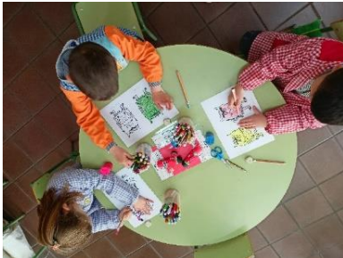
Ilustración 2. Descubre las emociones

La siguiente sesión que se llevó a cabo ayudó a los niños a conocer e identificar las emociones. Señalar que en la actividad “Descubre las emociones” a la hora de pintar ellos mismos dos emociones, una niña comenzó a llorar una vez que vio las emociones que la habían tocado. Me dirigí a ella para saber que la ocurría y, me comentó que no la gustaba la emoción del miedo y no