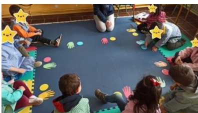
Ilustración 4. Sigue mi ritmo y verás que divertido

En la séptima sesión, en la actividad “Sigue mi ritmo y verás que divertido” tuve que realizar una pequeña modificación en el momento, puesto que cuando lo llevé a cabo según lo tenía programado, a los niños les resultaba demasiado difícil, porque tenían que fijarse en las manos y