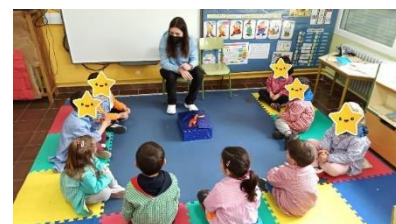
Ilustración 1. Caja sorpresa

Con respecto a las dos primeras actividades, estas fueron como una pequeña toma de contacto con los niños, donde a través de la caja sorpresa los niños lograron descubrir la actividad que les habían dejado en el aula para ellos, sintiendo curiosidad por ello y ganas de realizarlo.