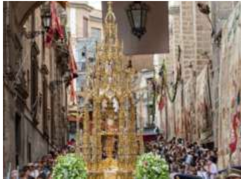
Fig. 1. Custodia del Corpus Christi de Toledo (2022)

mediante toldos, faroles y guirnaldas- y olfativo con hierbas aromáticas en el suelo.