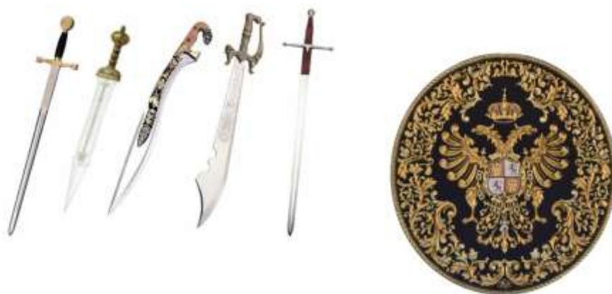
Figs. 2 y 3. Artesanías típica de Toledo.