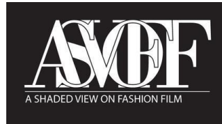
Figura 1. Logotipo del Festival de cine de moda “A Shaded view on Fashion Film”