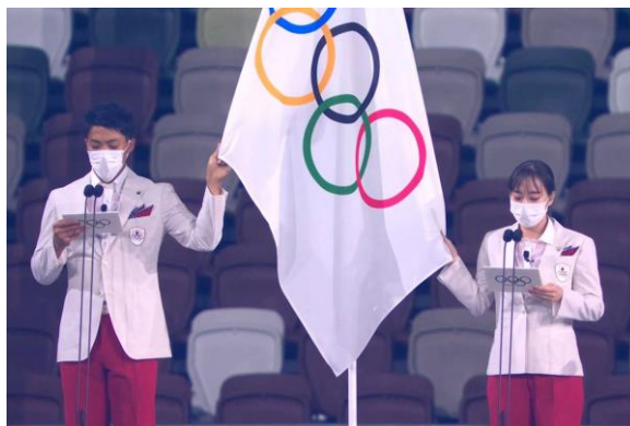
Ilustración 2.7 Juramento Olímpico Tokio 2020.