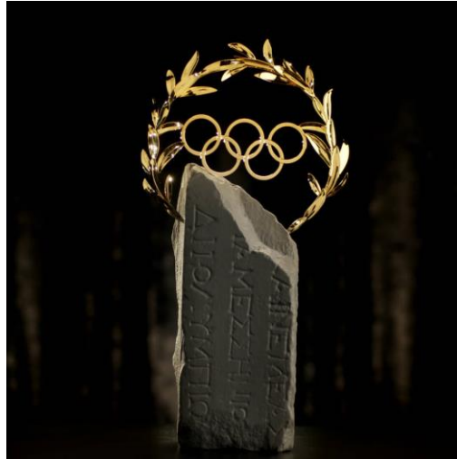
Ilustración 2.6 Laurel Olímpico.