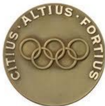
Ilustración 2.8 Lema Olímpico.

en el Congreso Olímpico el mismo día que se creó el Comité Olímpico Internacional, por lo tanto, es el símbolo más antiguo de los Juegos modernos.