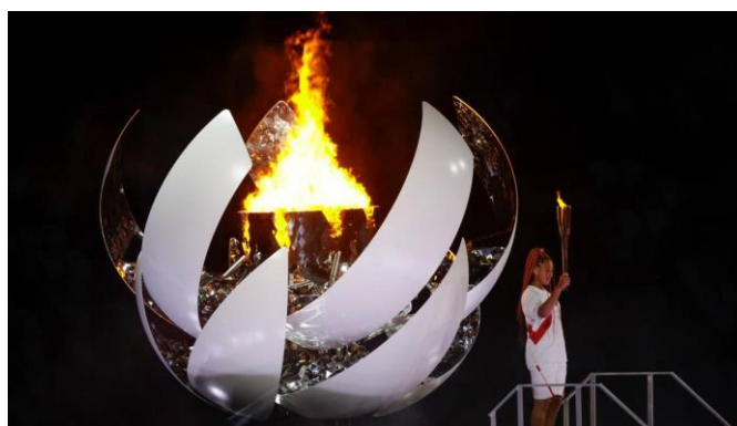
Ilustración 2.1 Llama Olímpica Tokio 2020.