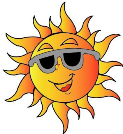
Ilustración 4.11: Mascota Juegos Olímpicos Madrid 2036.