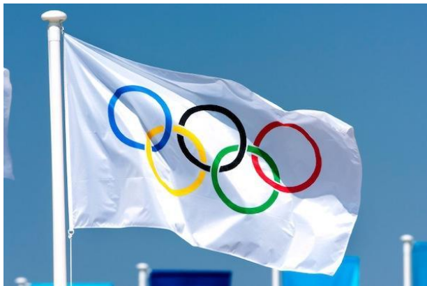
Ilustración 2.5 Bandera de los Juegos Olímpicos.