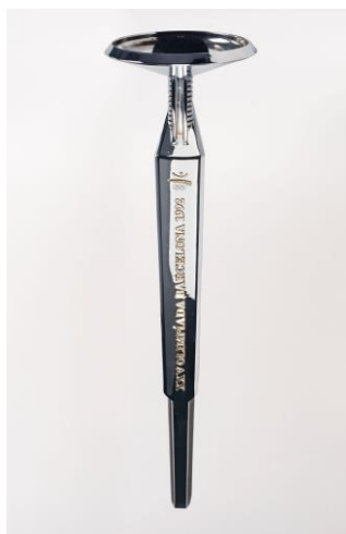
Ilustración 2.2 Antorcha Olímpica Barcelona 1992.