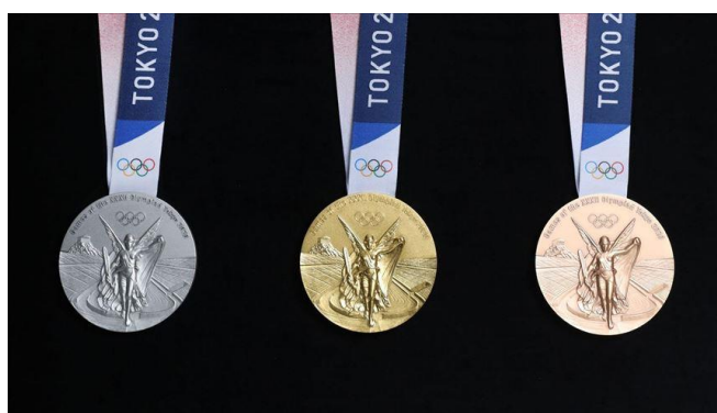
Ilustración 2.3 Medallas Olímpicas Tokio 2020.