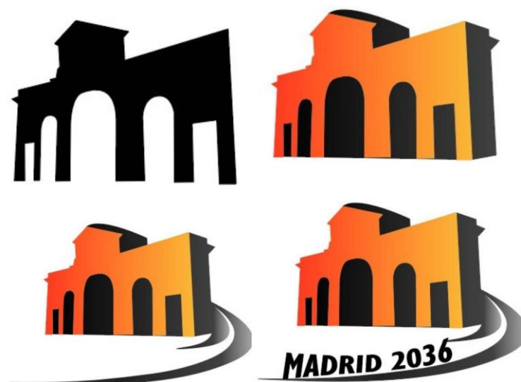
Ilustración 4.9. Proceso de creación del logo de los Juegos Olímpicos 2016.

identificativos de España. Y se usará el color negro para darle perspectiva al símbolo.