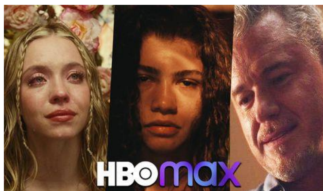
Ilustración 1.

Narrada en primera persona por Rue Bennett (Zendaya), el personaje protagonista, una joven de 17 años adicta a las drogas, diagnosticada con múltiples afecciones mentales, como la bipolaridad, TDAH y TOC y que, tras pasar por un centro de desintoxicación, no tiene ninguna intención de dejarlo. Pronto, su vida dará un giro de 180 grados al conocer a Jules (Hunter Schafer), una joven transexual nueva en la ciudad, con la que nace más que una amistad.