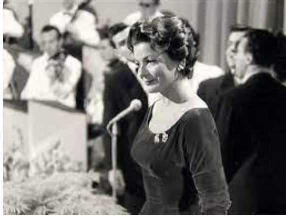
Figura 2.1: La representante de Suiza, Lys Assia, en 1956.

Fuente extraída de: https://eurovision-spain.com/aparece-un-video-completo-de-la-actuacion-de-la-victoria-de-lys-assia-en-1956/