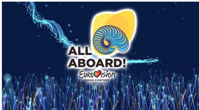
Figura 3.7. El isotipo junto con el eslogan de Eurovisión 2018.

3.1.8. La edición de 2018 , durante los días 8, 10 y 12 de mayo, se celebró en la capital portuguesa de Lisboa, esta victoria fue más que indiscutible gracias a la canción interpretada por Salvador Sobral “Amar Pelos Dois”; el cual hoy en día sigue teniendo el récord de máxima puntuación en la final de Eurovisión. Para esta edición se decidió el eslogan de “All Aboard” - “Todos a bordo”; que daba a entender que cualquier país está invitado al evento, queriendo inspirar en temas como la diversidad, el respeto y la tolerancia de los participantes, la frase iba acompañada de la imagen de una concha de mar. Rusia regresó y de nuevo se igualó el récord de 43 participantes. Para ya el famoso vídeo introductorio llamado “postcard” o postal, fue el propio país quien se encargó de su realización y con ello el turismo portugués mostraba a los artistas participantes en diversas localizaciones de Portugal. La victoria se la llevó la cantante israelí Netta, aunque lo tuvo complicado, ya que tenía a rivales tan fuertes como la chipriota Eleni Foureira. En datos de audiencia se recuperan y consiguen llegar a 186 millones de espectadores, una pequeña subida respecto a 2017.