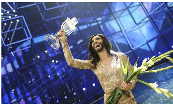
Figura 3.5. Ganadora de Eurovisión 2014; Conchita Wurst

El premio se lo acabó llevando la representante de Austria, Conchita Wurst, de forma inesperada para los datos que marcaban las apuestas.