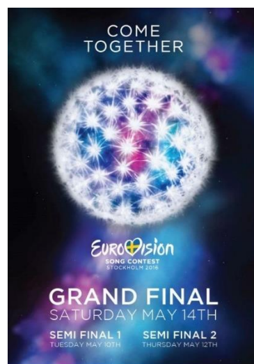
Figura 3.6. El isotipo de Eurovisión 2016 junto con el eslogan.

La UER desveló nuevamente una cifra de récord de audiencia, llegando así a 204 millones de espectadores, cinco más que el año anterior.