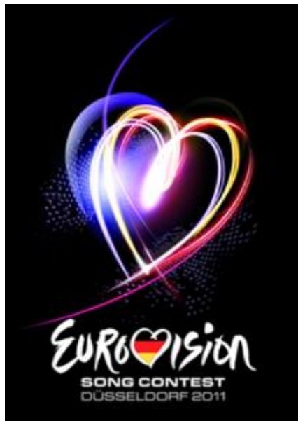
Figura 3.3. El isotipo que se creó para la edición de 2011.

“Fue un éxito de audiencia con 115 millones de espectadores y 800.000 a través de internet.” (“Eurovisión Düsseldorf 2011”, 2011)