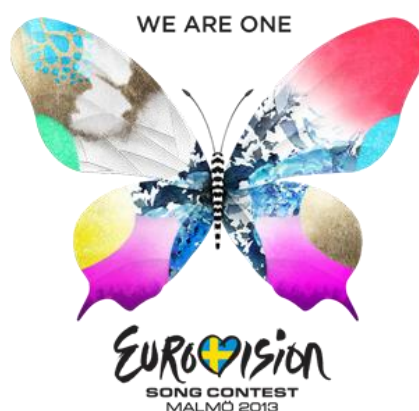
Figura 3.4. El isotipo junto con el eslogan de la edición 2013.

Al finalizar las actuaciones se conoció a la ganadora mediante los votos del jurado profesional y del voto, dando así la noticia de que el festival del año que viene se celebraría en Dinamarca, en beneficio a la cantante Emmelie de Forest.