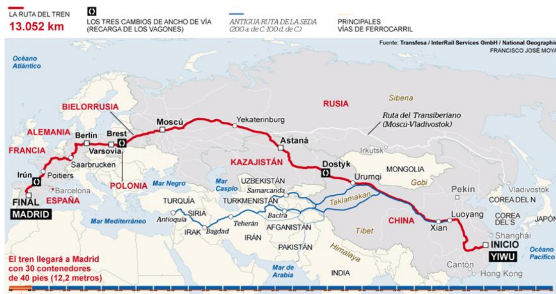
Mapa 2: La construcción de ferrocarriles en la iniciativa de la Franja y la Ruta