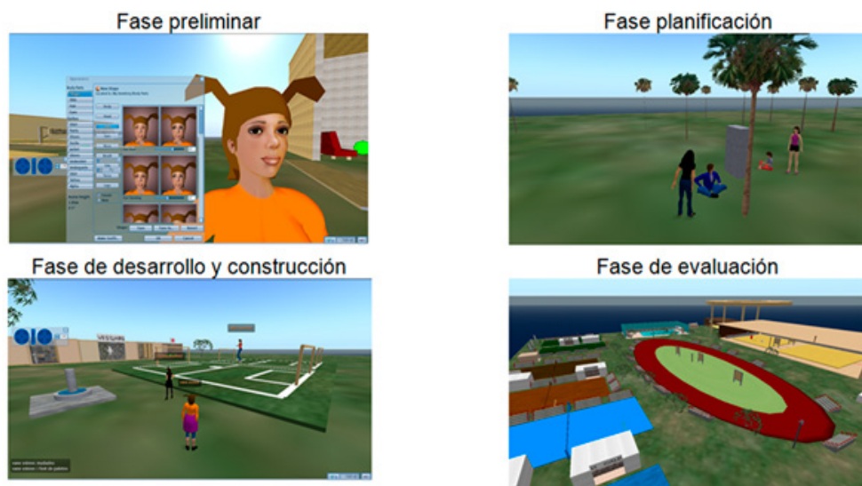
Figura 2. Trabajo colaborativo de los participantes en las distintas fases de la actividad formativa

Los participantes en las distintas fases desarrollaron algunas acciones en busca de alcanzar las metas planteadas en la actividad pedagógica (figura 2).