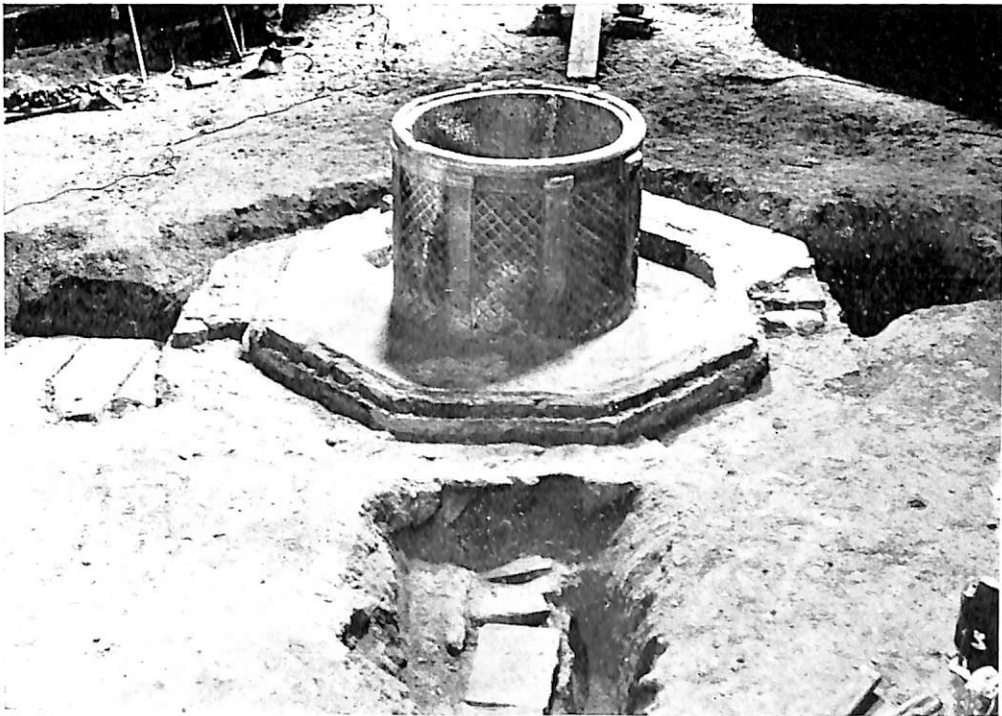
NOVARA.—Baptisterio. Piscina baptismal.