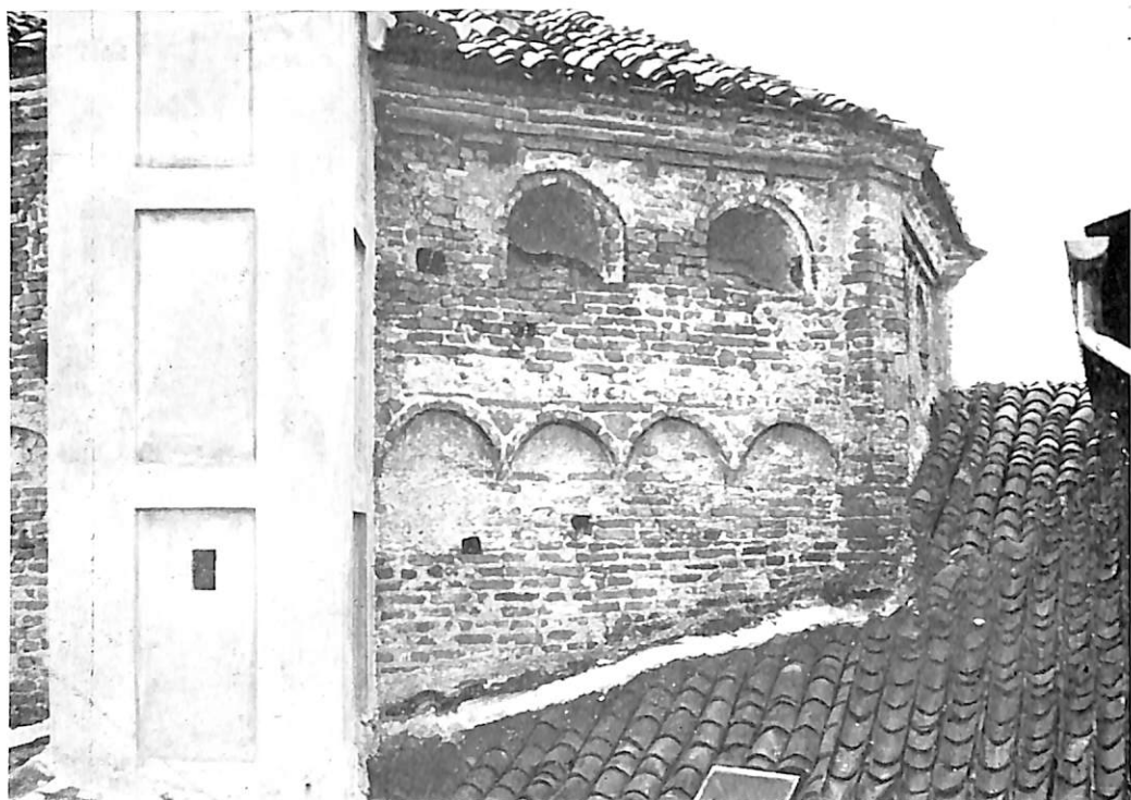
NOVARA.—Baptisterio. Exterior del cimborio antes de la restauración.