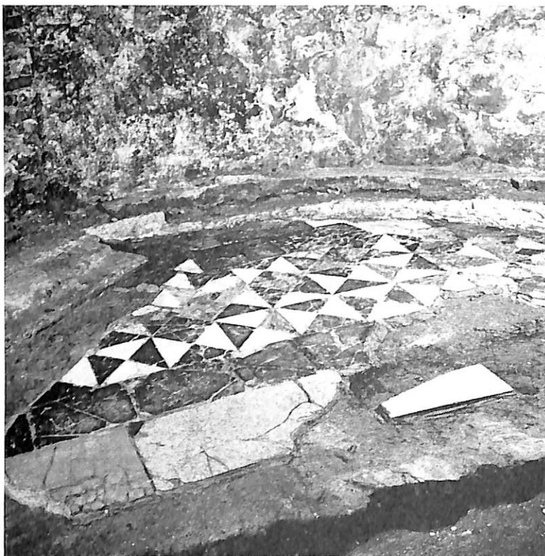
NOVARA.—Baptisterio. Pavimento de mármol.