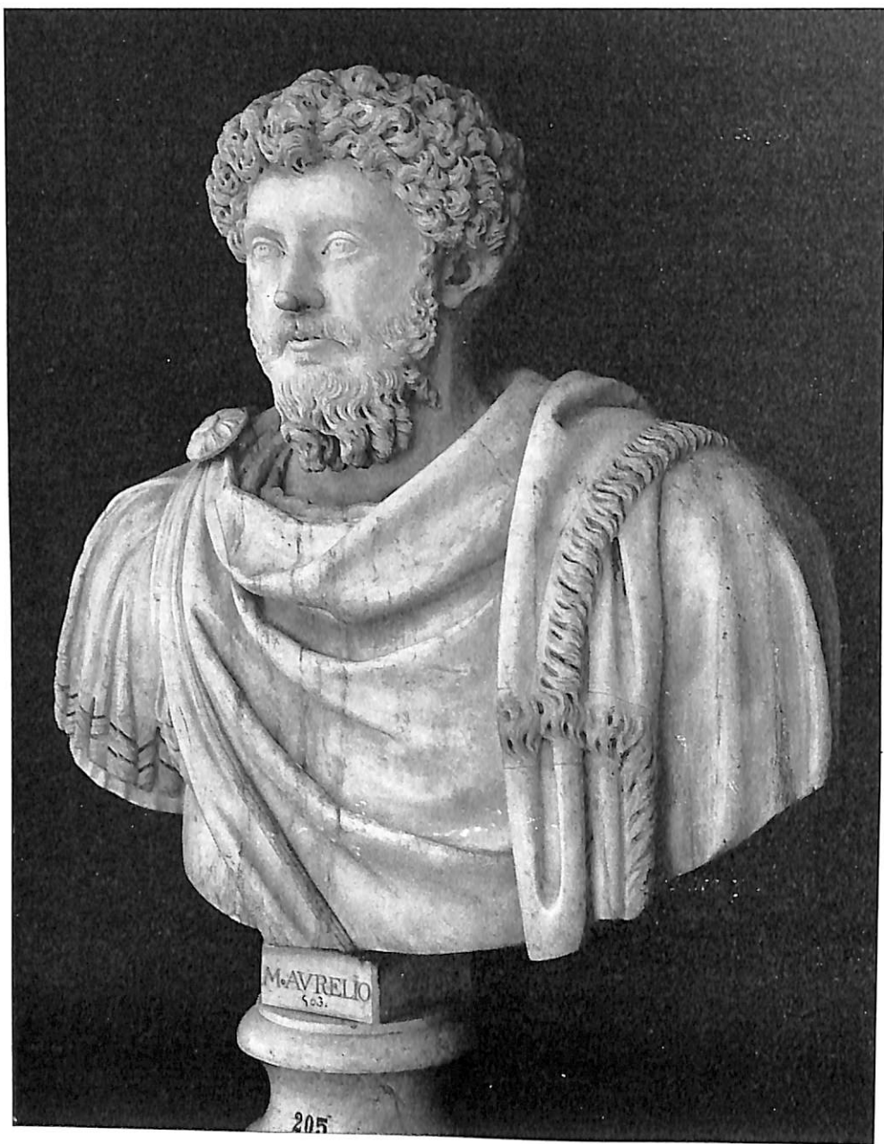
Madrid. Museo del Prado. Busto de Marco Aurelio (¿por los Bonanome?).