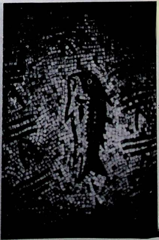
1. «La Cigarrosa». Mosaico número 1 (de una acuarela conservada en el Museo Arqueológico de Orense). 2 y 3. «La Cigarrosa». Mosaico número 2.