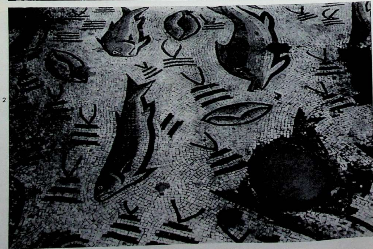
1 y 2. «La Cigarrosa». Mosaico número 2. Conjunto y detalle.