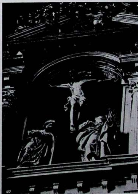
a, Valladolid. Convento de Santa Isabel. Retablo mayor. Detalle. b, Segovia. Catedral. Capilla de San Andrés. Retablo mayor. Calvario.