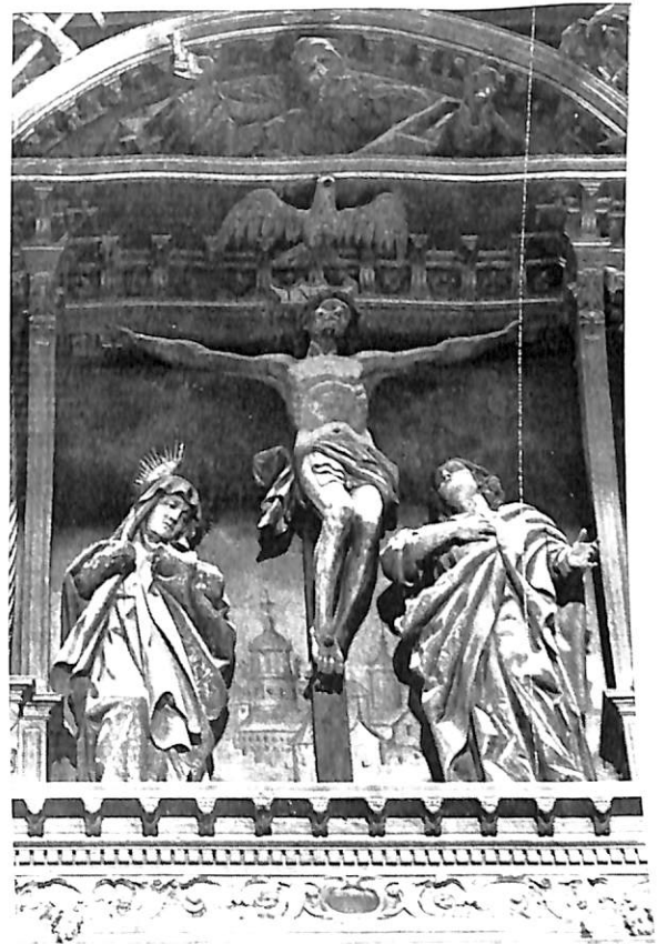
Tagarabuena (Zamora). Iglesia parroquial. Retablo mayor