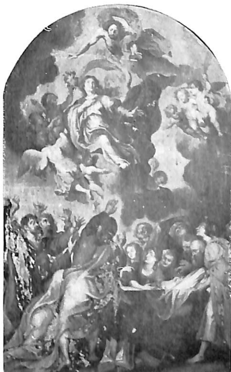
Arnedo. Iglesia de Santa Eulalia: 1. La Adoración de los Reyes.—2. La Venida del Espíritu Santo.— 3. La Crucifixión.—4. La Ascensión de la Virgen, por Gabriel Franck.