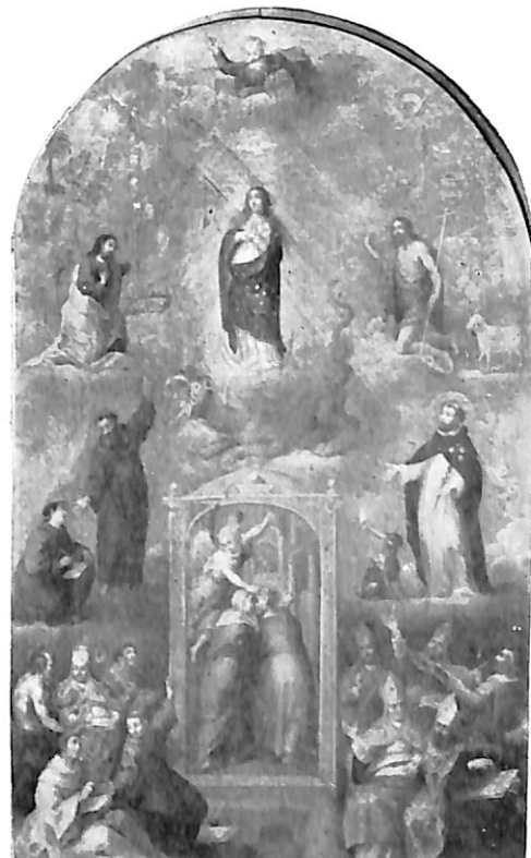
Arnedo. Iglesia de Santa Eulalia: 1. El nacimiento de la Virgen.—2. La Anunciación.—3. La Adoración de los pastores.—4. Alegoría de la Inmaculada, por Gabriel Franck.