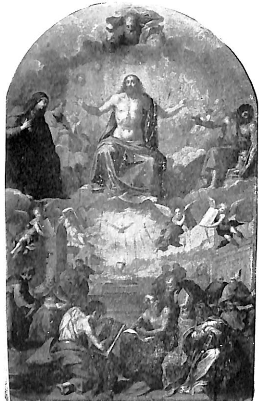
Arnedo. Iglesia de Santa Eulalia: 1. La resurrección de Lázaro.—2. La Resurrección de Cristo.— 3. Milagro de San Pedro.—4. Apoteosis de la Eucaristía, por Gabriel Franck.