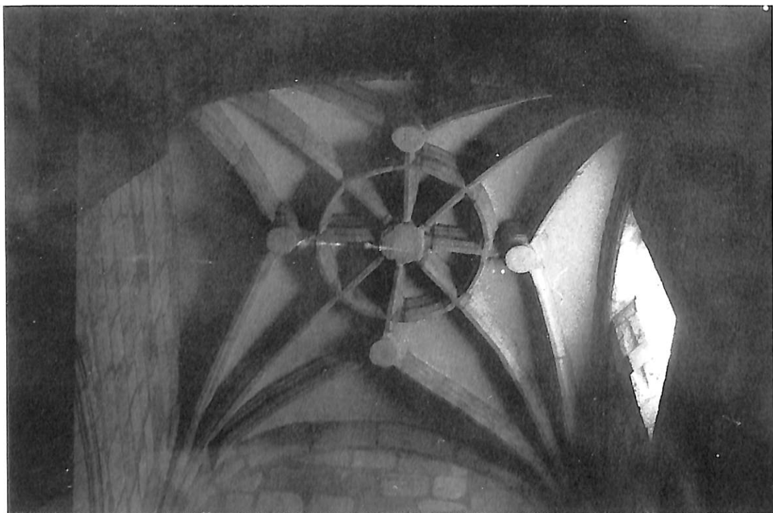
Zamora. Iglesia de San Juan de la Puerta Nueva. 1. Bóveda de capilla principal y torre.—2. Bóveda de la capilla de la Epístola.