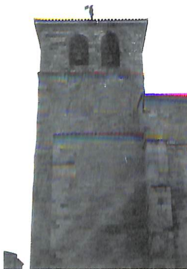
Zamora. Iglesia de San Juan de la Puerta Nueva.