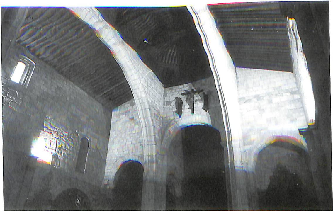
Zamora. Iglesia de San Juan de la Puerta Nueva. 1. Planta (según R. de Castro).—2. Interior del templo.