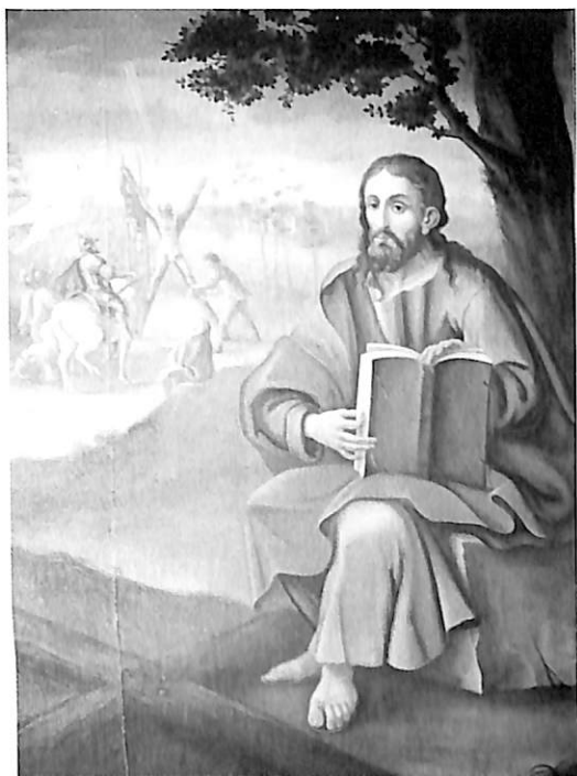
Carrión. Ayuntamiento. 1. San Pedro, por Canedo. 2. San Pablo, por Canedo. 3. San Andrés, por Canedo.