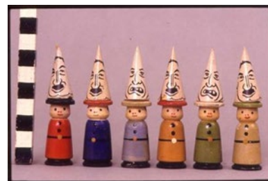
Ilustración 15. En el juego de mesa Sakampf, de sello antisemita, el objetivo era destruir la democracia alemana. https://www.bbc.com/mundo/noticias-48076622