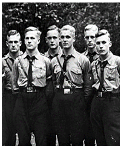
Ilustración 21. Miembros de las Juventudes Hitlerianas fotografiados en 1933. https://es.wikipedia.org/wiki/Juventudes_Hitlerianas