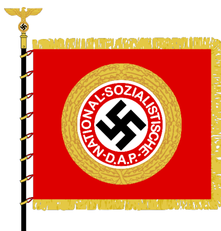
Ilustración 1. NSDAP Alte Garde

El partido se rige por el Führerprinzip y ofrece una estructura administrativa supuesta a la organización estatal que acentúa la centralización. Los miembros de la sociedad alemana, uno tras otro, estaban encuadrados en organizaciones profesionales o de cualquier otra naturaleza ya que era prácticamente obligatoria la pertenencia: Hitlerjugend (Juventudes Hitlerianas), NS Frauenschaft (Organización Femenina del Partido), NS Studentenbund (Asociación Estudiantil), NS Deutscher Arztebund (Asociación de Médicos), NS Rechtswahrerbund (Asociación de Abogados), NS Lehrerbund (Asociación de Maestros), Reichbund der Deutschen Beamten (Asociación de Funcionarios), NS Bund Deutscher Technik (Asociación de Ingenieros), NS Reichbund für Sport und Liebesübungen (Asociación del Deporte y Cultura Física).