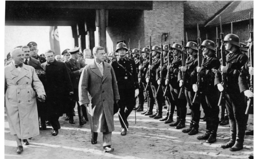
Ilustración 13: Edward duque de Windsor en una visita al Ordensburg Krössinsee 1937

buena salud sin limitaciones físicas. En la segunda guerra mundial un porcentaje de Junkers murieron en acción Se llevaron a cabo dos cursos de estudios. Las mañanas se dedicaban al estudio de filosofía. Política e historia mundial. Las tardes hacían ejercicios militares, tácticas de batalla, deportes y técnicas ecuestres. También desarrollaban habilidades de remo y navegación.