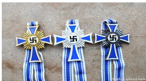
Ilustración 6. Cruz de honor de la madre alemana oro, plata y bronce.

(Louis R. Franck, "Economic and Social Diagnosis of National Socialism", en la antología The Third Reich , Londres, 1955, p. 243)