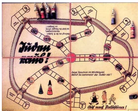
Ilustración 14. “Juden Raus”: un juego de mesa para los niños nazis

https://blogs.20minutos.es/becario/2009/03/22/juden-raus-juego-mesa-los-niaaos-nazis/