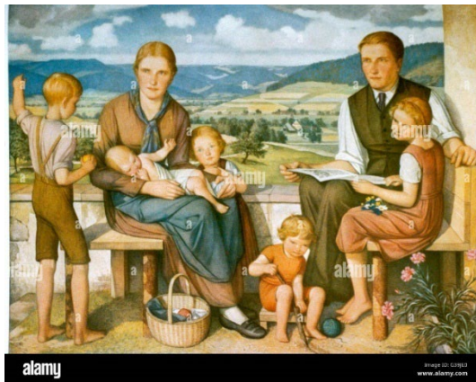
Ilustración 7. Familia aria alemana.