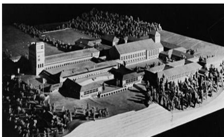
Ilustración 12. Maqueta de Ordensburgen Sonthofen