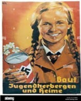
Ilustración 19. Chica pidiendo un donativo. https://www.jotdown.es/2012/08/la-vida-cotidiana-en-la-alemania-nazi-y-iii/