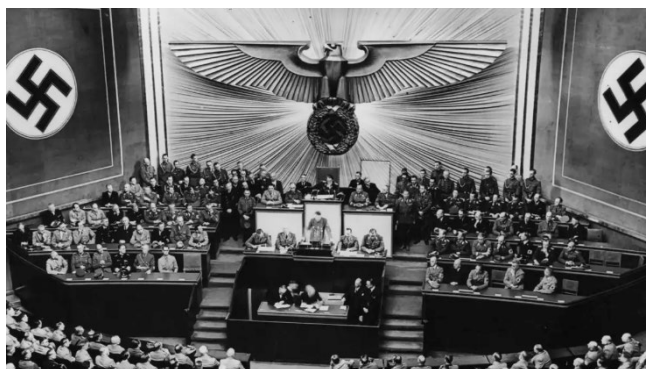
Ilustración 5. La revisión del Tratado de Versalles y la reapertura del conflicto en Europa. https://eliotfern.com/revision-tratado-versalles/

En los primeros años de contienda, la táctica de la guerra relámpago (Blitzkrieg) proporciona éxitos espectaculares en Polonia, Noruega, Dinamarca, Holanda, Bélgica, Francia y Yugoslavia, Grecia... En un plazo relativamente breve, el imperio alemán se extiende desde el Atlántico hasta las puertas de Moscú. La Europa continental de 1942 es una mezcla de territorios anexionados al Gran Reich, zonas bajo administración militar o civil, gobiernos bajo tutela nazi y países satélites. Para afrontar los esfuerzos de la guerra Alemania, recurre, en ocasiones, a métodos de “coacción voluntaria” como la supeditación de la producción y del comercio a los intereses alemanes, la firma de tratados comerciales bilaterales y la recaudación de los costos de la ocupación.