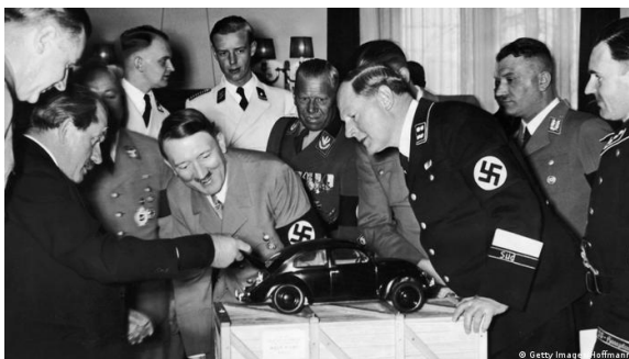
Ilustración 4. Hitler y el auto del pueblo.

Al margen de la ingeniosa imagen de Brecht, la contribución más destacada del Frente del Trabajo a la integración de la población trabajadora corresponde a la diversificación y control ideológico del tiempo libre de los alemanes a través de “ A la fuerza por la alegría ”. Creada en noviembre de 1933, la institución trata de socializar el patrimonio artístico y cultural de Alemania. Para ello, elabora una extensa oferta de actividades recreativas, desde veladas de teatro, música y competiciones de tenis hasta excursiones dominicales y vacaciones organizadas. La favorable acogida entre los alemanes del programa recreativo se colige de las cifras manejadas por la oficina “Noche de fiestas”, sobre la asistencia a espectáculos celebrados hasta noviembre de 1938: 73.000 representaciones teatrales y 33.700.000 espectadores; 15.600 conciertos y 7.900.000 aficionados; 47.000 proyecciones cinematográficas en zonas rurales y 18.650.000 espectadores. También es la entidad encargada de canalizar en estos años los ahorros de 300.000 alemanes para la adquisición del “coche KdF” (Volkswagen).