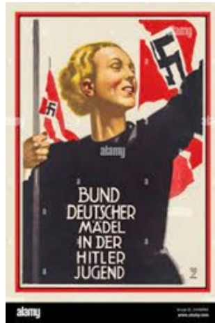
Ilustración 20. Hitler Youth Jugend 1930s Propaganda nazi 'Liga de las chicas alemanas en la juventud hitleriana'.

de semana de los Albergues de Juventud, tenía que saber hacer una cama y empaquetar equipo corriente, así como haber tomado parte en faenas de albergue. Desde los catorce años la vinculación de las chicas tendía a relajarse. Como las chicas maduran más rápidamente, no encontraban buen aliciente en la compañía de los chicos de su misma edad de las organizaciones paralelas de las Juventudes.