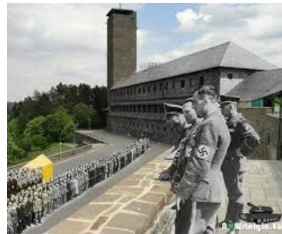
Ilustración 11. Ordensburgen Vogelsang