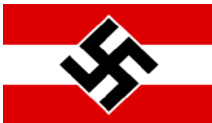
Ilustración 17: Bandera de las Juventudes Hitlerianas.

A medida que el Partido Nazi ganaba popularidad a principios de la década de 1930, quiso aumentar su influencia y alcance entre la juventud alemana, así que expandió las Juventudes Hitlerianas para incluir tanto a chicos como a chicas. Para 1931, ya contaban con cuatro secciones organizadas por sexo y edad: