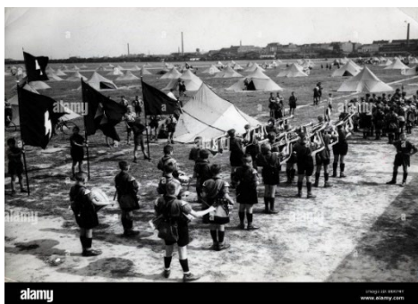
Ilustración 9. Campamento de la juventud de Hitler

Los ideales nacionalsocialistas se dan también en las actividades que se desarrollan fuera de las aulas, durante las vacaciones de Pascua los alumnos de Secundaria debían de ir de “campamento”, es un sinónimo de instrucción premilitar. “Allí se les adiestraba como si fueran soldados, acampaban en tiendas de campaña bajo la vigilancia de su tutor. Estaban instruidos por oficiales de baja graduación jubilados, hacían maniobras, desfílában y a partir de los catorce años disparaban. Los alumnos estaban entusiasmados con ello, y a los profesores les alegraba y les gustaba hacer el indio” (Ö. von Horváth, Juventud sin Dios (1937), op. cit., p. 71)