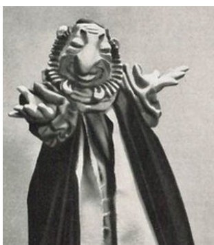
Ilustración 16. El 'fantoche judío' era utilizado en la propaganda de organizaciones partidarias nazis. https://www.bbc.com/mundo/noticias-48076622

También estaba el famoso muñeco Kasper, que representaba la imagen de un judío; fue usado en representaciones de títeres nazis e incluso para entretener a los soldados alemanes. Al final de los años 30, el Reichsinstitut für Puppenspiel (algo así como el Instituto para el Teatro de Títeres) fue creado para fabricar esos muñecos y producir giras de presentaciones de propaganda.