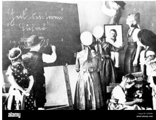
Ilustración 8. Escuela de Adolf Hitler.

El régimen hizo de la reforma de la educación un pilar básico de la política de dominación. La acomodación de recursos humanos y materiales a las necesidades del nacionalsocialismo persigue inculcar la ideología oficial en todos los niveles de enseñanza y adoctrinar al alumno desde su más temprana edad “pensar exclusivamente en alemán, sentir exclusivamente en alemán y comportarse exclusivamente en alemán” (Díez Espinosa, 2011).