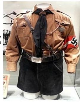
Ilustración 18 Uniforme usado entre 1934 y 1938; que consta de camisa parda, pantalón de pana negro, cinturón de cuero con cierre, correa sujeta al hombro, pañoleta y cuchillo; Museo Estatal de Arte e Historia Cultural de Oldenburg.