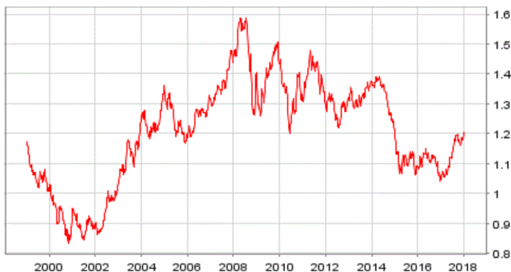
Gráfico 2: Evolución del tipo de cambio euro-dólar desde 1999

demanda interna. No obstante, en los últimos años se ha situado en un nivel más intermedio que ha restado cierta preocupación.