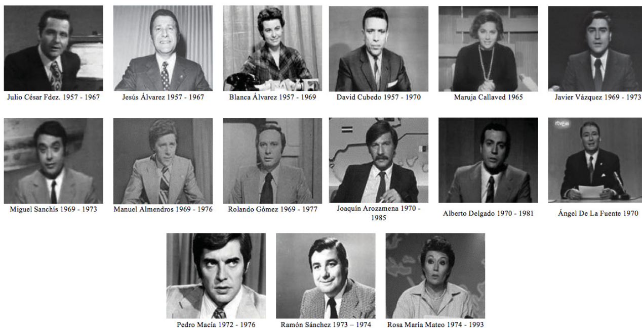
Tabla 2. Presentadores del telediario entre los años 1956-1975.

etapa de análisis elegida en esta investigación (1956-1975).