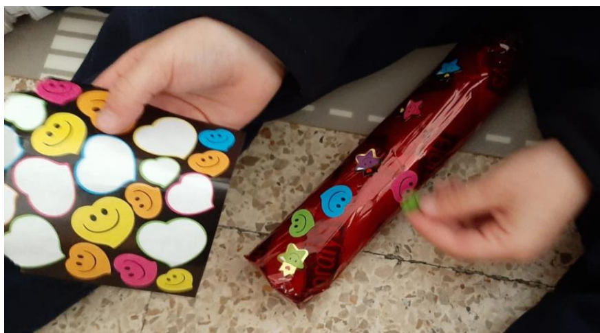
Imagen de la tercera actividad. Desarrollo de una canción (instrumental).

Nota. Se solicitó a los participantes escuchar la música, identificar la emoción y expresarla con los instrumentos previamente decorados.