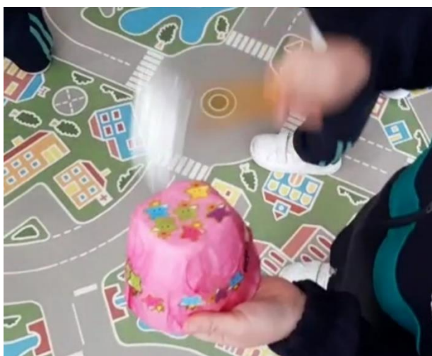
Imagen de la tercera actividad. Desarrollo de una canción (instrumental).

Nota. Se solicitó a los participantes escuchar la música, identificar la emoción y expresarla con los instrumentos previamente decorados.