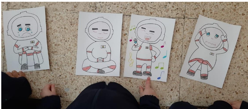
Imagen de la tercera actividad. Desarrollo de una canción (plástica)

Nota. Se solicitó a los participantes escuchar la música e identificar la emoción expresada en los dibujos para posteriormente colocarla en orden.