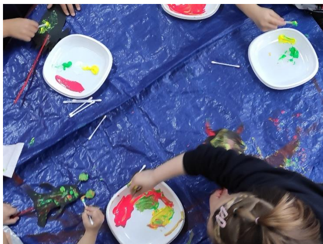
Imagen de la quinta actividad. Cuento con luz negra – Conociendo el universo

Nota. Se solicitó a los participantes decorar con pintura de neón los personajes de la historia.