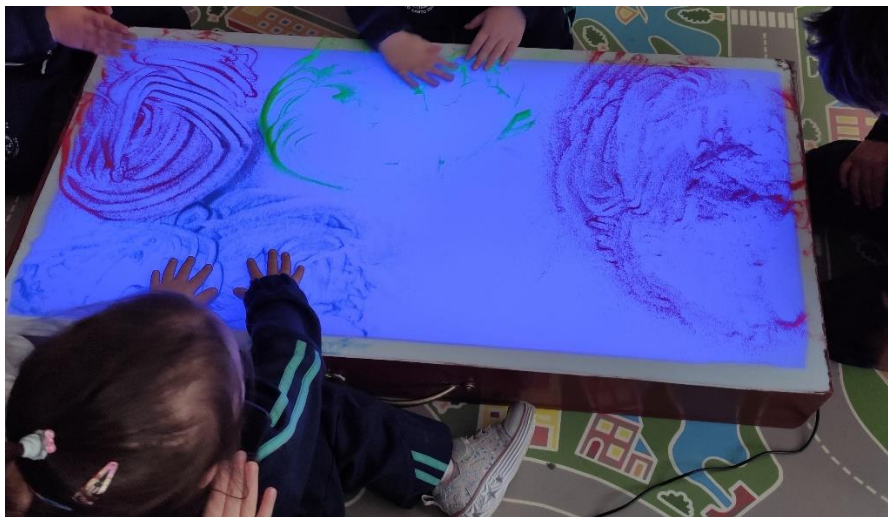
Imagen de la primera actividad. Masaje con polvo de estrellas

Nota. Se solicitó a los participantes dar un masaje a sus parejas al ritmo de la música y que estas a su vez representaran cómo se sentían en la mesa de luz.