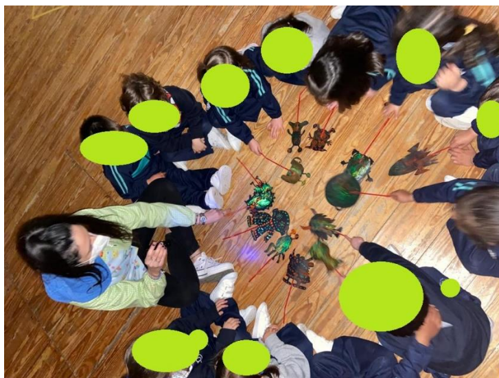
Imagen de la quinta actividad. Cuento con luz negra – Conociendo el universo

Nota. Se solicitó a los participantes escuchar la historia, al tiempo que la música e ir sacando el personaje que tocaba mientras suponían qué emoción se daba en cada momento.