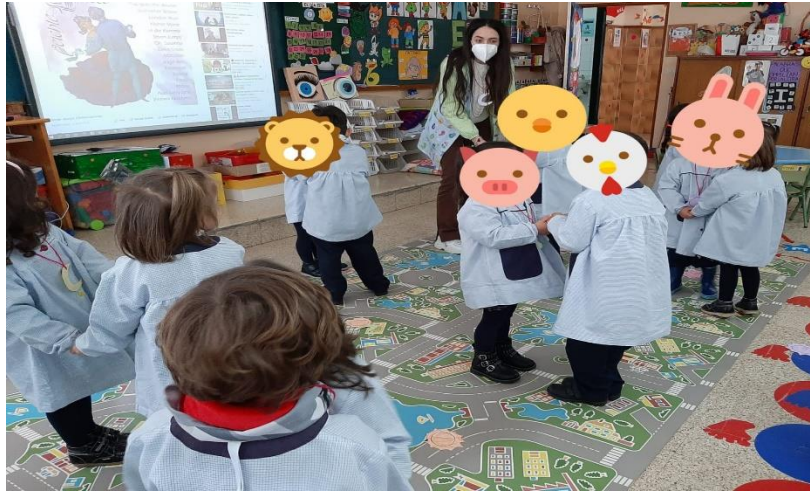
Imagen de la segunda actividad. Danza espejo – danza estelar

Nota. Se solicitó a los participantes bailar con sus parejas al ritmo de la música y en cada cambio de ritmo representar una emoción e imitarla.