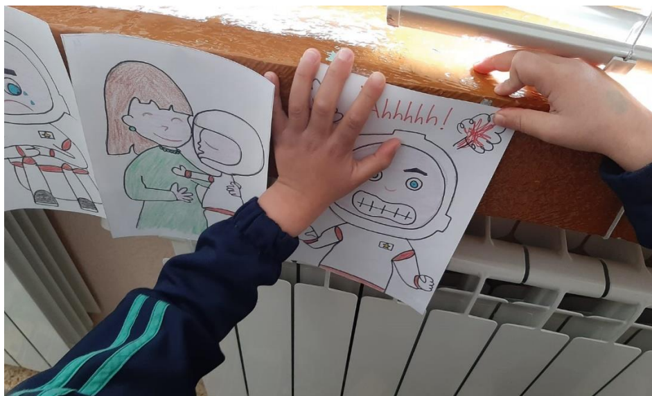
Imagen de la tercera actividad. Desarrollo de una canción (plástica)

Nota. Se solicitó a los participantes escuchar la música e identificar la emoción expresada en los dibujos para posteriormente colocarla en orden.