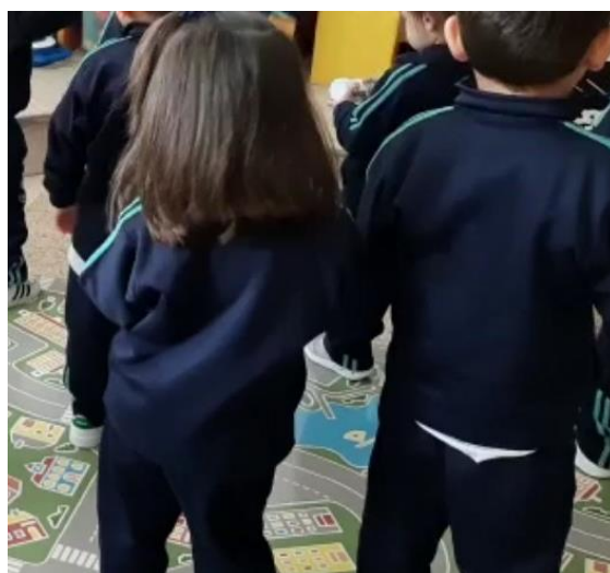
Imagen de la tercera actividad. Desarrollo de una canción (gestual).

Nota. Se solicitó a los participantes escuchar la música, identificar la emoción y expresarla con gestos.