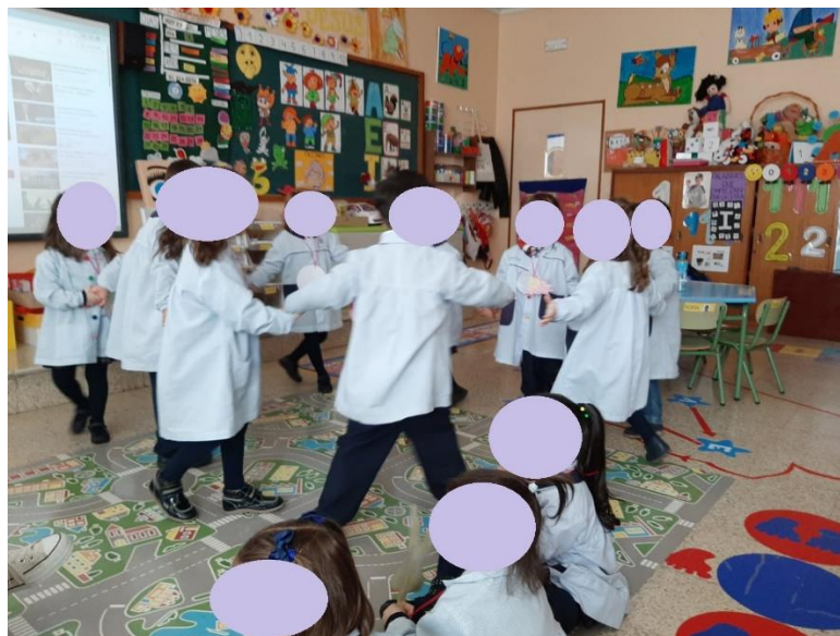
Imagen de la cuarta actividad. Dramatización – Fiesta en el Sistema Solar.

Nota. Se solicitó a los participantes escuchar la historia, identificar la emoción y representarla.