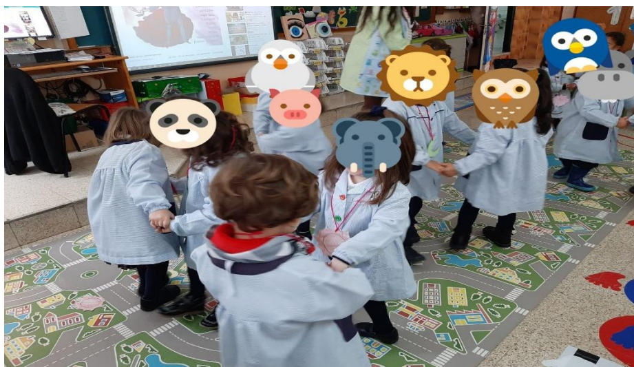
Imagen de la segunda actividad. Danza espejo – danza estelar

Nota. Se solicitó a los participantes bailar con sus parejas al ritmo de la música y en cada cambio de ritmo representar una emoción e imitarla.