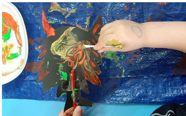
Imagen de la quinta actividad. Cuento con luz negra – Conociendo el universo

Nota. Se solicitó a los participantes decorar con pintura de neón los personajes de la historia.