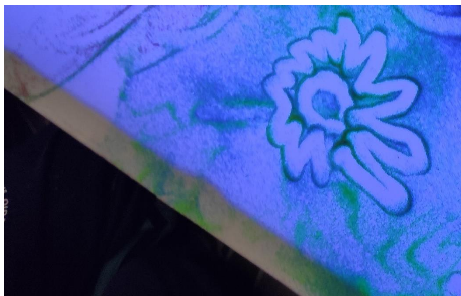
Imagen de la primera actividad. Masaje con polvo de estrellas

Nota. Se solicitó a los participantes dar un masaje a sus parejas al ritmo de la música y que estas a su vez representaran cómo se sentían en la mesa de luz siguiendo el patrón marcado.