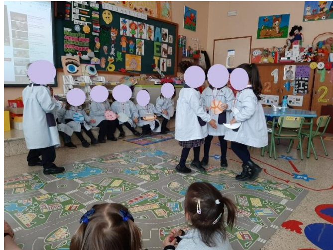
Imagen de la cuarta actividad. Dramatización – Fiesta en el Sistema Solar.

Nota. Se solicitó a los participantes escuchar la historia, identificar la emoción y representarla.