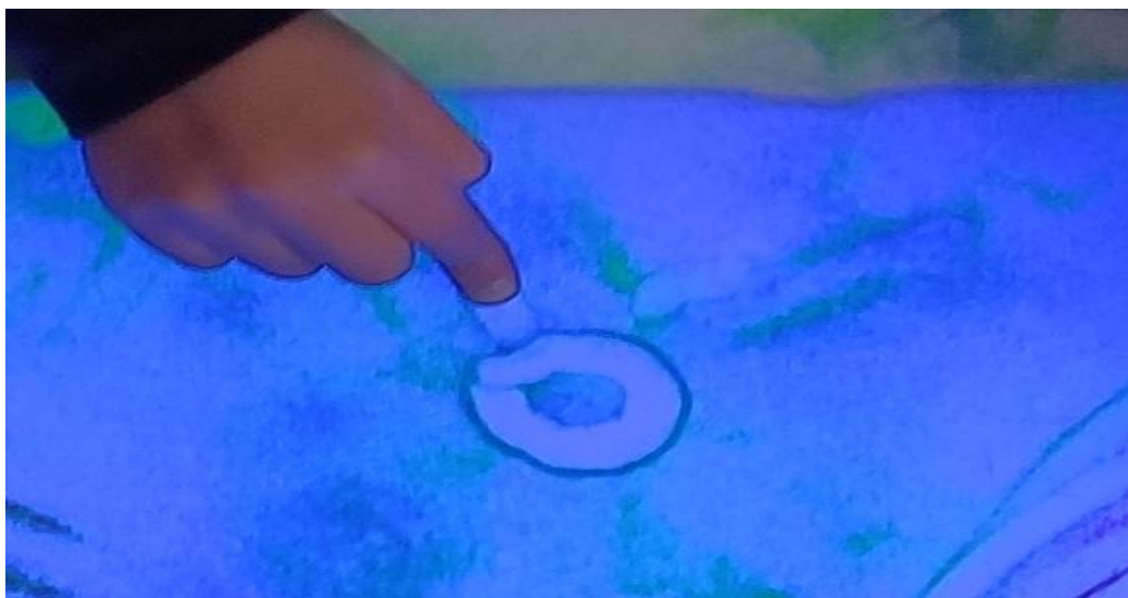
Imagen de la primera actividad. Masaje con polvo de estrellas

Nota. Se solicitó a los participantes dar un masaje a sus parejas al ritmo de la música y que estas a su vez representaran cómo se sentían en la mesa de luz siguiendo el patrón marcado.