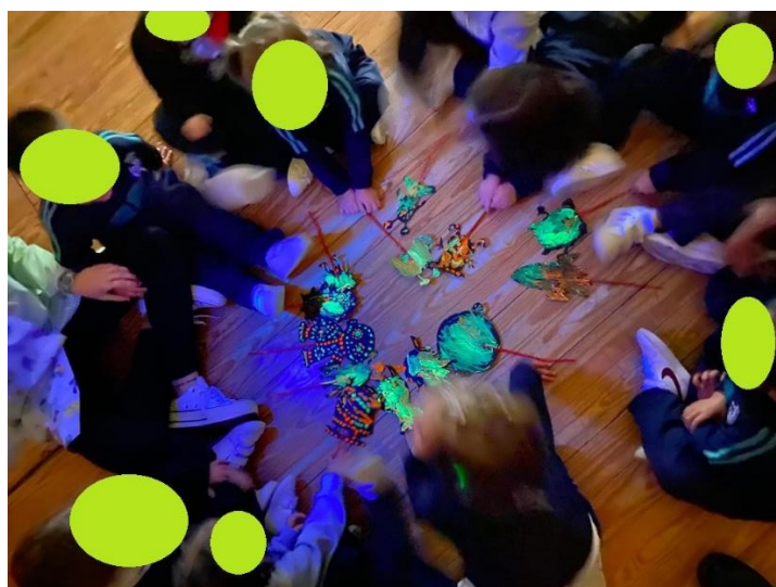
Imagen de la quinta actividad. Cuento con luz negra – Conociendo el universo

Nota. Se solicitó a los participantes escuchar la historia, al tiempo que la música e ir sacando el personaje que tocaba mientras suponían qué emoción se daba en cada momento.