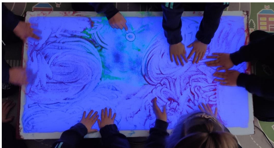
Imagen de la primera actividad. Masaje con polvo de estrellas

Nota. Se solicitó a los participantes dar un masaje a sus parejas al ritmo de la música y que estas a su vez representaran cómo se sentían en la mesa de luz siguiendo el patrón marcado.