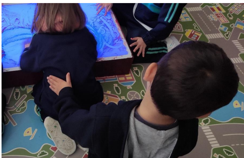
Imagen de la primera actividad. Masaje con polvo de estrellas

Nota. Se solicitó a los participantes dar un masaje a sus parejas al ritmo de la música y que estas a su vez representaran cómo se sentían en la mesa de luz siguiendo el patrón marcado.