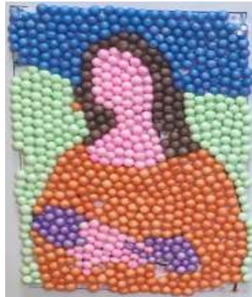
Figura 18. Foto18.