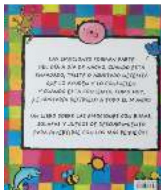
Figura 7. Foto7.

Acabado el puzle y cada equipo en su mesa nos comentó la emoción que describía el niño que aparecía en su puzle. Por equipos salieron al centro del aula y tuvieron que gestualizar la emoción que transmitía su puzle y el resto de los equipos adivinar cual era. No hubo ningún problema y todos adivinaron la emoción de todos los grupos. Posteriormente y como si estuviésemos en un museo cada grupo sin tocar fue viendo el puzle de los otros grupos y cerciorándonos de la emoción que transmitía cada puzle.