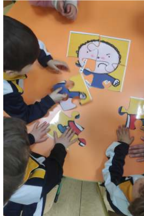
Figura 5. Foto5. Fuente: Elaboración propia (2022). Figura 6. Foto6. Fuente: Elaboración propia (2022).

Acabado el puzle y cada equipo en su mesa nos comentó la emoción que describía el niño que aparecía en su puzle. Por equipos salieron al centro del aula y tuvieron que gestualizar la emoción que transmitía su puzle y el resto de los equipos adivinar cual era. No hubo ningún problema y todos adivinaron la emoción de todos los grupos. Posteriormente y como si estuviésemos en un museo cada grupo sin tocar fue viendo el puzle de los otros grupos y cerciorándonos de la emoción que transmitía cada puzle.