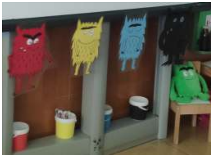
Figura 21. Foto21.

Después, realizaremos un juego, utilizando los cubos de colores que hay en el aula para diferenciar las emociones. Con sus fotografías, para ello repartiremos el depresor con su fotografía pegada en él y colocaremos en el centro del aula los cubos con los diferentes colores de las emociones. Uno a uno les iremos realizando preguntas sobre la variante o cuadro original que les gusta más y una vez seleccionado deberán reconocer la emoción que les produce y colocar su foto con el depresor en el cubo del color de la emoción que les produzca.