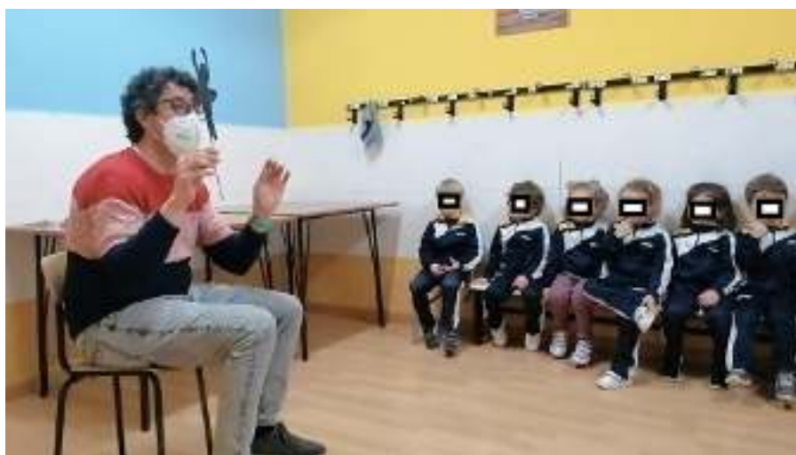
Figura 11. Foto11.