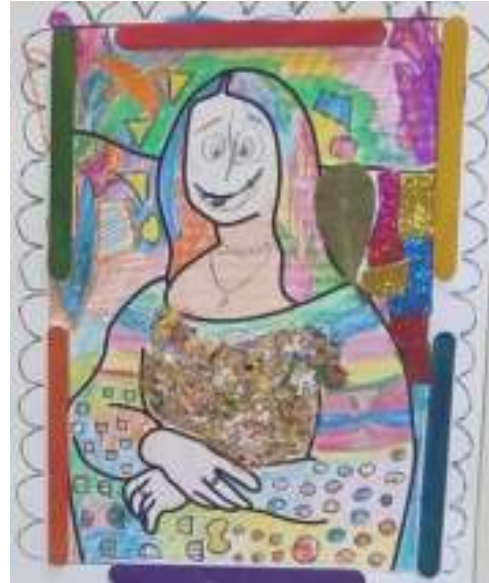
Figura 20. Foto20.