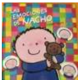
Figura 23. Foto23.

Finalizada la visita al museo del puzle a continuación nos dispondremos al alumnado todo el grupo en el lugar de encuentro sentados para la lectura de un cuento: Las emociones de Nacho de Liesbet Slegers que trata de las emociones que forman parte del día a día de Nacho. Cuando está enfadado, triste o asustado necesita que lo ayuden y lo consuele. Y cuando está contento, como hoy, ¡Le gustaría decírselo a todo el mundo! es un libro que versa Un libro sobre las emociones con rimas, solapas y juegos de descubrimiento para divertirse con los más pequeños. Durante la lectura les realizaremos preguntas sobre el cuento y lo que ocurre en él.