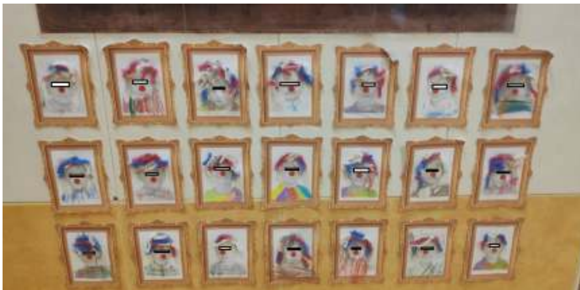
Figura 13. Foto13.

Actividad: se desarrollará aprovechando la exposición que se ha preparado en las instalaciones del centro, con obras y autorretratos de ellos mismos, inspirados en el retrato más conocido de Leonardo Da Vinci. Realizaremos la visita simulando que estamos en un museo de verdad, así de esta manera enseñamos la forma de comportarse ante una obra de arte, desde el respeto y la admiración.