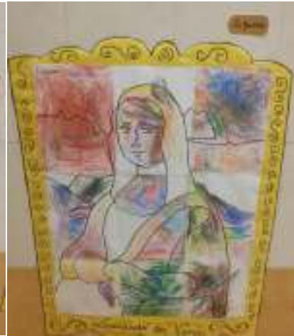
Figura 16. Foto 16.

Fuente: Elaboración propia (2022). Fuente: Elaboración propia (2022). Fuente: Elaboración propia (2022).