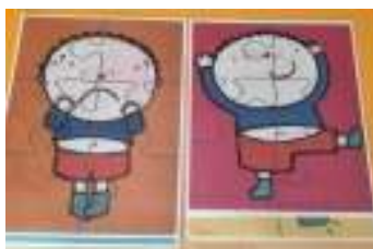
Figura 22. Foto22. Fuente: Elaboración propia (2022).

Utilizando la disposición de las mesas en el aula dividiremos al alumnado en grupos y les proporcionaremos un puzzle con un retrato de un niño. Será un puzzle sencillo de ocho piezas tamaño A3.