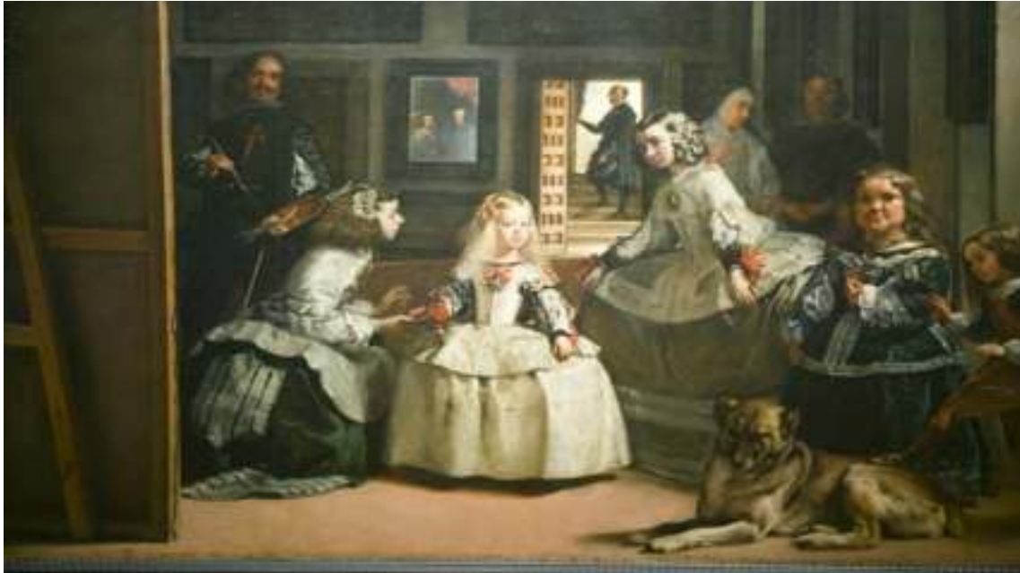
Figura 12. Foto12.

Evaluación: con la utilización con una tabla de control realizaremos una evaluación previa para que posteriormente, al final de todas las actividades volveremos a realizar la misma tabla de control. También se realizará con una tabla de control la evaluación de la primera sesión.