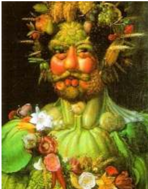
Figura 24. Foto24.

Finalizaremos la actividad con un cuento narrado, utilizando el libro de las frutas, un personaje de bailarina coloreada con pintura de neón y una linterna de rayos ultravioleta para comentar con el alumnado las frutas saludables que podemos ingerir en una alimentación correcta. Acabado el cuento comentaremos las emociones que les ha producido el cuento.