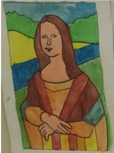
Figura 19. Foto19.