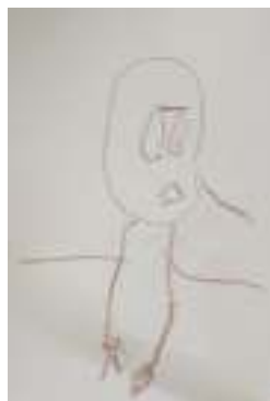
Figura 1. Foto1.

En la segunda sesión ( Anexo VII ) comenzamos con una visita a nuestro museo por el pasillo del centro, observando las obras de la Gioconda que han realizado los compañeros de otros cursos de Educación Infantil, algo complicado que evitasen tocar las obras, también había expuestos inventos y esculturas. Después del paseo por museo comentamos cómo se habían sentido y les expuse en el proyector a la Gioconda original y estuvimos comentando la emoción que nos transmitía, principalmente fue la tristeza.