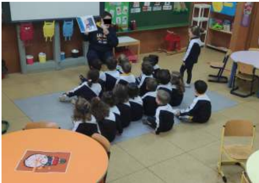
Figura 8. Foto8. Fuente: Elaboración propia (2022).

Acabada la visita de cada puzle, en el espacio de encuentro, sentados realizamos la lectura del cuento Las emociones de Nacho, comentando cada emoción que salía en el cuento y que sentía Nacho, a la vez que cada uno ponía caras para vivenciar la emoción. Para terminar la sesión proyectamos La canción de las emociones de Pequesí y el alumnado al completo estuvo saltando y bailando aflorando principalmente la emoción de la alegría, se propuso por parte de la profesora diferentes bailes y también se les propuso que crearan e inventaran su propio baile, reproduciendo varias veces la canción.