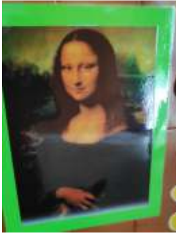
Figura 14. Foto14.