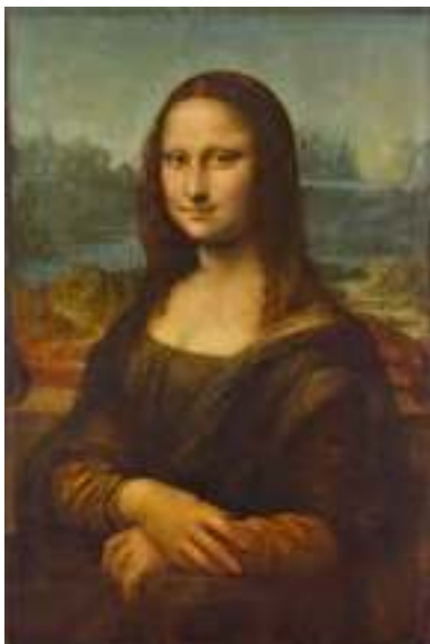
Figura 17. Foto17.

Se seleccionaran tres variantes del famoso retrato realizadas por alumnado de otro curso. En clase se les mostrarán las obras y se realizará un comentario sobre las mismas mostrando la obra original y diferenciando las principales partes en las que se han realizado las modificaciones.