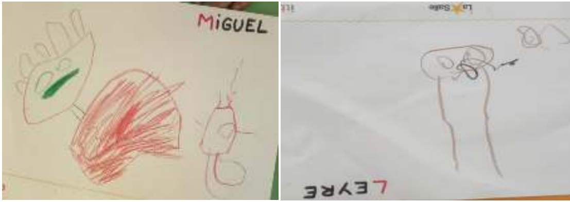
Figura 2. Foto2. Fuente: Elaboración propia (2022). Figura 3. Foto3. Fuente: Elaboración propia (2022).

En la tercera sesión ( Anexo VIII ) trabajamos en el aula unos puzzles de seis piezas con un retrato de un niño que expresa una emoción. Lo trabajamos por equipos, realizando un total de cuatro y fue una sesión que llevó la profesora del aula para que yo pudiese hacer una observación más detenida. El alumnado tuvo un tiempo para que pudiese realizar por el equipo el puzzle correctamente, no hubo ningún problema, lo completaron correctamente, lo único que necesitó algún grupo fue algo más de tiempo, también algún conflicto surgió a la hora de quién colocaba la pieza, el egocentrismo aún está muy presente en el alumnado de esta edad.