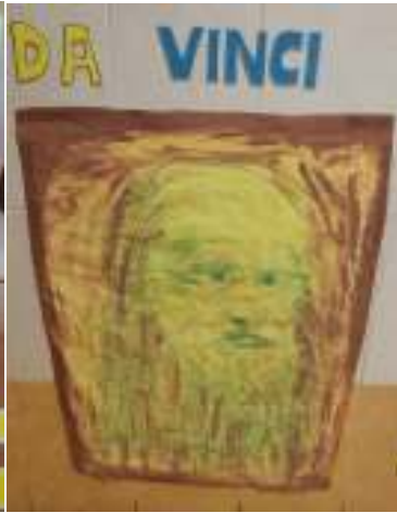
Figura 15. Foto 15.