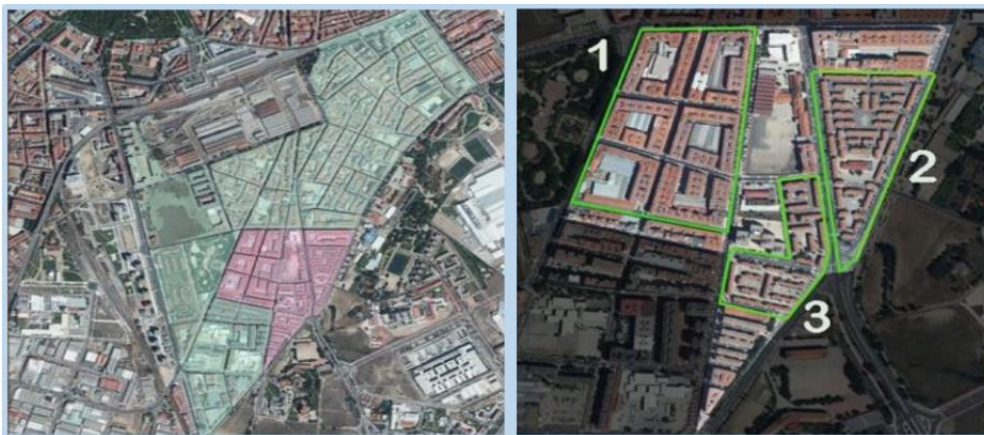
Ilustración 2. Plano detalle de la zona Las Viudas-Aramburu-Caamaño

Forma parte de Delicias Sur (denominado de tal forma por el Ministerio de Transportes, Movilidad y Agenda Urbana en 2011), siendo esta una de las cuatro zonas especialmente vulnerable de la ciudad de Valladolid, según el Catálogo de Barrios Vulnerables. Esta zona ha experimentado una serie de cambios a lo largo del tiempo, teniendo en la actualidad un carácter multicultural, dándose una combinación de población inmigrante, autóctona y de etnia gitana.