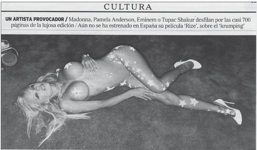
HollyPam!, una de las impactantes fotografías del estadounidense David LaChapelle, en la que su amiga Pamela Anderson se presta totalmente a su 'juego' con indisolubles tintes eróticos.