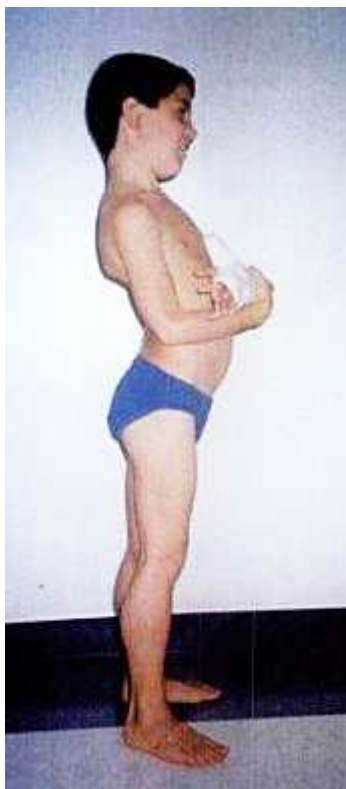
Figura 2: Postura de un niño afectado de DMD.