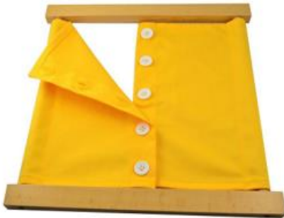
Bastidor de botones pequeños

de aprender a relacionarse con los demás. Algunos ejemplos de estos materiales son los siguientes: