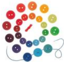
Botones de madera para enhebrar