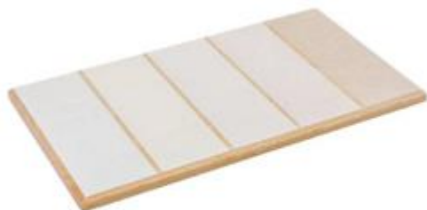
Tabla de lija en graduación, para trabajar el tacto.