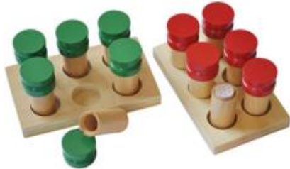
Cilindros de olor, para trabajar el olfato.