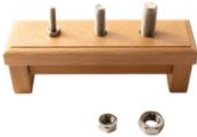
Base de 3 tuercas