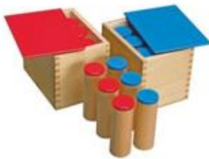
Cilindros de sonido, para trabajar el oído.