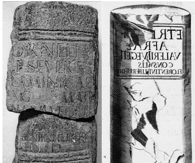
Figura 2: Pedestal y dibujo encontrado en la alcazaba (Pastor Muñoz 2013: 34)

Comenzamos con el ejemplo de los Valerii Vegeti , sin duda alguna una de las familias de más rancio abolengo de la ciudad 36 , como hecho diferencial tenemos el caso de que la esposa de Q. Valerio Vegetu fue flamínica personal de la emperatriz Pompeia Plotina, Cornelia Severina 37 , de quien se encontró un pedestal en la alcazaba (Fig. 1), el propio Valerio Vegetu tuvo igualmente un cursus honorum destacable siendo cónsul en el 91 d.C. con Domiciano para acabar mudándose finalmente a la colina del Quirinal 38 . Su hijo