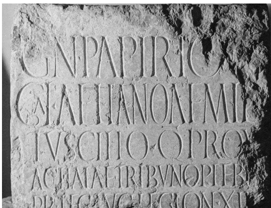
Figura 5: Inscripción que hace referencia a Cneo Papirio (Pastor Muñoz 2013: 37)

El último ejemplo que traemos en este trabajo es el caso de la familia de los Papirios , sin duda alguna una de las más conocidas y asociadas a Iliberri , nuevamente el primero fue Cneo Papirio Aeliano Aemilio Tuscillus, quien desempeño diversos cargos bajo los emperadores Adriano y Antonino Pio 52 , entre los que destaca ser el gobernador de Britania o de la recientemente conquistada Dacia en el 132