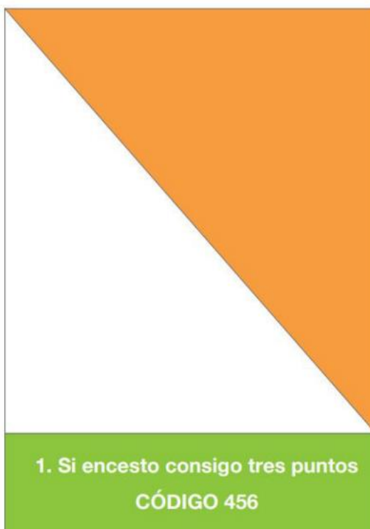
EJEMPLO DE BALIZA