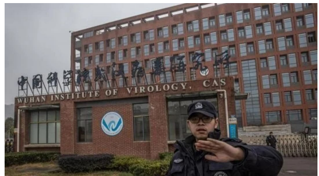
Personal de seguridad intenta evitar que el fotógrafo tome imágenes del Instituto de Virología de Wuhan en China