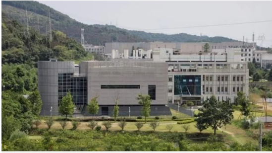
Laboratorio P4 del Instituto de Virología de Wuhan, a las afueras de la ciudad. Aunque los científicos creen que el coronavirus es de origen natural, algunas teorías apuntan a una fuga de laboratorio