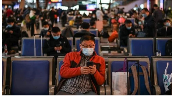
Pasajeros aguardan esta semana en la estación de tren de Wuhan, en la provincia central de China de Hubei