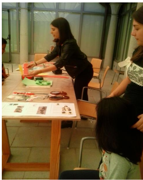
Fotografía del taller !Y yo con estos pelos!, realizado en el Museo de Segovia con motivo de la celebración del Día Internacional de los museos.