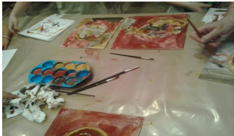
Fotografía del Taller “Del huevo al aceite: el Arte del Medioevo hacia el Renacimiento”.

Después comprobábamos las diferencias de los "cuadros" recién elaborados con las pinturas del Renacimiento, donde ya se empezaban a utilizar como base aceite...pintura al óleo y que habíamos visto en el primer recorrido por la exposición.