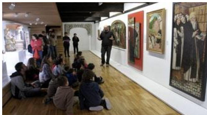
Fotografía del Museo de Segovia.