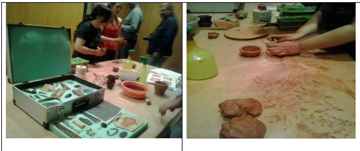
Fotografías del Taller de manualidades arqueológicas en el museo de Segovia.

Objetivo: Se pretende acercar el mundo de la cerámica y su arqueología a los niños.