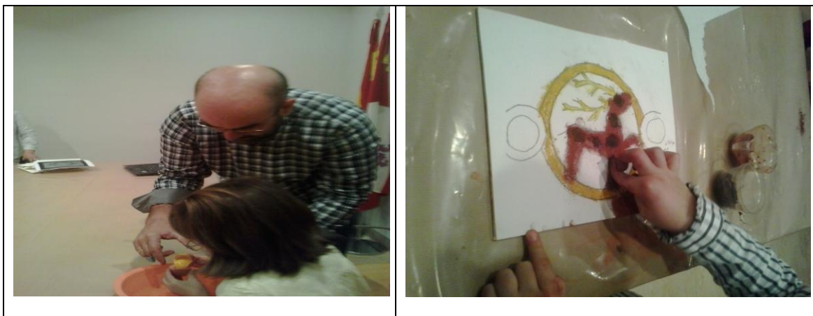
Fotografías del “Taller del huevo al aceite”.

Por tanto, en nuestras salidas, en este caso la visita al museo, debe plantearse desde la experiencia, qué saben nuestros alumnos previamente, qué conocen, qué han oído, indagar en lo que han experimentado antes respecto a los museos, para poder planificar desde ahí, y conectar con sus intereses; para ello debemos realizar actividades que nos ofrezcan esta información, debemos observar, escuchar de forma activa lo que dicen los niños, detectar cual es su momento evolutivo a este respecto, para ajustar así nuestra propuesta didáctica, con los objetivos clave de lo que vamos a ser capaces de conseguir; por otro lado, desde la motivación, procurar una disposición positiva hacia este aprendizaje desde el descubrimiento, desde el cuestionamiento, donde voy a destacar un claro ejemplo, con niños en edades de nuestros alumnos de segundo ciclo , entre 3 y 6 años, el Taller del huevo al aceite , anteriormente mencionado.