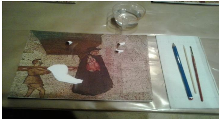
Fotografía del Taller de Restauración de Pintura.

Nos recreamos en un sencillo proceso de restauración, donde utilizamos cola, para adherir las partes separadas y pintamos las zonas deterioradas.