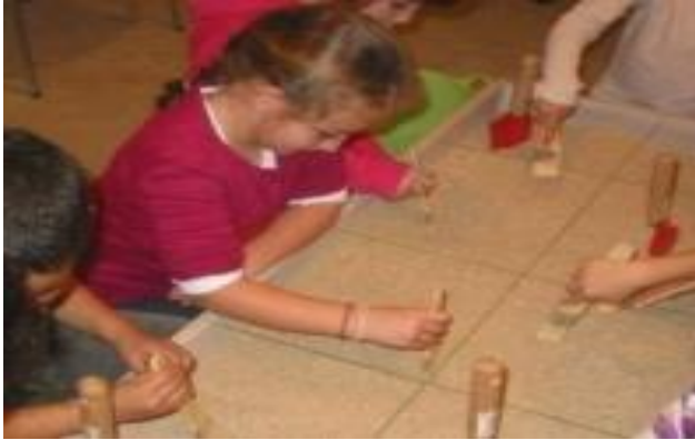
Fotografía del Taller " Los mas pequeños van al museo" con alumnos de infantil