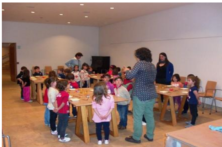
Fotografía del Taller " Los mas pequeños van al museo" con alumnos de infantil

Fuente: Técnica de Gestión Cultural, Carmen Quesada