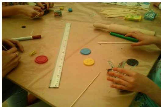
Fotografía del taller ¿Qué hay en tu hucha? realizado en el Museo de Segovia con motivo de la celebración del Día Internacional de los museos.