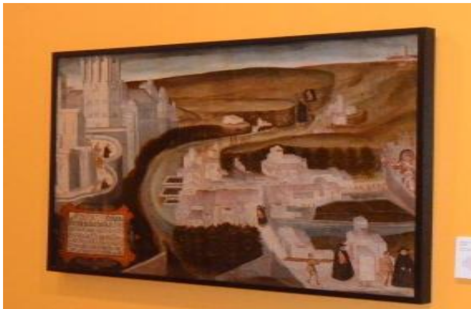
" Milagro de San Gil " Anónimo. S. XVI. Óleo sobre lienzo.

En esta propuesta educativa, de buscar, encontrar, mirar, observar, descubrir la información que contiene una obra artística del museo, en este caso, un cuadro, siguiendo la metodología que permite el descubrimiento de información (García, 1994).