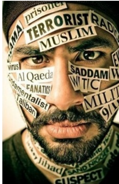
Photo 2 - Une production artistique illustrant de manière physique les stéréotypes qui « collent » à la peau des musulmans dans l'imaginaire collectif relayé par les médias.

Enfin, le visage de l'islam change considérablement d'un pays à l'autre, selon son histoire. Au Royaume-Uni, par exemple, la plus grande partie de la population musulmane est d'origine pakistanaise ; en Allemagne, elle est d'origine turque. Au niveau mondial, le pays musulman le plus peuplé se situe en Asie : il s'agit de l'Indonésie, avec plus de 200 millions de fidèles, devant l'Inde et le Pakistan. (2015 : 2)