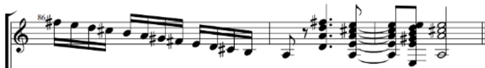
Figura 28. Cadencia final en la transcripción sobre el acorde de La mayor (tónica). (Anexo 8)

En líneas generales, la esencia de esta pieza no es más que un juego tonal entre los grados de tónica (Do mayor) dominante (Sol mayor) y subdominante (La menor), formando cadencias perfectas. Tanto en la sección A como en la B hay una serie de compases que indican un aparente giro modal frigio sobre el acorde de VI (La mayor), pero que acaban resolviendo sobre una cadencia tonal.