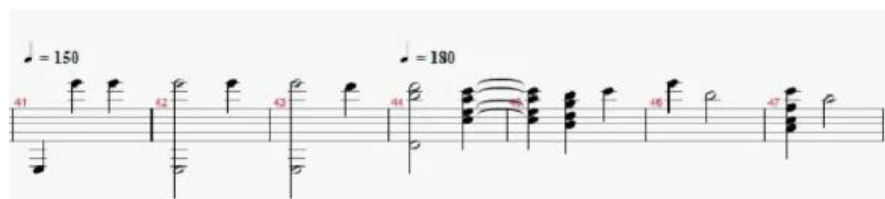
Figura 7. Comienzo del tema B (estribillo). (Anexo 2)