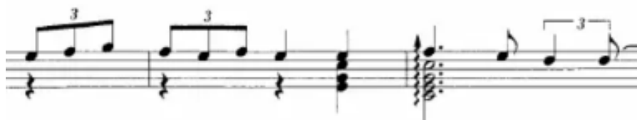
Figura 17. Inicio del estribillo en tonalidad mayor (DoM). (Anexo 4)

Sucede que Paco de Lucía emplea en esta pieza una cejilla en el tercer traste, por lo que todo está un tono y medio más agudo (de Mi a Sol). Además, ocurre también que, como con el resto de los fandangos, la voz, en este caso la “letra” o estribillo tiene una melodía tonal, concretamente de Do mayor en la partitura (Mib7 auditivamente), de la cual presento un fragmento a continuación. Por lo tanto, estamos ante una armonía bimodal característica de los fandangos de Huelva 119 .