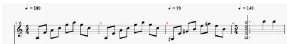
Figura 5. Pasaje Introductorio. (Anexo 2)

A continuación, muestro una serie de transcripciones con sus respectivas leyendas que ayuden al lector a entender mejor estas características.