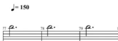
Figura 11. Sección final del estribillo. (Anexo 3)

Al mismo tiempo, para finalizar cada una de las secciones, Paco de Lucía emplea un motivo rítmico-melódico recurrente que consiste en la sucesión de varios compases con una sola nota, en este caso en forma de blanca con puntillo. Esto también tiene que ver con el hecho de que cada una de las estrofas sea variación del estribillo. A continuación muestro un ejemplo.