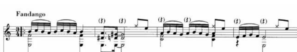
Figura 14. Introducción. (Anexo 4)

En la estructura general de “Punta Umbría” se intercala la “letra” de un fandango con una serie de cinco falsetas (Introducción – Falseta 1 – Falseta 2 – Falseta 3 – “Letra” – Falseta 4 – Falseta 5 – Coda). La pieza comienza con una breve introducción de 8 compases de duración (hasta el minuto 0:11) que muestro a continuación.