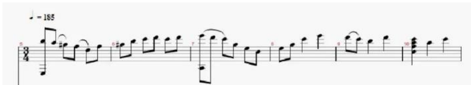
Figura 6. Comienzo del tema A. (Anexo 2)