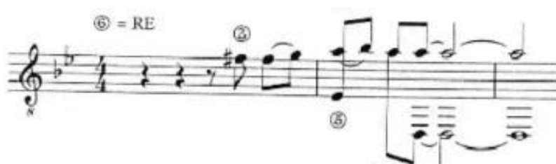
Figura 18. Pregunta (cadencia sobre el V grado en el agudo) (Anexo 5)

Estructuralmente, la pieza comienza con la introducción en formato pregunta-respuesta, cuya transcripción presento a continuación. La pregunta vendría a ser los 2 primeros compases (3 teniendo en cuenta que comienza en anacrusa) (figura 5.1) y la respuesta los 3 siguientes (figura 5.2). Este juego de tensión (pregunta) – resolución (respuesta) también se dará en otras partes, como el estribillo, más marcado aun si cabe, pero de momento sigamos la estructura en orden.