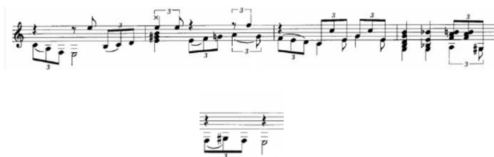
Figura 16. Pasaje final del estribillo y de la falseta 5 con cadencia en Mi. (Anexo 4)

una sección a otra. Después de esta “letra” vienen otras dos falsetas. La cuarta comienza inmediatamente después del final del estribillo, que da paso a otra que inicia 12 compases después tras un nuevo pasaje de rasgueados (minuto 2:35). Esta nueva falseta no es más que una clara variación de la “letra”, pues, aparte de que la melodía empleada es similar, introduce un pasaje final que también se encuentra de manera exacta en la “letra” del fandango y que presento a continuación transcrito.