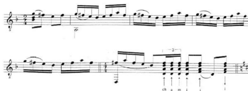
Figura 21. Pasaje de picados del tema C en 2/4. (Anexo 5)

de 2/4 por la velocidad de estos, más acorde a un compás de 2 tiempos que a uno de 4. De hecho, en la transcripción que dispongo en el anexo de este trabajo y a continuación (figura 21) sí llega a realizar este cambio de compás a 2/4 en los picados del final del tema C, antes de introducir el estribillo de nuevo (minuto 1:44).