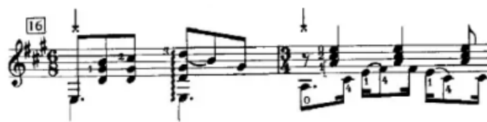
Figura 23. (Anexo 6)

Por tanto, y al igual que ocurría con otras composiciones como “El Vito”, esta se trata de una pieza de sumo interés, ya no solo para el flamenco, sino también dentro de la música de guitarra clásica.