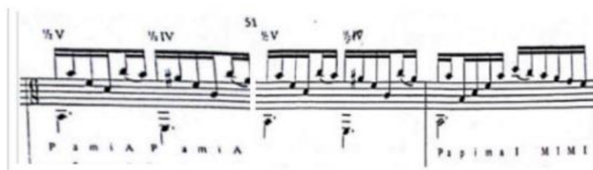
Figura 25. Sucesión de arpeggios sobre el IV y I grado. (Anexo 7)

Otro elemento a destacar, armónicamente hablando, son los apoyos continuos sobre el IV grado (La en la partitura, Si auditivamente), desde la tónica, algo típico de los fandangos y sus derivados, cuyo caso muestro a continuación. 141