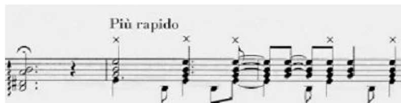
Figura 4. Inicio de la sección 2 sobre acorde de Mi menor (I) tras acorde de Si (V). (Anexo 1.1.)

A continuación, muestro la transcripción correspondiente a la cadencia producida entre las secciones 1 y 2.