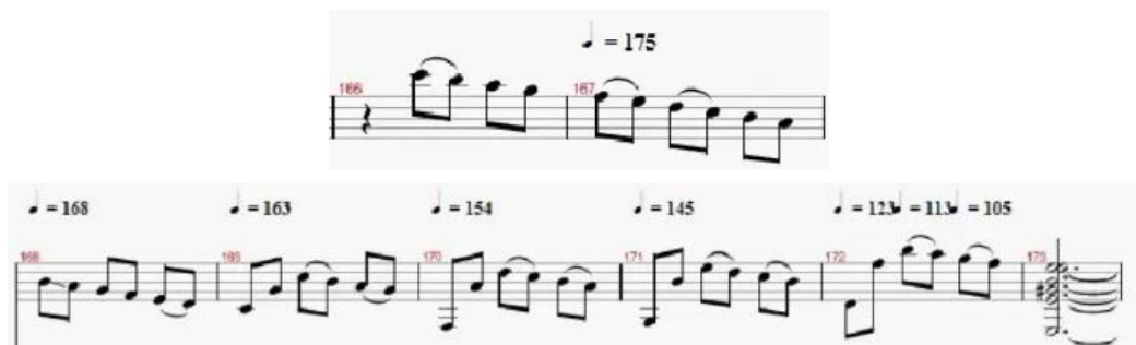
Figura 9. Pasaje final de la pieza (Coda). (Anexo 2)

Como puede observarse, esta pieza no es muy compleja estructuralmente hablando, pues únicamente cuenta con introducción – A – B – B' y coda. En ella, por tanto, cobran mayor relevancia, respecto a la estructura, la armonía o la melodía. Pero antes de pasar a ambos apartados nos centraremos en el ritmo.