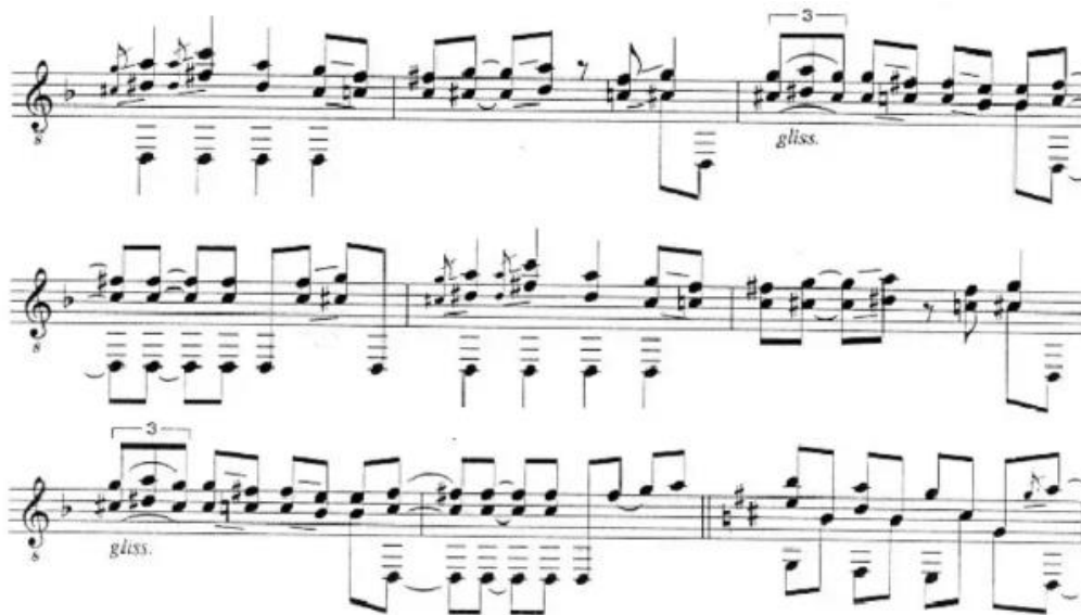
Figura 20. Falseta 5 al completo, comenzando en flexión a SibM (VI grado de Re). (Anexo 5)

Tanto la colombiana como las guajiras (que veremos más adelante), se encuadran en los estilos o palos de ida y vuelta 132 , si bien la colombiana en concreto poco tiene que ver con Colombia pues, como digo, fue creada por Pepe Marchena. En cualquier caso, las colombianas tradicionalmente se encuentran en la tonalidad de La mayor 133 . Lo que se consigue mediante esta scordatura a Re, aparte de otorgar una sonoridad más profunda, es crear continuamente cadencias hacia la tónica (Re, que es IV grado de La), ya que gran parte de las secciones cadencian desde el quinto grado (La) hacia Re.