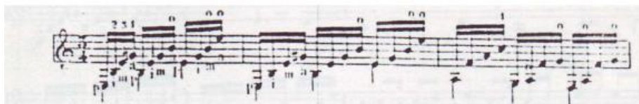
Figura 26. Rondeña de “El Murciano”

acordes en arpeggios más que a tocar todas las notas a la vez. Uno de los ejemplos más míticos es el de la rondeña 142 de Francisco Rodríguez “El Murciano”, quien alrededor del año 1879 compuso una malagueña que tuvo bastante éxito y cuya estructura melódica se sustentaba sobre acordes arpegiados que muestro a continuación. 143