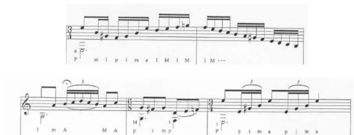
Figura 24. Sección de paso de la primera falseta. (Anexo 7)

sección a base de picados en los compases 22 a 26, que incorpora el cinquillo, figura recurrente al final de cada sección. Se trata de un pasaje que se emplea varias veces para finalizar las falsetas y dar paso al siguiente tema. A continuación, muestro tal sección.