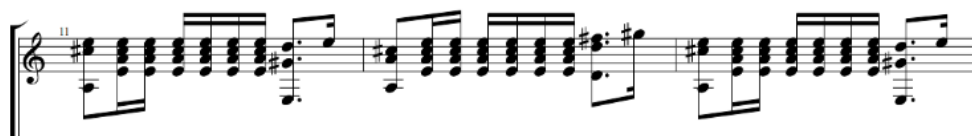
Figura 27. Motivo principal del tema A. (Anexo 8)

introducción la pieza básicamente puede dividirse en otras 3 secciones A, B y una sección final que asemeja a una coda. La sección A se introduce, como digo, tras esta breve introducción y se alarga 31 compases que se repiten de manera exacta desde el comienzo de la pieza, finalizando en el minuto 1:30 aproximadamente. Esta primera sección contiene el motivo principal de la pieza o estribillo (p.ej. minuto 0:40), que se repite durante toda la composición y que está sustentado sobre el siguiente rasgueado.