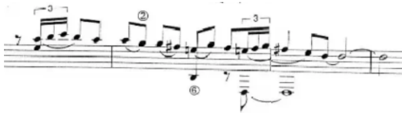
Figura 19. Respuesta (cadencia sobre la tónica en el agudo). (Anexo 5)

Si nos fijamos en la partitura, en la sección introductoria puede observarse como comienzan en Re frigio los dos primeros compases (figura 18) y los dos siguientes modulan a Re mayor, empleando Mi natural, en vez de bemol (figura 19). Esta tensión-resolución en la introducción se produce sobre los grados de La (V) y Re (I), dominante y tónica, respectivamente. El intérprete utiliza este recurso hasta en dos ocasiones. Se alarga hasta el minuto 0:26, en el que Paco de Lucía introduce la transición, reconocible por la inclusión del bajo eléctrico en el compás 26 hacia el tema principal de la pieza, llamado así por ser el motivo recurrente alrededor del cual va a girar la composición. Este da comienzo en el 0:36 o compás 30 tras una doble barra y finaliza en el 1:00 en cadencia sobre Re.