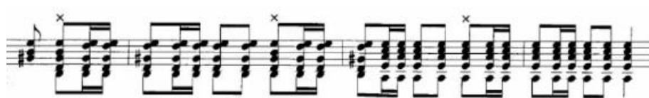
Figura 15. Rasgueado de “Punta Umbría” sobre V (Si) y IV (La) grado de Mi. (Anexo 4)

La primera de las falsetas cuenta con 24 compases de duración (minuto 0:12 a 0:40) y la segunda con 18 compases (finaliza en el 1:02). Tras ellos se incluye un pasaje de transición de 12 compases (minuto 1:03 a 1:13) que da paso, a su vez y tras cadencia andaluza, al rasgueado, característica esencial de cualquier fandango, que transcribo a continuación.