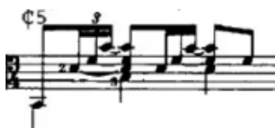
Figura 22. Final de la transición al tema A sobre la tónica de la pieza. (Anexo 6)

Como vemos, esta obra está compuesta en base a motivos y variaciones de dichos motivos. Precisamente el ejemplo más característico es el motivo a cuya melodía y ritmo (coincidiendo con el “atresillamiento” al que hacía referencia antes) acude Paco de Lucía en algunos casos para indicar un final de sección y en otros simplemente como recurrencia con ligeras variaciones melódicas. Concretamente este se presenta de manera exacta al final de secciones como la introducción, la transición al tema A o el propio tema A. A continuación, muestro la transcripción del motivo que, si bien no coincide con lo que se escucha, sirve para hacernos una idea del ritmo y la melodía que emplea Paco de Lucía.