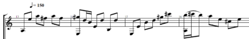
Figura 10. Primeros 4 compases de la sección principal o estribillo. (Anexo 3)

estribillo. La melodía principal, ligeramente arpegiada y cantábil, es fácilmente reconocible tanto auditivamente como en la transcripción, y de ella muestro un extracto a continuación.