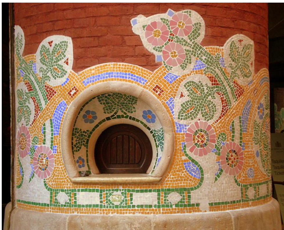
Figura 25: Taquilla con mosaicos. s. XX. Lluís Domènech i Montaner. Palau de la música catalana.