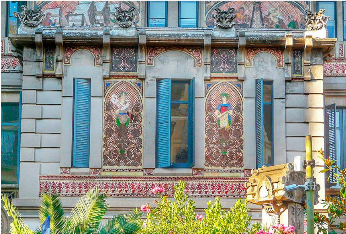
Figura 9: Mosaicos vidriados. s. XIX. Lluís Domènech i Montaner. Palau Montaner.