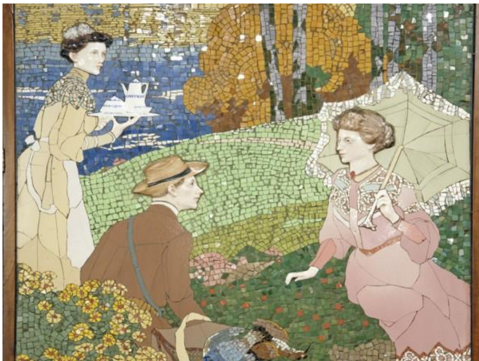
Figura 17: Mosaico cerámico y porcelana en relieve. s. XX. Antoni Serra i Fiter. Casa Lleó Morera.