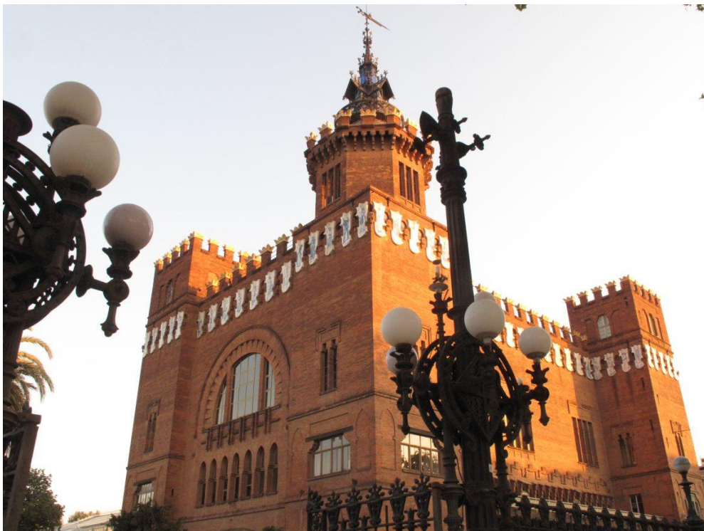
Figura 3: Coronas cerámicas. 1888. Magí Fita. Castell dels Tres Dragons.