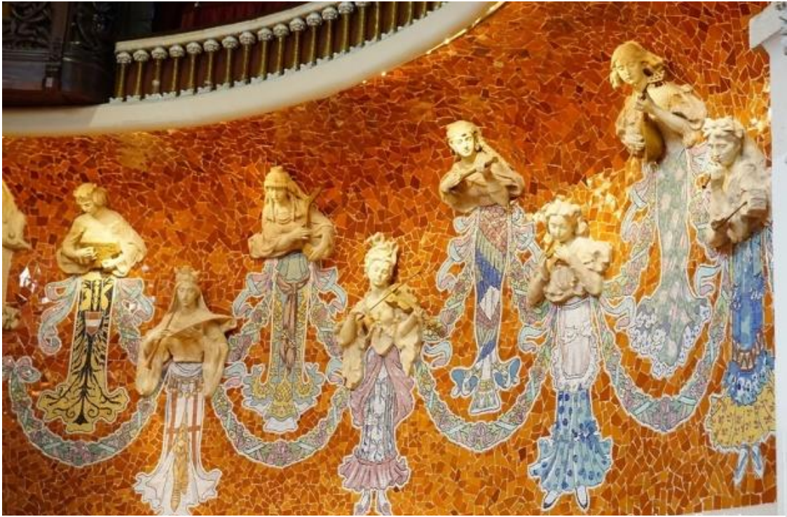
Figura 22: Musas con instrumentos musicales. s. XX. Eusebi Arnau. Palau de la música catalana.