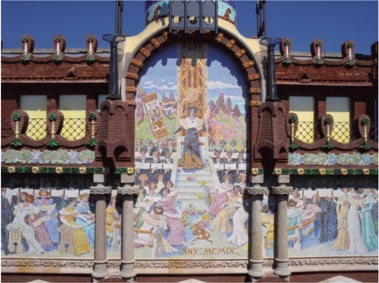
Figura 26: Mosaico del Orfeón Catalán. s. XX. Lluís Domènech i Montaner. Palau de la música catalana.