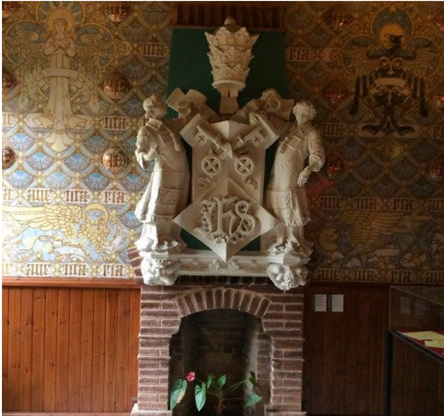
Figura 18: Detalle de comedor. s. XX. Lluís Domènech i Montaner. Casa Domènech i Montaner.