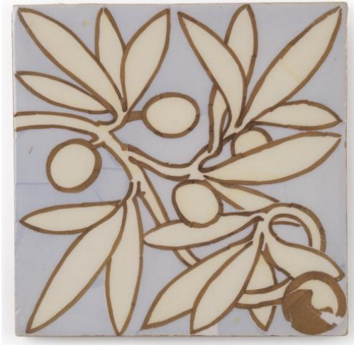
Figura 1: Azulejo a la trepa. 1898. Pujol i Bausis. Casa Museo Domènech i Montaner.