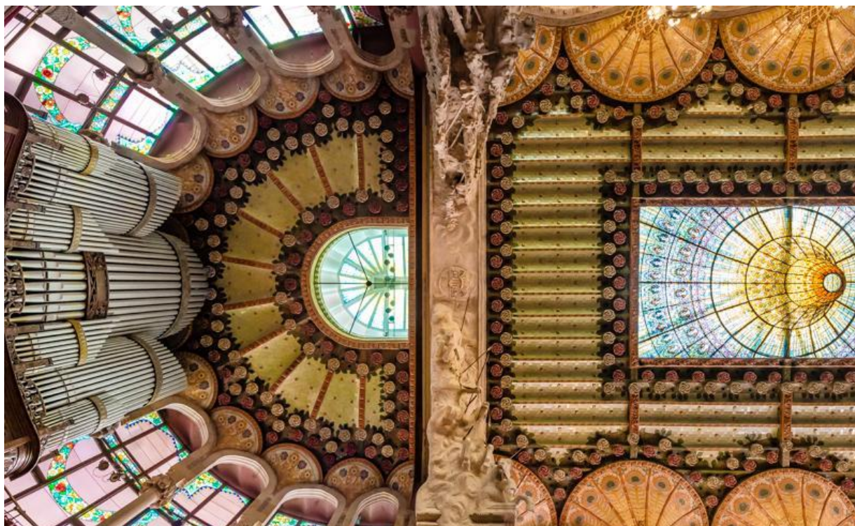
Figura 24: Techo con piezas cerámicas. s. XX. Lluís Domènech i Montaner. Palau de la música catalana.