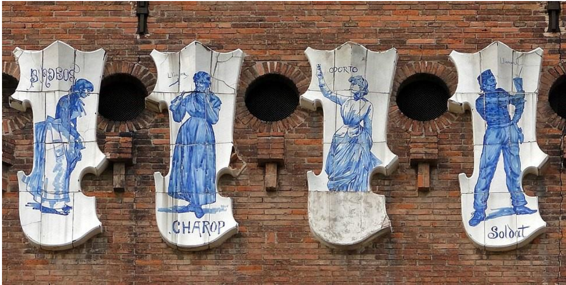
Figura 4: Escudos cerámicos. 1888. Pujol i Bausis. Castell dels Tres Dragons.