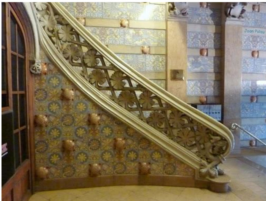
Figura 13: Vestíbulo. s. XIX. Lluís Domènech i Montaner. Casa Thomas.