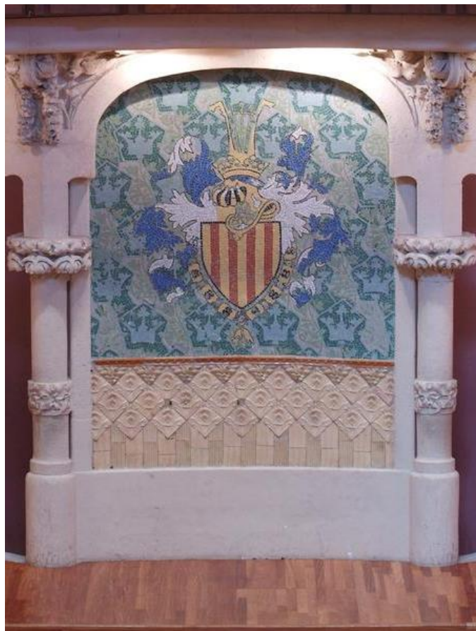
Figura 23: Escudo del Orfeón Catalán. s. XX. Lluís Domènech i Montaner. Palau de la música catalana.