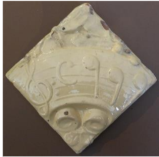
Figura 2: Azulejo en relieve. s. XX. Lluís Domènech i Montaner. Casa Museo Domènech i Montaner.