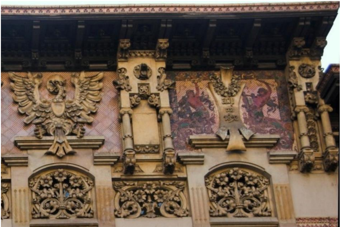
Figura 10: Detalle de la fachada, mosaico con la fecha de finalización del edificio. s. XIX. Lluís Domènech i Montaner. Palau Montaner.