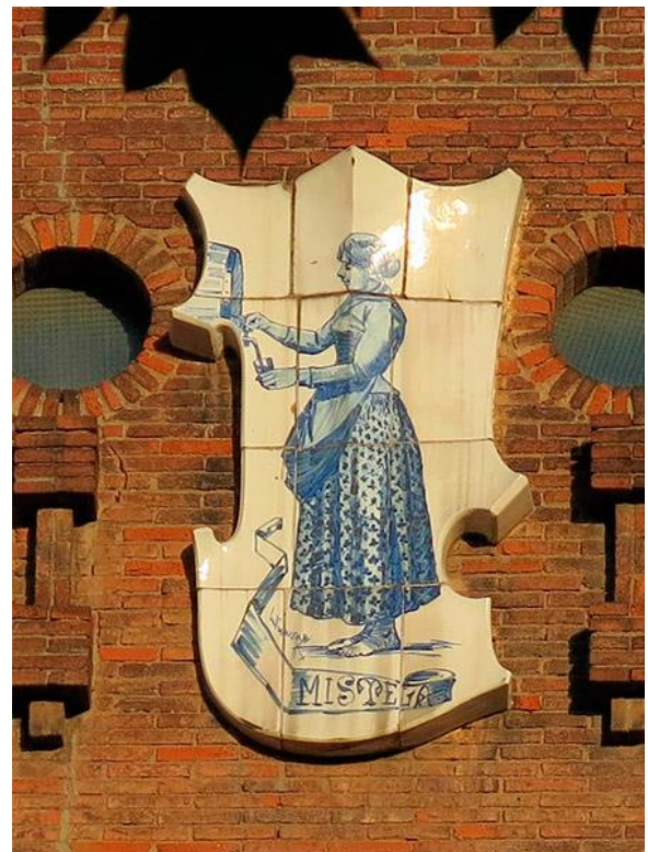
Figura 6: Escudo cerámico. 1888. Pujol i Bausis. Castell dels Tres Dragons.