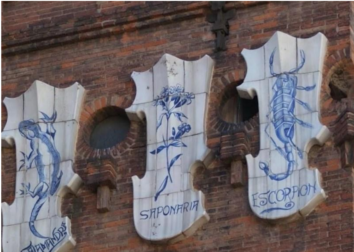
Figura 7: Escudos cerámicos. 1888. Pujol i Bausis. Castell dels Tres Dragons.