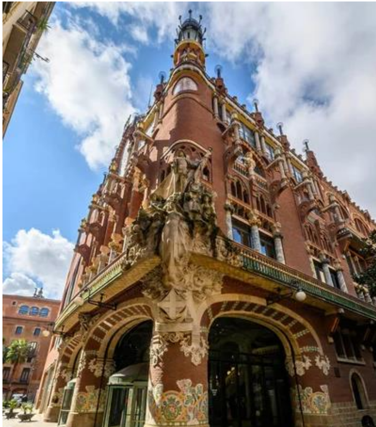
Figura 20: Palau de la música catalana. 1905-1908. Lluís Domènech i Montaner. Barcelona.