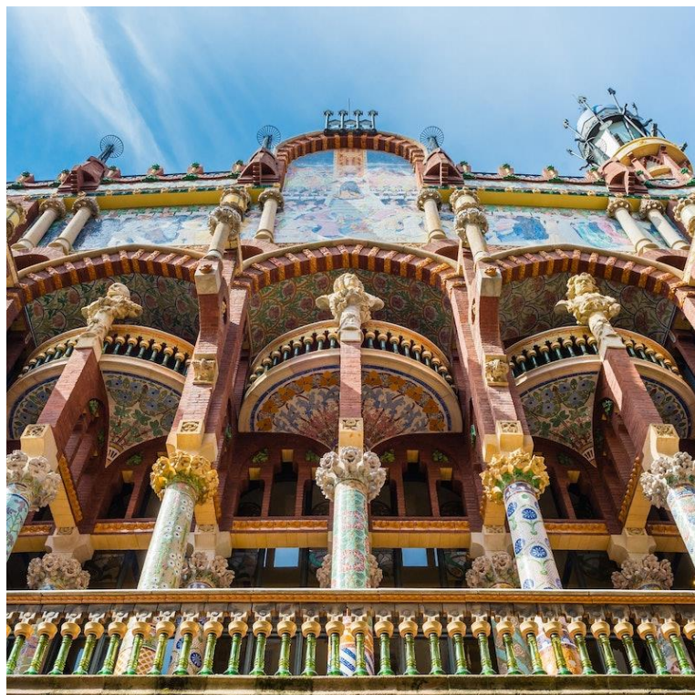
Figura 21: Detalle de la fachada. s. XX. Lluís Domènech i Montaner. Palau de la música catalana.