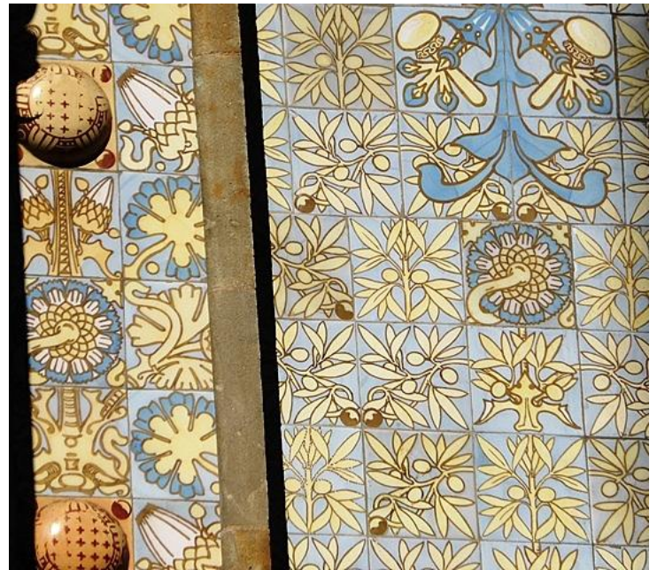
Figura 12: Detalle de la fachada. s. XIX. Lluís Domènech i Montaner. Casa Thomas.