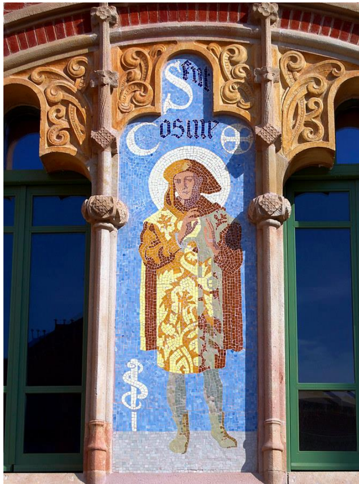
Figura 29: Mosaico de San Cosme. s. XX. Lluís Domènech i Montaner. Hospital de la Santa Creu i Sant Pau.