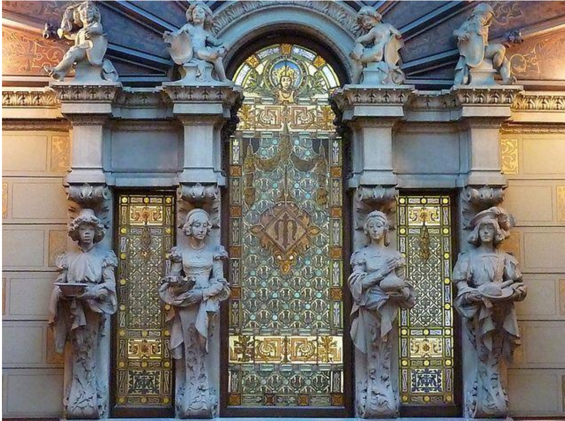
Figura 8: Pajes de Bienvenida. s. XIX. Eusebi Arnau. Palau Montaner.