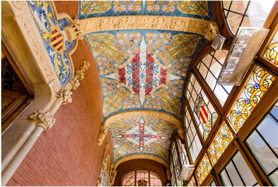
Figura 28: Detalles cerámicos. s. XX. Lluís Domènech i Montaner. Hospital de la Santa Creu i Sant Pau.