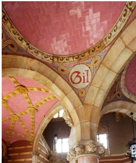
Figura 27: Escudo de Pau Gil. s. XX. Lluís Domènech i Montaner. Hospital de la Santa Creu i Sant Pau.