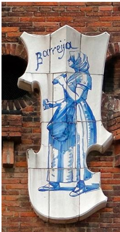
Figura 5: Escudo cerámico. 1888. Pujol i Bausis. Castell dels Tres Dragons.