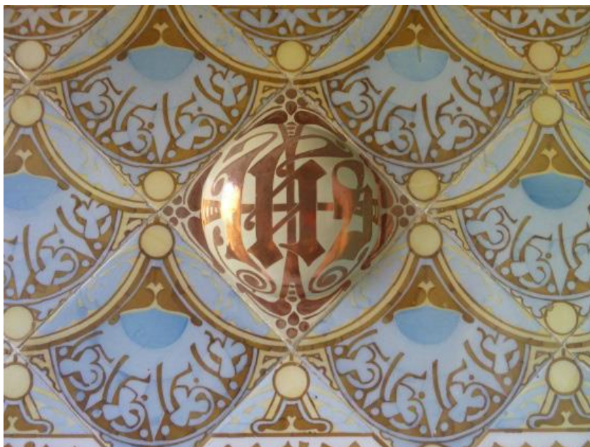
Figura 19: Detalle semiesfera en relieve con las siglas JHS. s. XX. Pujol i Bausis. Casa Domènech i Montaner.