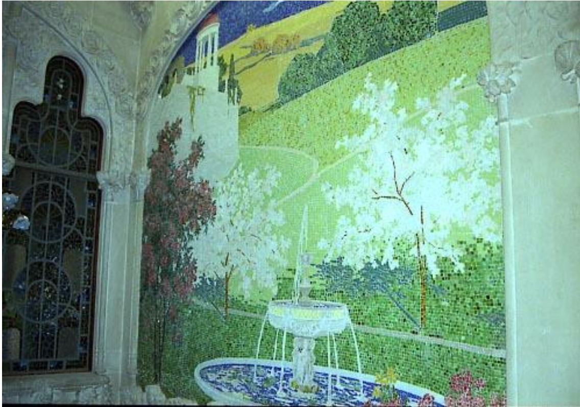
Figura 14: Mosaico con teselas de cerámica. s. XX. Lluís Domènech i Montaner. Casa Navás.