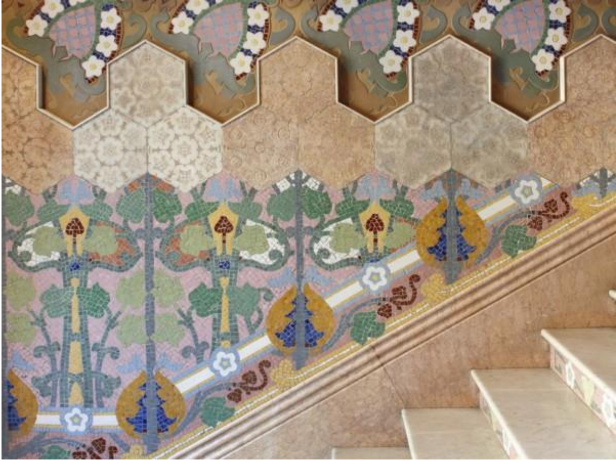
Figura 16: Detalle de escaleras con mosaicos cerámicos. s. XX. Lluís Bru. Casa Lleó Morera.