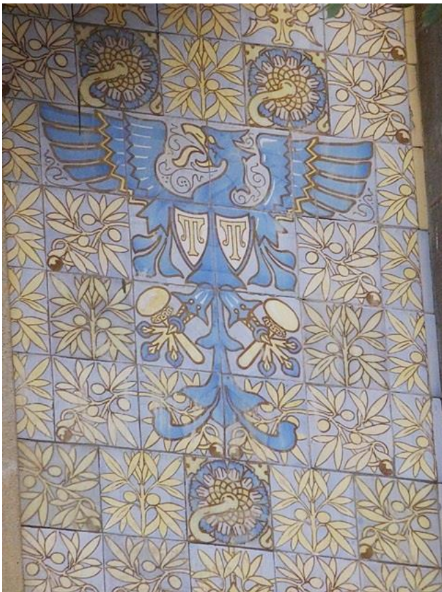
Figura 11: Detalle de la fachada. s. XIX. Lluís Domènech i Montaner. Casa Thomas.