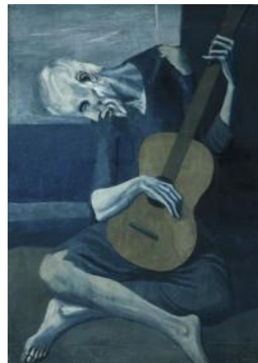
Figura 5. El viejo guitarrista . Etapa Azul.