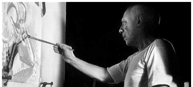
Figura 2. Picasso pintando.