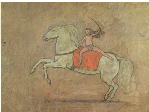
Figura 4. Una amazona de Pablo Picasso. Etapa Rosa. Fuente: de ifema.es

Tras esta investigación cada grupo hará un pequeño debate grupo sobre lo que ha encontrado en su investigación. Tras este debate reflejaremos todo lo descubierto en un papel continuo, en el que pueden reflejar, dibujar o pegar lo que quieran. Más tarde con el apoyo de este papel continuo tendrán que explicar a sus compañeros todo lo que han aprendido, para que de esta manera gracias unos a otros aprendan todas las etapas artísticas de Picasso. Este papel continuo lo colgaremos en el aula como decoración y para que de manera indirecta el alumnado pueda volver a refrescar lo que ha aprendido en cualquier momento.