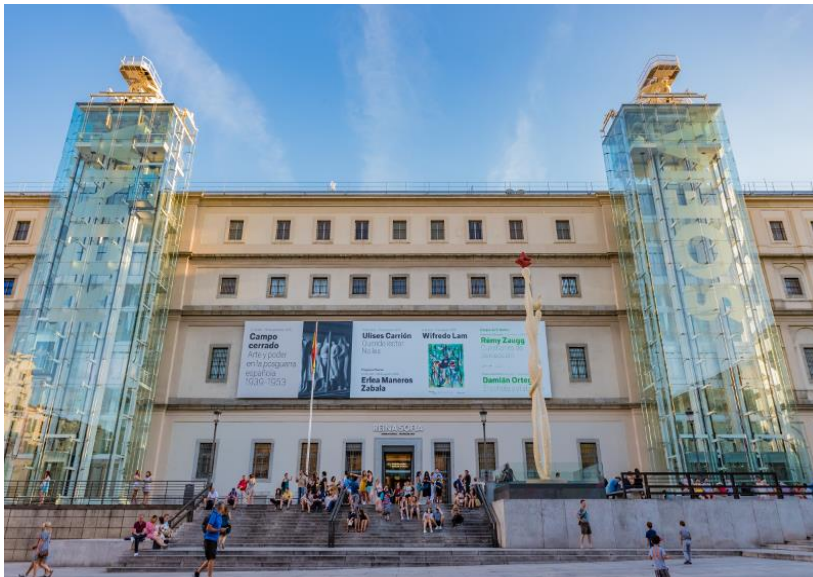
Figura 7. Museo Reina Sofia de Madrid.

El alumnado recorrería los pasillos del museo observando, no solo las obras de Picasso, sino todas las obras de arte contemporáneo allí expuestas. La excursión se realizaría con un guía que dinamizará la visita aportando explicaciones históricas y técnicas al recorrido. Pero aun así la maestra también realizaría algunas indicaciones a los alumnos sobre algunos cuadros principales del museo, con el objetivo fundamental de despertar el interés y la motivación por el arte de los estudiantes. Además, pudiendo servir esto con un pensamiento futuro para retomar esta propuesta con otros artistas contemporáneos de relevancia en la historia del arte.