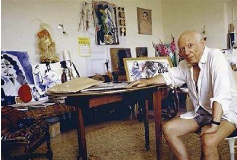
Figura 3. Picasso en su taller.