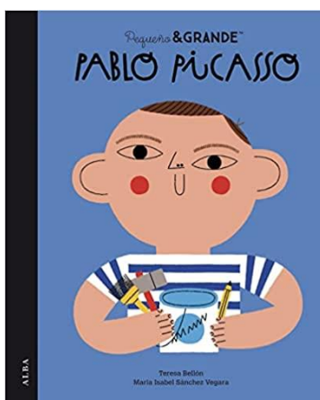
Figura 4. Libro Pablo Picasso .

Después de la lectura del libro en forma de refuerzo veremos un vídeo sobre la técnica y las etapas artísticas del pintor, ya que este aspecto visual es fundamental para llamar la atención del alumnado. Picasso para niños (Valdes, 2021) [Vídeo] Youtube. https://www.youtube.com/watch?v=ZQZEI1cen-4