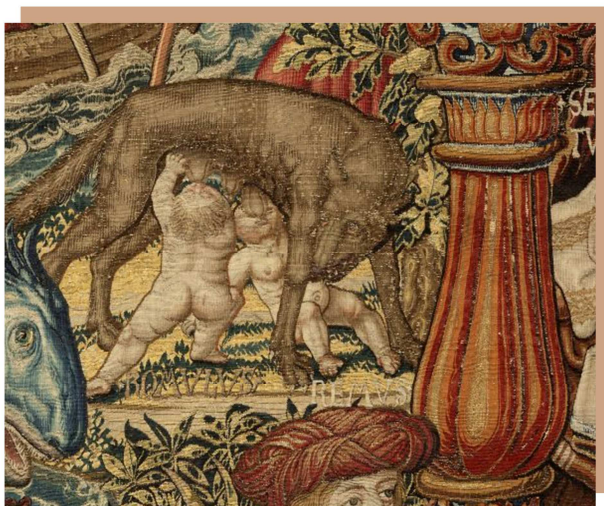
Rómulo y Remo. Tapiz de La Fortuna . Serie de tapices Los Honores . (6,9 x7,81 m) Museo de Tapices del Palacio Real de La Granja, Segovia, Patrimonio Nacional. www.flandesenhispania.org

La leyenda de RÓMULO y REMO que fueron amamantados por la loba, fue ampliamente conocida y repetida en la genealogía.