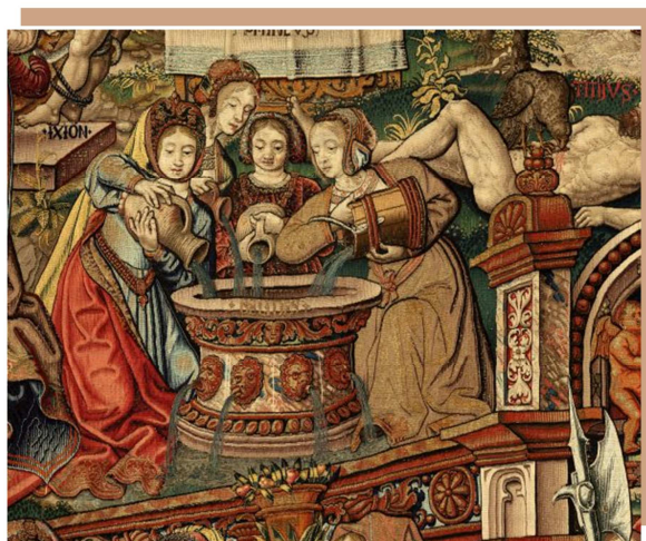
Hermanas Danaides. Tapiz de La Justicia . Serie de tapices Los Honores . (6 x 7,46 m) Museo de Tapices del Palacio Real de La Granja, Segovia, Patrimonio Nacional. www.flandesenhispania.org .

Junto a ellas, tendido en el suelo, está el gigante Ticio que por haber intentado seducir a Latona, la madre de Apolo es castigado.