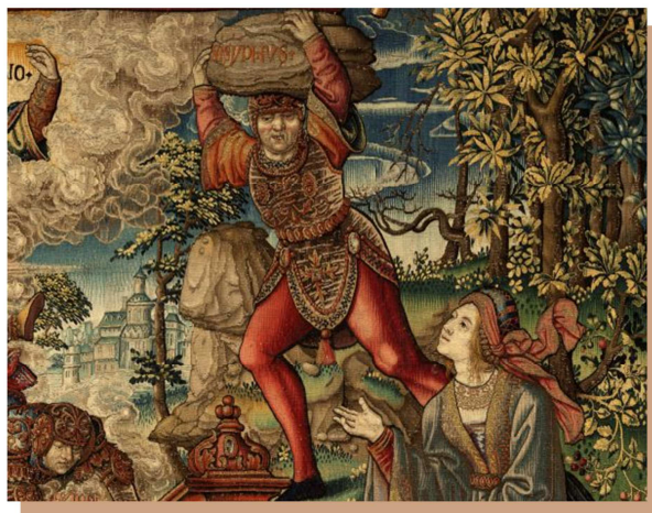
Sisifo. Tapiz de La Justicia . Serie de tapices Los Honores . (6,09 x 10,24 cm) Museo de Tapices del Palacio Real de La Granja, Segovia, Patrimonio Nacional. www.flandesehispania.org .

Júpiter tuvo que intervenir para que la liberase y siguiese cumpliendo sumisión.