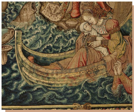
11 Danae. Tapiz de La Fortuna . Serie de tapices Los Honores . (6,42 x7, 94 m) Museo de Tapices del Palacio Real de La Granja, Segovia, Patrimonio Nacional. www.flandesenhispania.org

Sin embargo, Júpiter se enamora de ella y consigue entrar en la torre transformándose en lluvia, dejándola emba