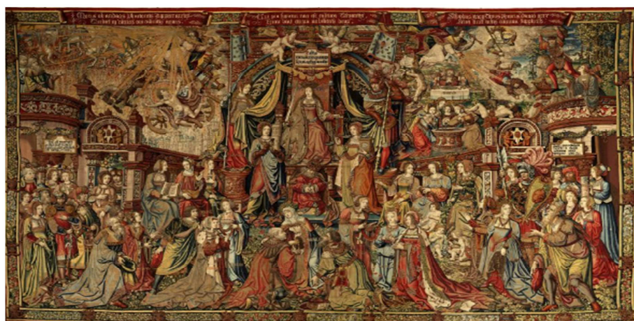
Tapiz de La Justicia. Serie de tapices Los Honores . (6,09 x 10,24 m) Museo de Tapices del Palacio Real de La Granja, Segovia, Patrimonio Nacional. www.flandesehispania.org .

Entre todas las virtudes que debe practicar un gobernante, sobresale la justicia. Esta aparece en el centro del tapiz con sus atributos; el sable y la balanza. A su lado está la fortaleza y la templanza, apoyos en los que se debe sustentar la justicia.