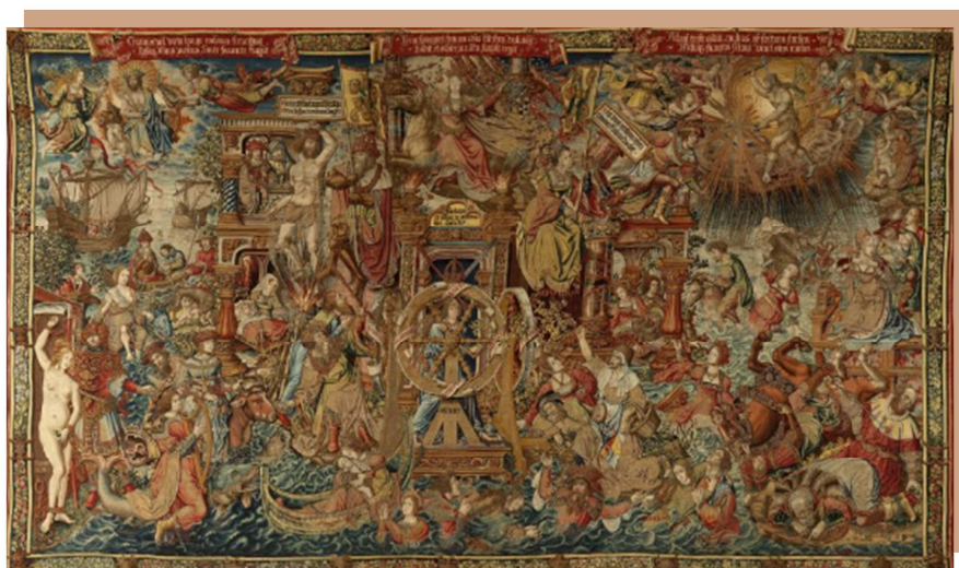
La Fortuna. Serie de tapices Los Honores . (5,27x 9,38 cm). Museo de Tapices del Palacio Real de La Granja, Segovia, Patrimonio Nacional. www.flandesenspania.org

La Fortuna es ciega, lleva los ojos vendados y echa flores a los afortunados que están ubicados en la parte izquierda del tapiz.