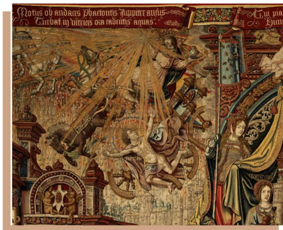
Faetón. Tapiz de La Justicia . Serie de tapices Los Honores . (6,08 x 7,65 m) Museo de Tapices del Palacio Real de La Granja, Segovia, Patrimonio Nacional. www.flandesenhispania.org .

Faetón quería guiar el carro de su padre pero no sabía cómo hacerlo.