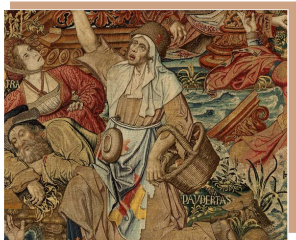
La pobreza. Tapiz de La Fortuna . Serie de tapices Los Honores . (6,14 x 7,75 m) Museo de Tapices del Palacio Real de La Granja, Segovia, Patrimonio Nacional.

Esta escena describe la lucha entre la Fortuna y la Pobreza, ganada por la Pobreza que ata a la Fortuna.