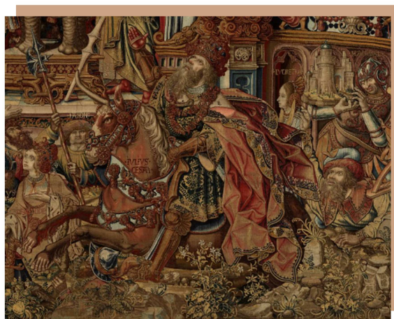
Aquiles. Tapiz de La Fama . Serie de tapices Los Honores . (6,26 x 7,94 m) Museo de Tapices del Palacio Real de La Granja, Segovia, Patrimonio Nacional. www.flandesehispania.org

AQUILES es un personaje de la mitología clásica. Su madre, Tetis, cuando era niño le sumergió en la laguna Estigia, sosteniéndolo por el talón, para hacerle inmortal. Al no sumergir el talón derecho, éste se convirtió en la parte débil de Aquiles.