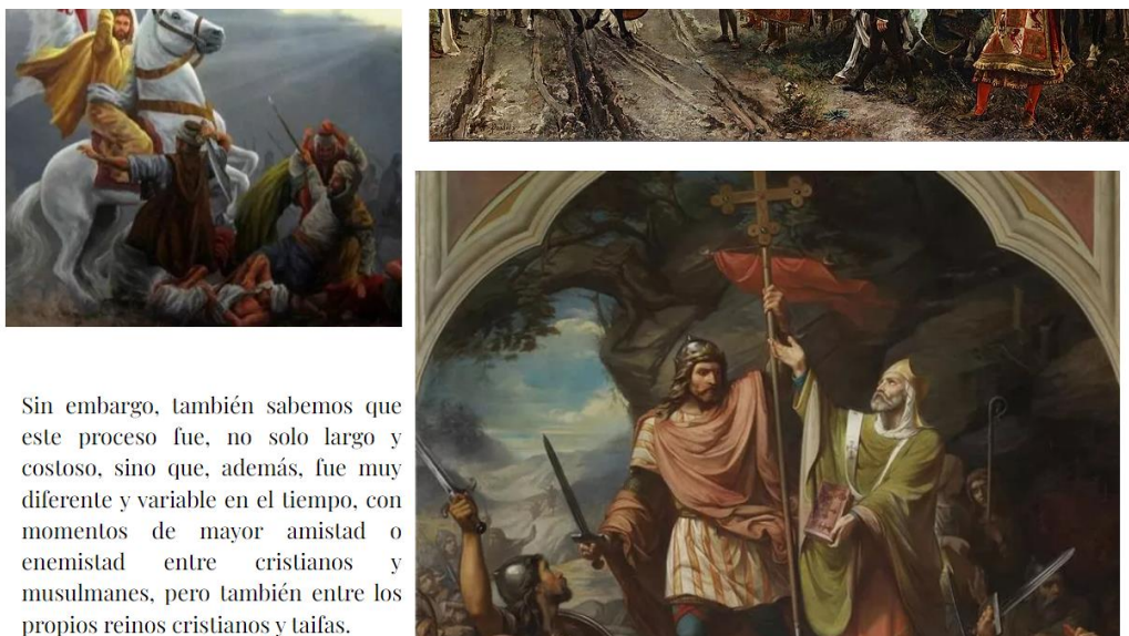
Ilustración 1. Portada de la Webquest.

Sin embargo, también sabemos que este proceso fue, no solo largo y costoso, sino que, además, fue muy diferente y variable en el tiempo, con momentos de mayor amistad o enemistad entre cristianos y musulmanes, pero también entre los propios reinos cristianos y taifas.