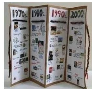
Ilustración. Tarea a realizar por el alumnado.

Con ellos, debes realizar una línea del tiempo en tu cuaderno.