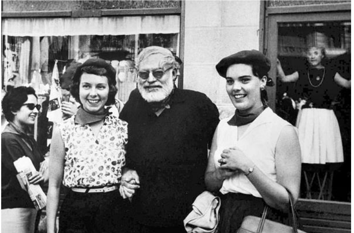
2. Ernest Hemingway en Pamplona. Pamplona y los Sanfermines , Ayuntamiento de Pamplona, pamplona.es/turismo/sanfermin/hemingway [23/05/2022].