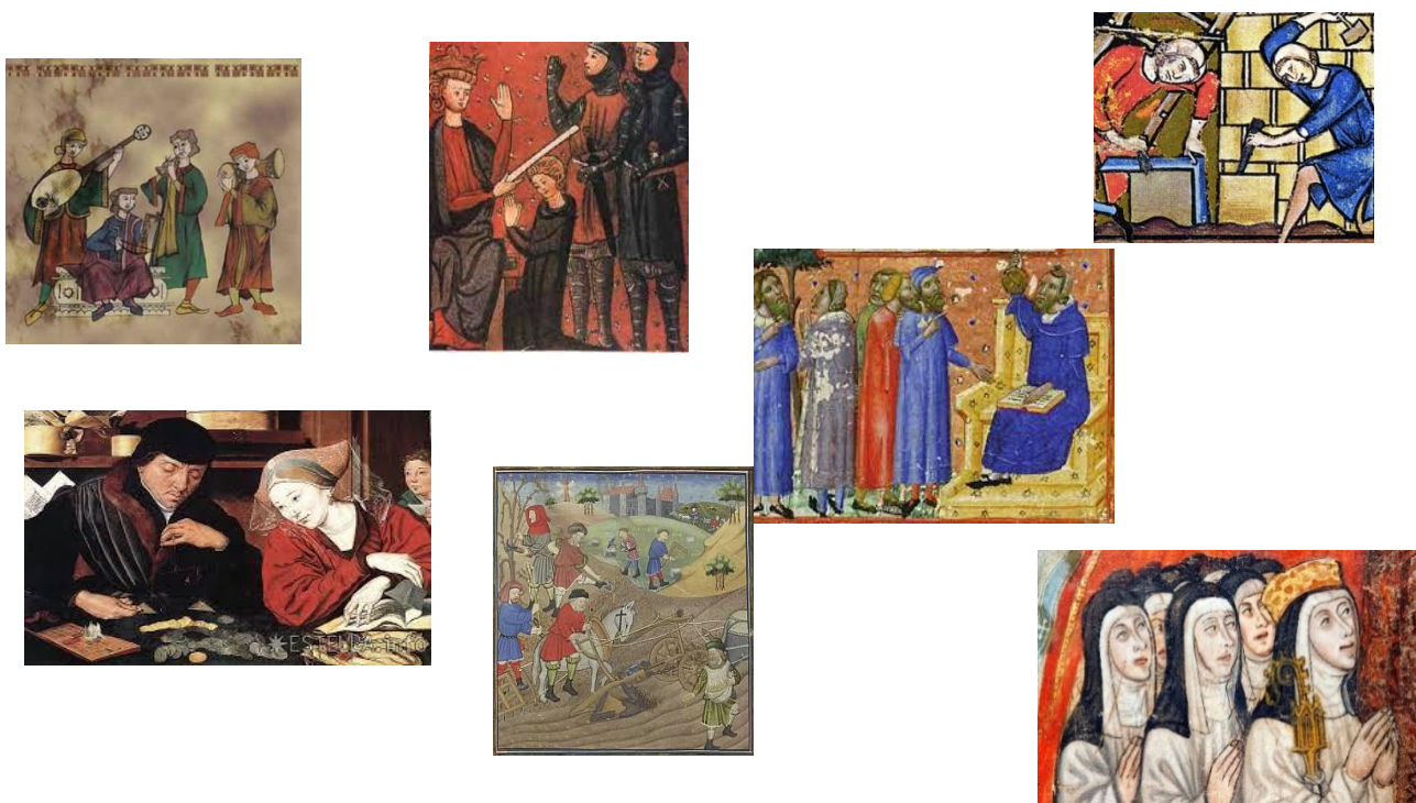
Figura I: ejemplos de tarjetas utilizadas en el juego “¿Quién soy?”

u oficio, pertenencia o no al estamento privilegiado, etc. Las preguntas solo podrán ser contestadas con sí/no.