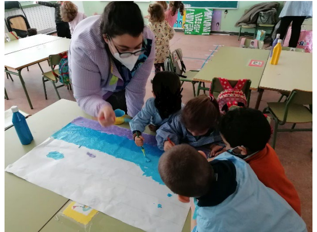
ANEXO 3. RECREAMOS UN