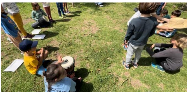
Figura 7. En el jardín realizando el baile

En esta actividad cambiamos el espacio físico del aula y acudimos al jardín. Este simple cambio resultó una motivación extra para los alumnos, ya que nuestra explicación para este cambio fue “para poder tocar más fuerte” y no molestar al resto de compañeros y profesores del colegio. La alumna con S.D. memorizó la canción estrofa por estrofa, bien es cierto que durante la actividad tenía la letra cerca por si necesitaba comprobarla. Destacar que la alumna es bastante tímida y al estar conformada esta actividad de un “baile” (como su propio nombre indica “Baile del Vivo”) y un acompañamiento de percusión nuestra alumna no quiso salir a bailar limitándose a percutir como veremos a continuación.