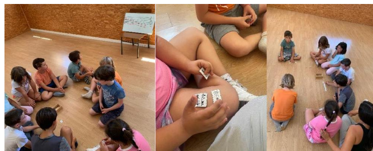
Figura 10. Alumnos jugando al dominó musical con el apoyo del pentagrama

La segunda actividad, “La palabra prohibida” era un juego que conocían por el nombre “Tabú”, y me comentaron que alguno jugaba en su casa.