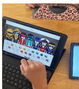
Figura 5. Utilizando la App propuesta

En la implementación de la tercera sesión (Actividad 5, Retahílas de mi tierra, Canarias) la alumna realizó una búsqueda de la retahíla que le tocó, junto a su compañero, para indagar sobre su significado. Esta actividad se realizaba en parejas, suponía un previo trabajo de investigación, además de comunicación verbal entre ambos. Indicar que en el caso de la alumna con S.D. esta familiarizada con la Tablet en base a que diariamente realiza actividades con ella utilizando algunas apps para reforzar su aprendizaje de manera interactiva.