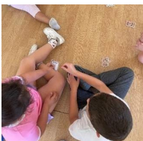
Figura 11. Alumnos intentando averiguar la “palabra prohibida”

La segunda actividad, “La palabra prohibida” era un juego que conocían por el nombre “Tabú”, y me comentaron que alguno jugaba en su casa.