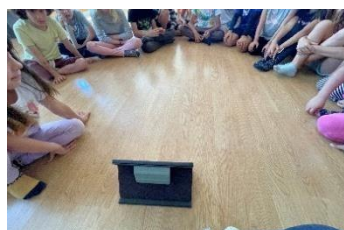
Figura 2. Alumnos observando el vídeo de “Bucket of water” de Mayumaná

Para la posterior realización de cotidiáfonos necesitó la ayuda de sus compañeros, si bien ella se esforzó en realizar algunas de las acciones que implicaban la construcción del cotidiáfono implicando el trabajo de su motricidad fina. No podemos olvidar que posee una motricidad fina que no corresponde a su edad, pero esto no le ha impedido mostrar interés y esfuerzo en la realización de su trabajo. Es una alumna que quiere sentirse independiente, pero a su vez le gusta trabajar con sus iguales de manera cooperativa.