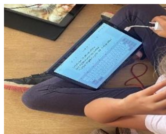
Figura 6. Creando la canción con el significado de la retahíla

Para la sesión número cuatro (Actividad 6, Baile del Vivo), en primer lugar, los alumnos observaron el vídeo de Valentina y posteriormente comenzamos a aprendernos la canción. En primer lugar, hicimos una primera lectura y comentamos previo al aprendizaje el significado de la letra o cualquier otra duda sobre la misma. Me sorprendió la rapidez con la que memorizaron la letra, incluso nuestra alumna con S.D. si bien para ayudar a la memorización previamente le habíamos facilitado la letra para su aprendizaje en casa. Destacar que muchos de los alumnos la conocían, al ser popular y puede que la hubiesen escuchado en algún momento de su vida.