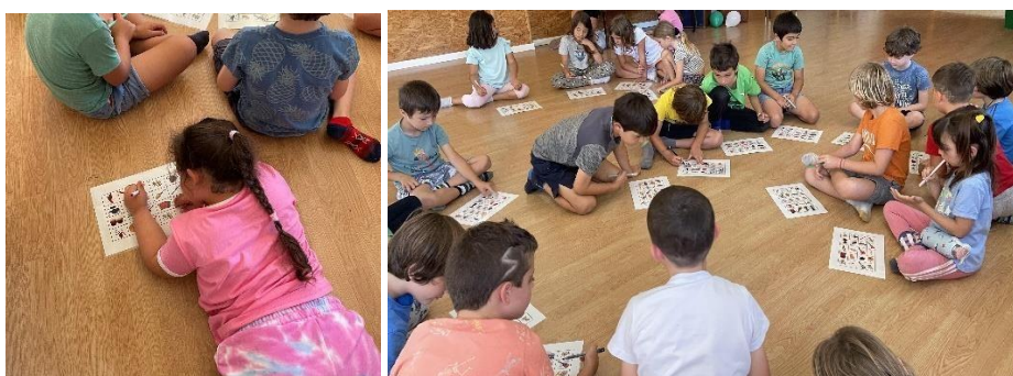
Figura 12. El grupo-clase cantando línea y bingo

En definitiva, las actividades de nuestra propuesta implementadas en nuestro aula han supuesto el trabajo y por tanto, se podría deducir que en cierta medida el desarrollo de algunas facultades tanto cognitivas (memoria, expresión y comprensión verbal, nociones temporales inherentes a la música), motrices como sociales (comunicación e interacción) en todos los alumnos del aula y de forma específica en nuestra alumna con S.D. contribuyendo de esta manera a la minimización de ciertas características de la discapacidad.