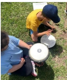
Figura 8. Percusión con los yembés

En esta actividad cambiamos el espacio físico del aula y acudimos al jardín. Este simple cambio resultó una motivación extra para los alumnos, ya que nuestra explicación para este cambio fue “para poder tocar más fuerte” y no molestar al resto de compañeros y profesores del colegio. La alumna con S.D. memorizó la canción estrofa por estrofa, bien es cierto que durante la actividad tenía la letra cerca por si necesitaba comprobarla. Destacar que la alumna es bastante tímida y al estar conformada esta actividad de un “baile” (como su propio nombre indica “Baile del Vivo”) y un acompañamiento de percusión nuestra alumna no quiso salir a bailar limitándose a percutir como veremos a continuación.